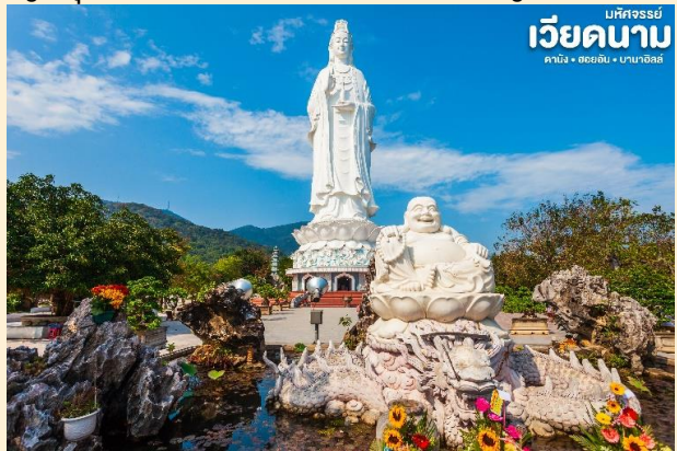
เวียดนาม มณฑลจรรยา ดานัง • ฮอยอัน • บานาฮิลล์

นำท่าน สักการะ วัดลินห์อึ้ง (Linh Ung) เป็นวัดที่ใหญ่ที่สุดของเมืองดานังภายในวิหารใหญ่ของวัดเป็นสถานที่บูชาเจ้าแม่กวนอิมและเทพองค์ต่างๆตามความเชื่อของชาวบ้านแถบนี้ นอกจากนี้ยังมีรูปปั้นปูนขาวเจ้าแม่กวนอิมซึ่งมีความสูงถึง 67 เมตรตั้งอยู่บนฐานดอกบัวกว้าง 35 เมตรยื่นหันหลังให้ภูเขาและหันหน้าออกทะเลคอยปกป้องคุ้มครองชาวประมงที่ออกไปหาปลา นอกชายฝั่งวัดแห่งนั้นนอกจากเป็นสถานที่ศักดิ์สิทธิ์ที่ชาวบ้านมากราบไหว้บูชาและขอพรแล้วยังเป็นอีกหนึ่งสถานที่ท่องเที่ยวที่สวยงามเป็นอีกหนึ่งจุดชมวิวที่สวยงามของเมืองดานัง และแวะให้ท่านเลือกชมและซื้อของฝากเป็นที่ระลึกที่ ร้านเยื่อไผ่