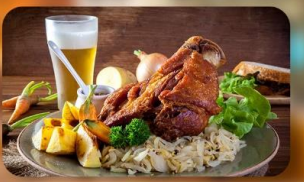
พิเศษ! ลิ้มลองเมนูประจำชาติ ทั้ง 5 ประเทศ!!!