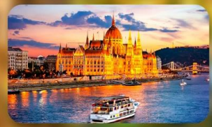
ล่องเรือแม่น้ำดานูบ ช่วง Twilight พร้อมจิบแชมเปญ