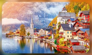
การ์นต์ฟิช Hallstatt / St. Wolfgang หรือริมทะเลสาบ 1 คืน