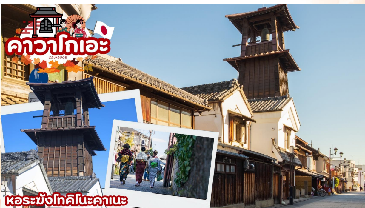
GO2HND-TG051 -- TOKYO FUJI KOCHIA ENOSHIMA 6D 3N BY [TG]

เดินทางสู่ คาวาโกเอะ (Kawagoe) ได้รับการขนานนามว่าเป็น ลิตเติลเอโดะ เพราะมีบรรยากาศที่มีความเป็นเมืองเก่าที่ได้กลิ่นอายโบราณทำให้รู้สึกเหมือนได้ย้อนยุค ได้สัมผัสบรรยากาศของโกดังเก่า ที่เรียงรายกันยาวตลอดระยะทางกว่า 700 เมตร ในสมัยก่อนเป็นสถานที่เก็บกักเสบียงอาหารเพื่อส่งไปให้เมืองเอโดะ (โตเกียวในปัจจุบัน) แต่ในปัจจุบันได้ถูกเปลี่ยนเป็นร้านค้า ร้านอาหาร ร้านขายของที่ระลึก ไม่ว่าจะเป็นร้านขนมที่ทำจากมันหวานสีเหลืองและสีม่วงอันเป็นผลิตภัณฑ์ขึ้นชื่อของเมืองนี้ สถานที่ท่องเที่ยวอันมีชื่อเสียงของเมืองคาวาโกเอะ