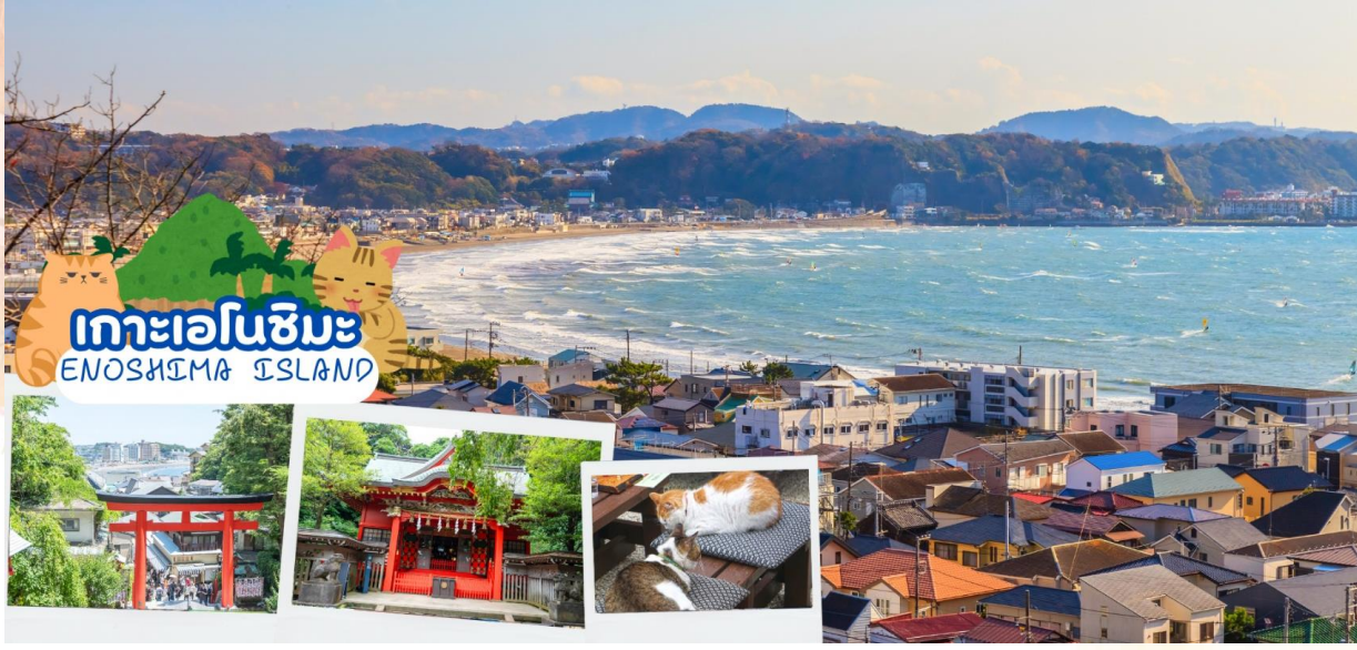
กลางวัน อิสระอาหารกลางวันตามอัธยาศัย