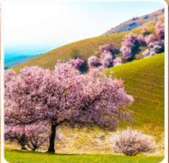
ทุ่งดอกอัลมอนด์