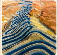
ถนนผานหลงกู่ต้าว