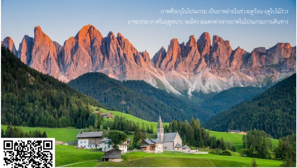
ภาพที่ระบุในโปรแกรม เป็นภาพถ่ายในช่วงฤดูร้อน-ฤดูใบไม้ร่วง ภาพบรรยากาศในฤดูหนาว จะมีความแตกต่างจากภาพในโปรแกรมการเดินทาง