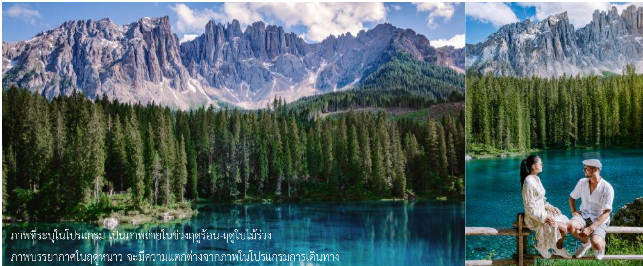
ภาพที่ระบุในโปรแกรม เป็นภาพถ่ายในช่วงฤดูร้อน-ฤดูใบไม้ร่วง ภาพบรรยากาศในฤดูหนาว จะมีความแตกต่างจากภาพในโปรแกรมการเดินทาง

มองเห็นได้อย่างชัดเจนจากทุกมุมมอง ท่านจะได้ชมความงามของภูเขา Dolomites ซึ่งได้รับการขึ้นทะเบียนเป็นมรดกโลกจากยูเนสโก ถึงเวลาอันสามควรมานำท่านเดินทางกลับลงมาที่ตัวเมืองออดิเซ่