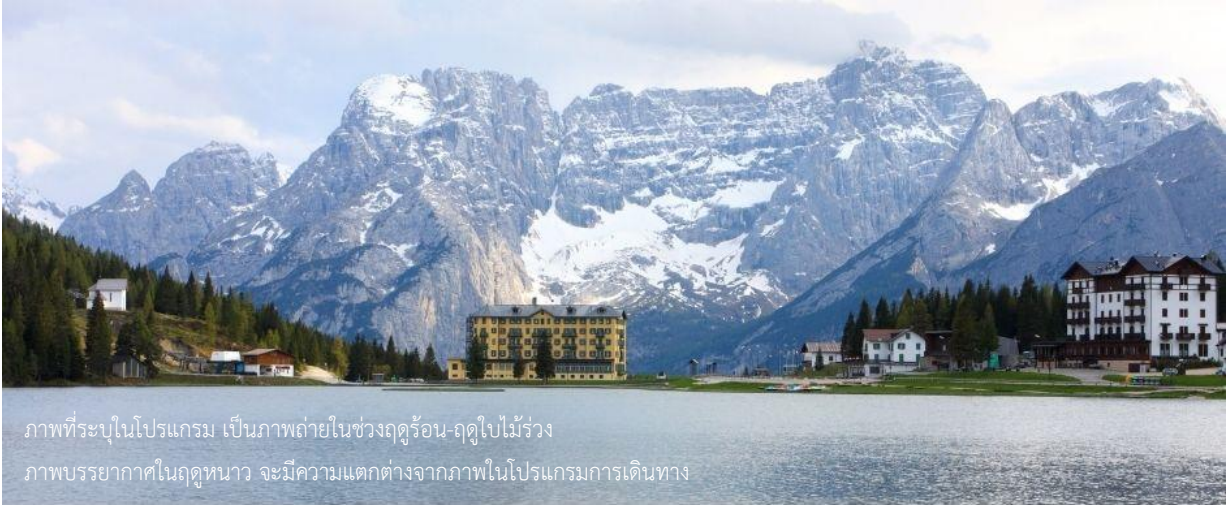
ภาพที่ระบุในโปรแกรม เป็นภาพถ่ายในช่วงฤดูร้อน-ฤดูใบไม้ร่วง ภาพบรรยากาศในฤดูหนาว จะมีความแตกต่างจากภาพในโปรแกรมการเดินทาง