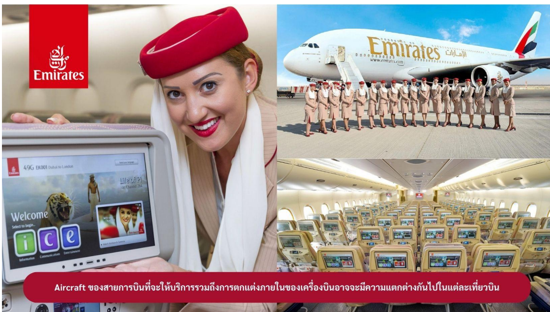
Aircraft ของสายการบินที่จะให้บริการรวมถึงการตกแต่งภายในของเครื่องบินอาจมีความแตกต่างกันไปในแต่ละเที่ยวบิน