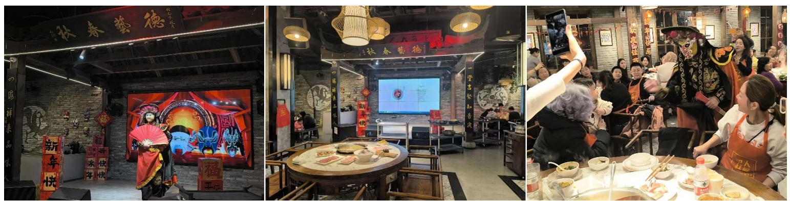
หลังรับประทานอาหารค่ำ นำท่านเดินทางสู่ที่พัก