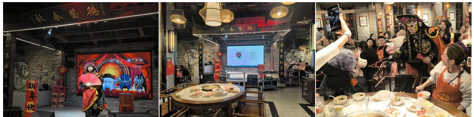
หลังรับประทานอาหารค่ำ นำท่านเดินทางสู่ที่พัก