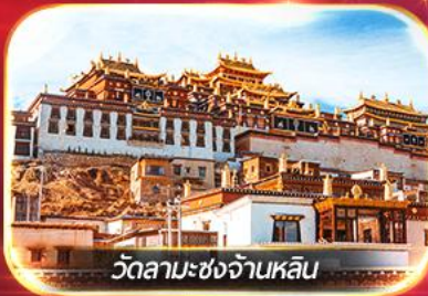
วัดลามะ-ชงจ้านหลิน