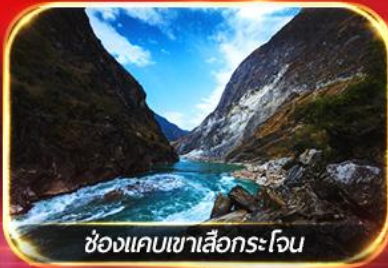
ช่องแคบเขาเลือกระโฉน