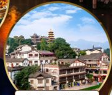
เมืองโบราณฉือจี้เซ้า