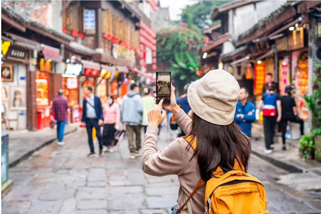
จากนั้น ออกเดินทางสู่ มหานครฉงชิ่ง (ใช้เวลาเดินทางประมาณ 2 ชั่วโมง)