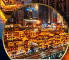
หงหย่าตั้ง