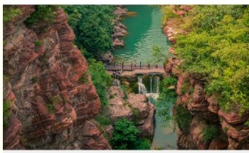
อุทยานสวรรค์หยุนโถซาน