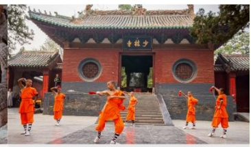
ชมโชว์กังฟูเส้าหลิน

*ทางบริษัทฯ ขอสงวนสิทธิ์ในการสลับโปรแกรมทัวร์ตามความเหมาะสมขึ้นอยู่กับสถานการณ์หน้างาน โดยคำนึงถึงผลประโยชน์ของลูกค้าเป็นสำคัญ