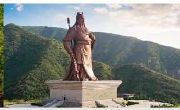
บ้านเกิดท่านกวนอู