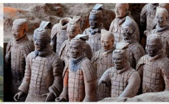
สุสานทหารจีนซี