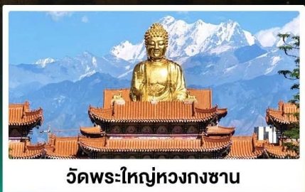
วัดพระใหญ่ทองกงซาน