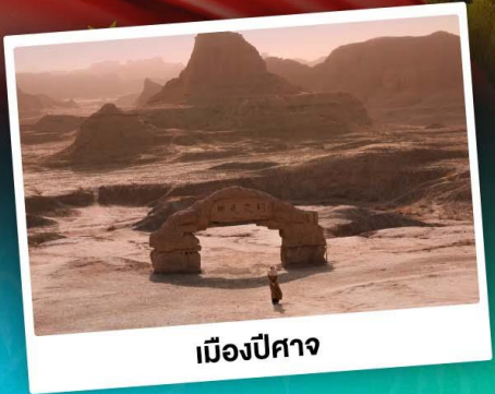
เมืองปีศาจ