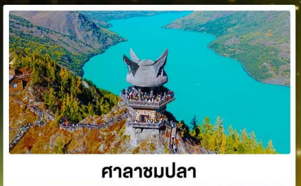
ศาลาชมปลา