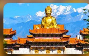
วัดพระใหญ่ทวงกงซาน