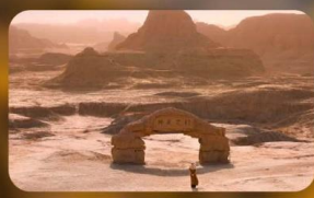
เมืองปีศาจ