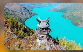
ศาลาชมปลา