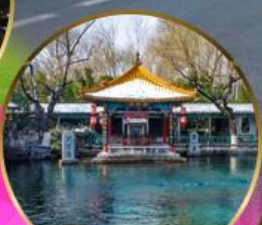
น้ำพุเปาหู