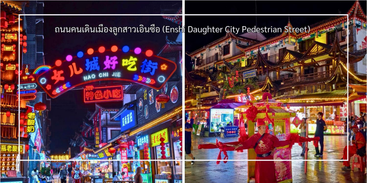
ถนนคนเดินเมืองลูกสาวเินซือ (Enshi Daughter City Pedestrian Street)

สมควรแก่เวลานำท่านสู่ ถนนคนเดินเินซือ (Enshi Daughter City Pedestrian Street) หรือเรียกอีกชื่อ ถนนคนเดินเมืองลูกสาวเินซือ เป็นศูนย์กลางกิจกรรมท้องถิ่นที่เต็มไปด้วยสีสันและวัฒนธรรมของเินซือ ถนนเส้นนี้เต็มไปด้วยร้านค้า ร้านอาหาร และแผงขายสินค้าพื้นเมือง ทั้งของฝาก งานหัตถกรรม และอาหารท้องถิ่น ทำให้นักท่องเที่ยวได้สัมผัสวิถีชีวิตของคนท้องถิ่นอย่างใกล้ชิด บรรยากาศในยามค่ำคืนมีชีวิตชีวา แสงไฟประดับถนนสวยงามตัดกับภูมิทัศน์เมืองเก่า และมีมุมถ่ายภาพสวยๆ ให้ผู้มาเยือนได้เก็บความประทับใจ