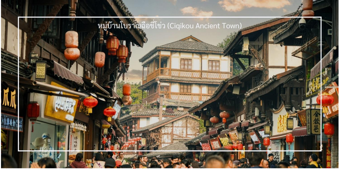
หมู่บ้านโบราณฉือโข่ว (Ciqikou Ancient Town)

โบราณ ซึ่งมีการอนุรักษ์สถาปัตยกรรมไว้อย่างดี ทำให้ผู้เข้าชมรู้สึกเหมือนได้ย้อนเวลาไปในอดีต และถนนในหมู่บ้านมีความคดเคี้ยวและเต็มไปด้วยร้านค้าขายสินค้าท้องถิ่น ร้านอาหาร และของที่ระลึก ซึ่งสามารถลิ้มลองอาหารท้องถิ่นและซื้อของที่ระลึกกลับบ้านได้