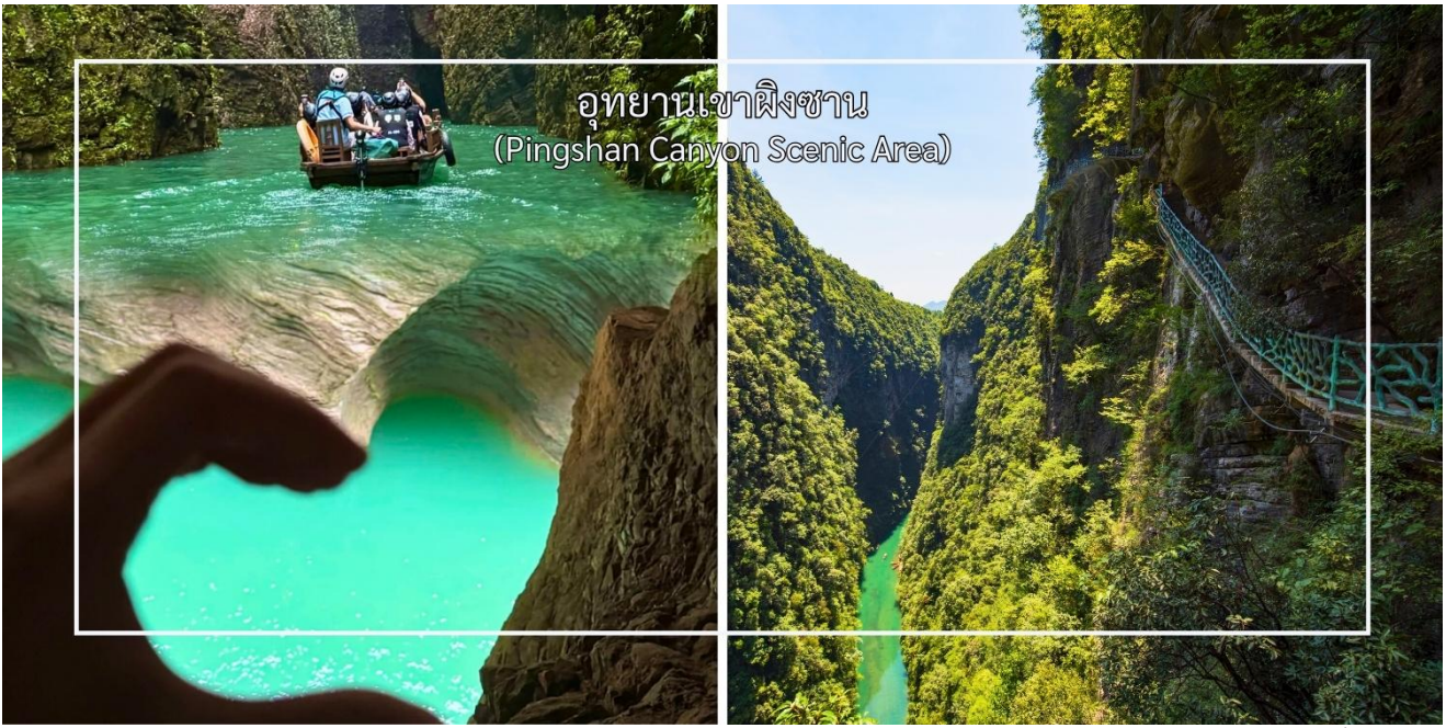
อุทยานเขาผิงซาน (Pingshan Canyon Scenic Area)

สมควรแก่เวลานำท่านสู่ ถนนคนเดินเินซือ (Enshi Daughter City Pedestrian Street) หรือเรียกอีกชื่อ ถนนคนเดินเมืองลูกสาวเินซือ เป็นศูนย์กลางกิจกรรมท้องถิ่นที่เต็มไปด้วยสีสันและวัฒนธรรมของเินซือ ถนนเส้นนี้เต็มไปด้วยร้านค้า ร้านอาหาร และแผงขายสินค้าพื้นเมือง ทั้งของฝาก งานหัตถกรรม และอาหารท้องถิ่น ทำให้นักท่องเที่ยวได้สัมผัสวิถีชีวิตของคนท้องถิ่นอย่างใกล้ชิด บรรยากาศในยามค่ำคืนมีชีวิตชีวา แสงไฟประดับถนนสวยงามตัดกับภูมิทัศน์เมืองเก่า และมีมุมถ่ายภาพสวยๆ ให้ผู้มาเยือนได้เก็บความประทับใจ