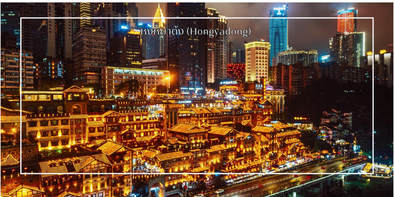
จากนั้นเดินทางเข้าสู่โรงแรมที่พัก Chongqing huashang Hotel ระดับ 4 ดาว หรือเทียบเท่า

เย็น บริการอาหารเย็น ณ ภัตตาคาร (มือที่2) เมนูพิเศษ : สุกี้หม่าล่า จากนั้นเดินทางไปยัง ตลาดหงหยาดัง (Hongyadong) หรือที่เรียกว่า "Hongya Cave" เป็นสถานที่ท่องเที่ยวที่มีชื่อเสียงในเมืองฉงชิ่ง โดยตั้งอยู่ริมแม่น้ำแยงซี มีบรรยากาศที่เต็มไปด้วยวัฒนธรรมและประวัติศาสตร์ ตลาดหงหยาดัง เป็นพื้นที่ที่มีอาคารแบบดั้งเดิมที่สร้างขึ้นในสไตล์สถาปัตยกรรมแบบชิโน-ทิเบต โดยมีร้านค้า ร้านอาหาร และบาร์จำนวนมาก ที่นี่ท่านสามารถลิ้มลองอาหารรสเด็ดและชมเมืองอื่น ๆ ที่ขึ้นชื่อ ตลาดหงหยาดังยังมีวิวทิวทัศน์ที่สวยงาม สามารถเดินเล่นตามทางเดินที่มีการจัดแสดงงานศิลปะและสินค้าท้องถิ่น