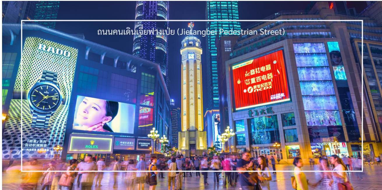
ถนนคนเดินเจียงเป่ย์ (Jiefangbei Pedestrian Street)

เมืองฉงชิ่ง ทำให้สามารถเดินเที่ยวชมได้อย่างสะดวก ถนนสายนี้มีบรรยากาศที่มีชีวิตชีวา โดยเฉพาะในช่วงเย็นที่มีแสงไฟและการแสดงต่างๆ ที่ทำให้บรรยากาศน่าสนใจยิ่งขึ้น และยังเต็มไปด้วยร้านค้าแบรนด์เนม ร้านค้าท้องถิ่น และตลาดที่ขายสินค้าต่างๆ เช่น เสื้อผ้า เครื่องประดับ และของที่ระลึก แวะชมร้าน POP MART ร้านดังจากจีน ที่รวมฟิกเกอร์ดีไซน์เก๋และตุ๊กตาน่ารักหลากหลายซีรีส์ยอดนิยม เช่น Molly, Dimoo, Labubu และอีกมากมาย ที่สายสะสมของเล่นไม่ควรพลาด