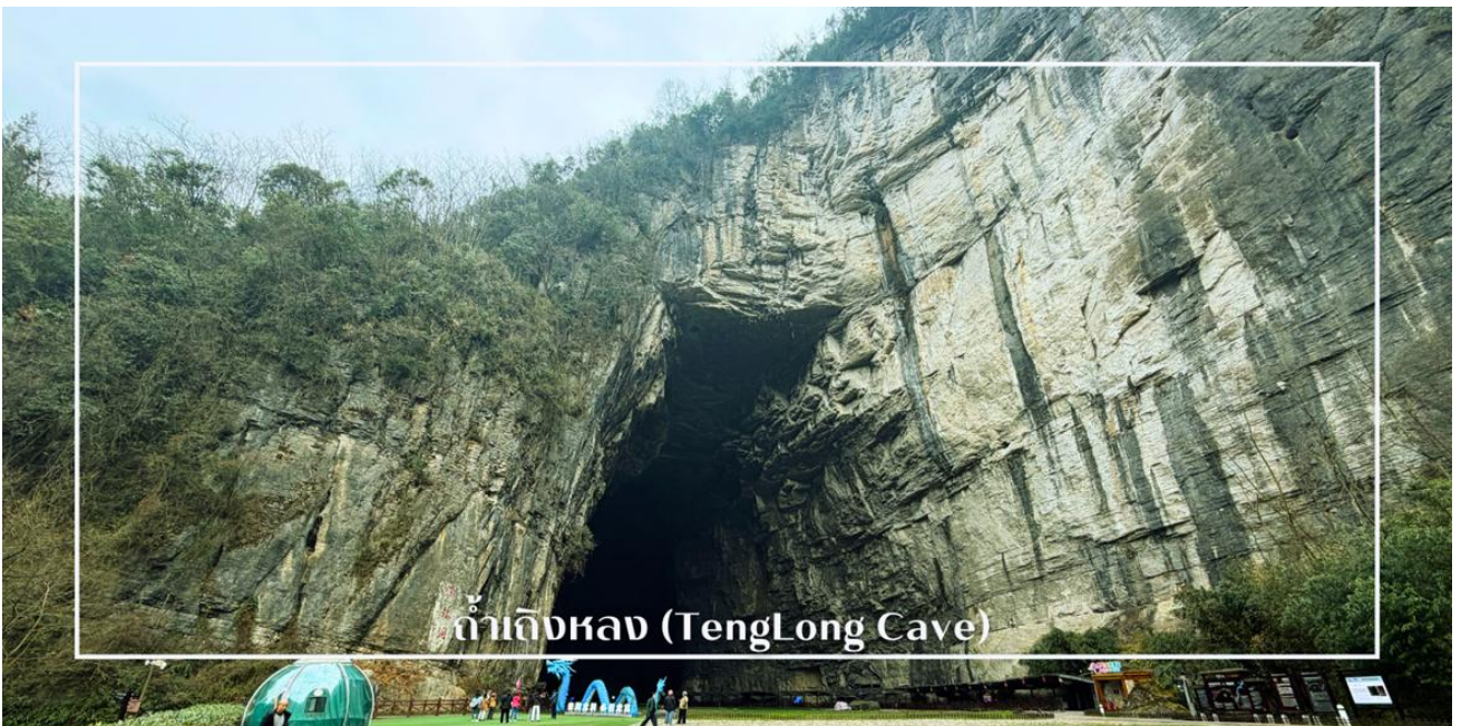
ถ้ำเถิงหลง (TengLong Cave)

นำท่านสู่ ถ้ำเถิงหลง(TengLong Cave) สถานที่ท่องเที่ยวระดับ 5A หนึ่งในถ้ำหินปูนที่ใหญ่และงดงามที่สุดของจีน ได้รับการขนานนามว่าเป็น ราชาน้ำค้างสวรรค์ ด้วยความอลังการของธรรมชาติที่ก่อกำเนิดมากกว่า 300 ล้านปี ตัวถ้ำมีความยาวมากกว่า 50 กิโลเมตร แบ่งออกเป็นถ้ำแห้งและถ้ำเปียก ภายในเต็มไปด้วยหินงอกหินย้อยรูปร่างแปลกตา โถงถ้ำสูงใหญ่โอ่อ่า มีลำธารใสไหลผ่านกลางถ้ำ ตลอดเส้นทางยังมีการจัดแสงสีตระการตา เพิ่มบรรยากาศเสมือนเดินทางอยู่ในดินแดนแฟนตาซี