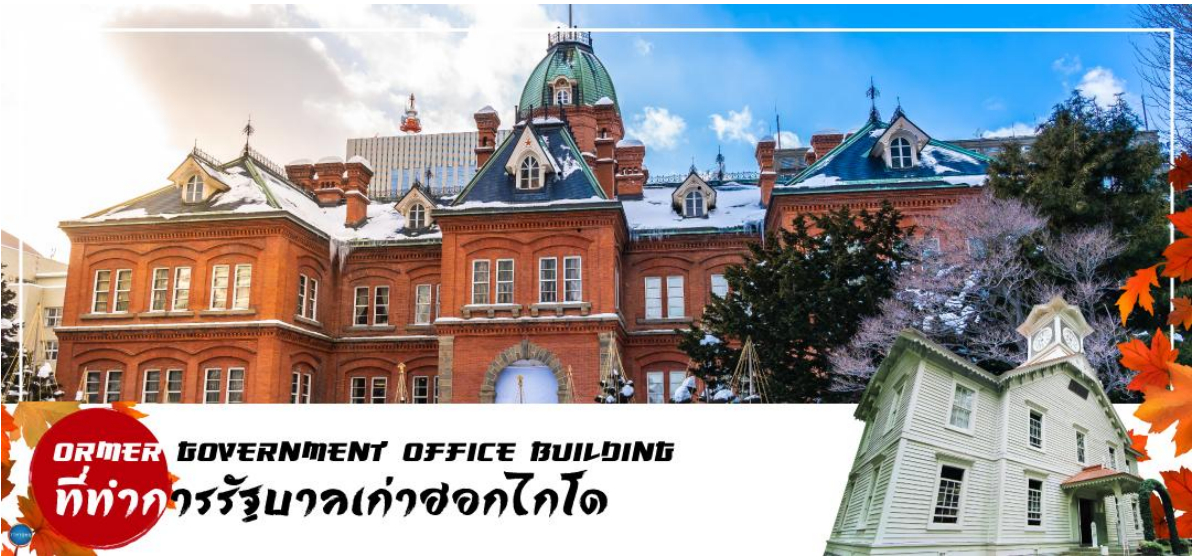
FORMER GOVERNMENT OFFICE BUILDING ที่ทำการรัฐบาลเก่าซอกไกโด

นำท่านเดินทางสู่ ย่านซุซุกิโนะ(Susukino) นับเป็นย่านที่เต็มไปด้วยแหล่งบันเทิงที่โด่งดังมากที่สุดของเมืองซัปโปโร(Sapporo) อีกทั้งยังเรียกได้ว่าเป็นย่านบันเทิงที่ใหญ่ที่สุดในทางตอนเหนือของญี่ปุ่นที่เดียวละคะ นอกเหนือจากอยากมาบันเทิงเริงใจยามค่ำคืนสัมผัสไลฟ์สไตล์แบบคนญี่ปุ่นแท้ๆ ต้องมาที่นี่ให้ได้เลยละคะ เพราะเต็มไปด้วยร้านค้า บาร์ ร้านอาหาร ร้านคาราโอเกะ และตู้ปลาจิงโกะ รวมกว่า 4,000 ร้าน บางร้านนี้เปิดจนถึงเที่ยงเที่ยงคืน