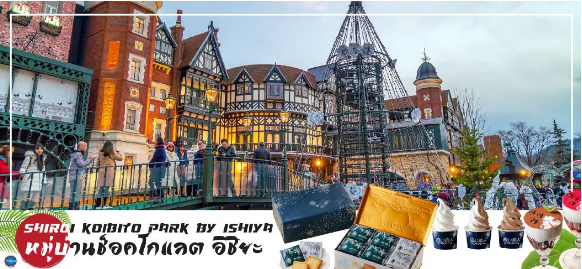
SHIROI KOIBITO PARK BY ISHIYA หมู่บ้านช็อคโกแลต อิชียะ

โกแลตที่ขึ้นชื่อที่สุดของที่นี่คือ Shiroi Koibito ซึ่งมีความหมายว่าช็อคโกแลตขาวแต่คนรัก ท่านสามารถเลือกซื้อกลับไปให้คนที่ท่านรักทานหรือว่าซื้อเป็นของฝากติดไม้ติดมือกลับบ้านก็ได้ นอกจากนี้ท่านจะได้เลือกซื้อช็อคโกแลตที่หาซื้อที่ไหนไม่ได้ และ ท่านก็ยังจะได้ชมประวัติความเป็นมาของโรงงาน และการผลิตช็อคโกแลตอีกด้วย