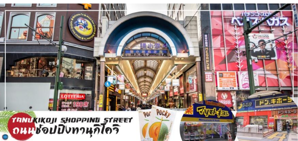
TANUKIKOJI SHOPPING STREET ถนนช้อปปิ้งทานุกิโคจิ

ที่พัก SMILE HOTEL PREMIUM - SAPPORO SUSUKINO หรือเทียบเท่าระดับเดียวกัน