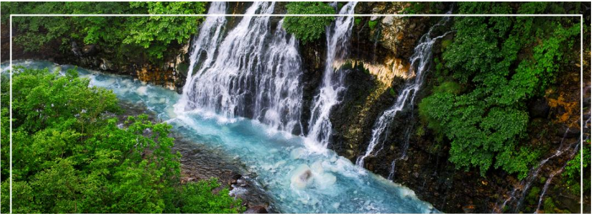
SHIRAHIGE WATERFALL น้ำตกชิราฮิเกะ

วันที่สอง ทำอากาศยานนิวซีโดเสะ สอกไกโด – เมืองบิเอะ – น้ำตกชิราฮิเกะ – สระอะโออิเคะ หรือ บ่อน้ำสีฟ้า – เมืองอาซาฮิดาว่า – อีออน อาซาฮิดาว่า