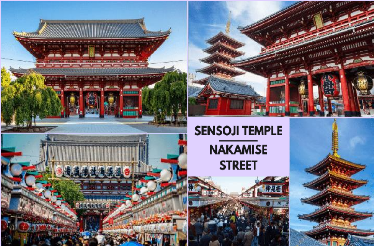
SENSOJI TEMPLE NAKAMISE STREET

คณะเดินทางถึง สนามบินนานาชาตินาริตะ ประเทศญี่ปุ่น (**เวลาที่ประเทศญี่ปุ่นจะเร็วกว่าประเทศไทย 2 ชม. ควรปรับนาฬิกาของท่านเพื่อสะดวกในการนัดหมาย) หลังผ่านพิธีตรวจคนเข้าเมืองแล้ว จากนั้นนำท่านสู่ เมืองโตเกียว (Tokyo) มหานครที่ใหญ่ที่สุดแห่งหนึ่งของเอเชีย และของโลก ประกอบด้วยแหล่งท่องเที่ยว แหล่งวัฒนธรรม ศูนย์รวมเศรษฐกิจ เทคโนโลยีทางด้านต่าง ๆ และสถานที่สำคัญทางศาสนา มากมายในมหานครแห่งนี้ที่ผสมผสานกันได้อย่างลงตัว นำท่านเดินทางสู่ วัดเซ็นโซจิ (Sensoji Temple) หรือที่รู้จักกันในนาม วัดอาซากุสะ เป็นวัดที่ขึ้นชื่อว่าเก่าแก่มากที่สุดของเมืองโตเกียวแห่งนี้ ถูกสร้างขึ้นเสร็จเมื่อประมาณปี ค.ศ. 645 เป็นหนึ่งในวัดที่เก่าแก่ และเป็นที่ยอมรับมากที่สุดวัดหนึ่งของเมืองโตเกียว บริเวณทางด้านหน้าวัดจะมี ถนนนากามิเสะ (Nakamise) เป็นถนนยาวเข้าสู่พื้นที่ภายในวัด เต็มไปด้วยร้านค้า ร้านอาหาร ร้านจำหน่ายของที่ระลึกต่าง ๆ มากมาย โดยนักท่องเที่ยวนิยมถ่ายภาพที่ระลึกกับโดมแดงอันใหญ่ ๆ ที่เปรียบเสมือนสัญลักษณ์สำคัญมาก ๆ ของวัดแห่งนี้ ให้ท่านได้ช้อปปิ้งเลือกซื้อสินค้าของขวัญของฝากจากญี่ปุ่น หรือเลือกซื้อเลือกชิมขนมท้องถิ่นอร่อย ๆ มากมายตามได้บรรยากาศ