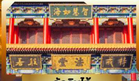
วัดจันทน์