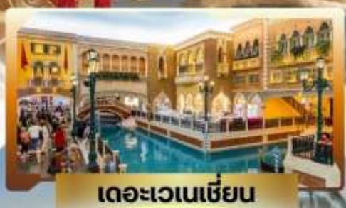
เดอะเวเนเชียน

4 วัน | 3 คืน | น้ำหนักกระเป๋า 23KG | พักโรงแรม 3 ดาว | นอนมาเก๊า 3 คืน