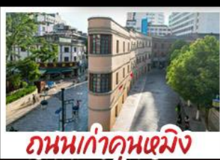
ถนนท่าคุณหมิง