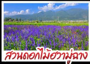
สวนดอกไม้ฮาวอวี่มู่ฉ่าง