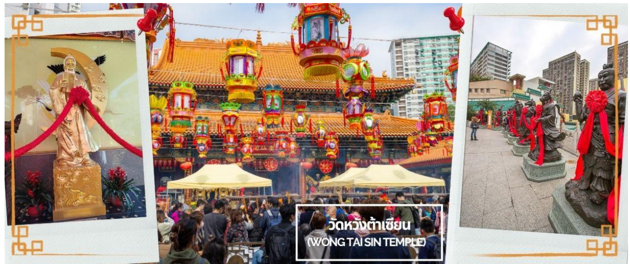
CCXH16 ฮองกง พระใหญ่นองปิง ไหว้พระ 6 วัดตั้ง 3วัน 2คืน บิน CX Cathay Pacific (May-Oct 26)