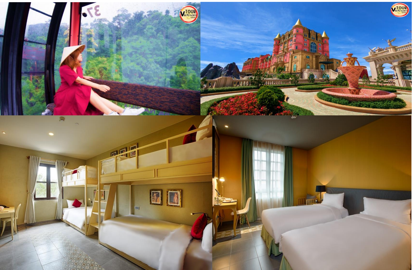
☞ นำท่านเข้าสู่ที่พัก Mercure Ba Na Hill ระดับ 4 ดาว หรือเทียบเท่า (บานาฮิลล์)