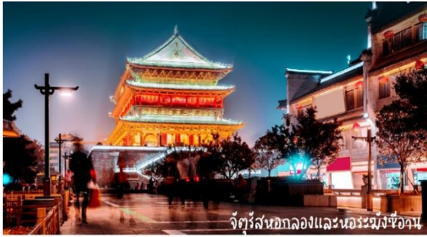
จัตุรัสหอกลองและหอรบเมืองซีอาน