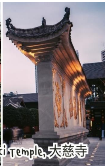
Daci Temple, 大慈寺