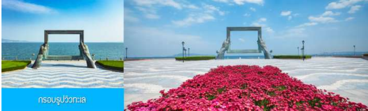
กรอบรูปวิวทะเล

นำท่านชมสวนสาธารณะเว่ยไห่ 威海公园 สวนสาธารณะริมทะเลที่ใหญ่ที่สุดของเมืองเว่ยไห่ ให้ท่านชมและถ่ายภาพคู่กับ กรอบรูปยักษ์วิวทะเล 威海公园大相框 แลนด์มาร์คที่เป็นอีกหนึ่งไฮไลท์ที่สุดฮิตของเว่ยไห่