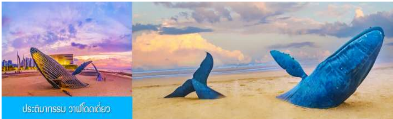
ประติมากรรม วาฬโดดเดี่ยว

จากนั้นนำท่านเดินทางสู่เมืองเยียนไถ 烟台 (ระยะทาง 72 กม. ใช้เวลาเดินทางราว 1 ชั่วโมง)