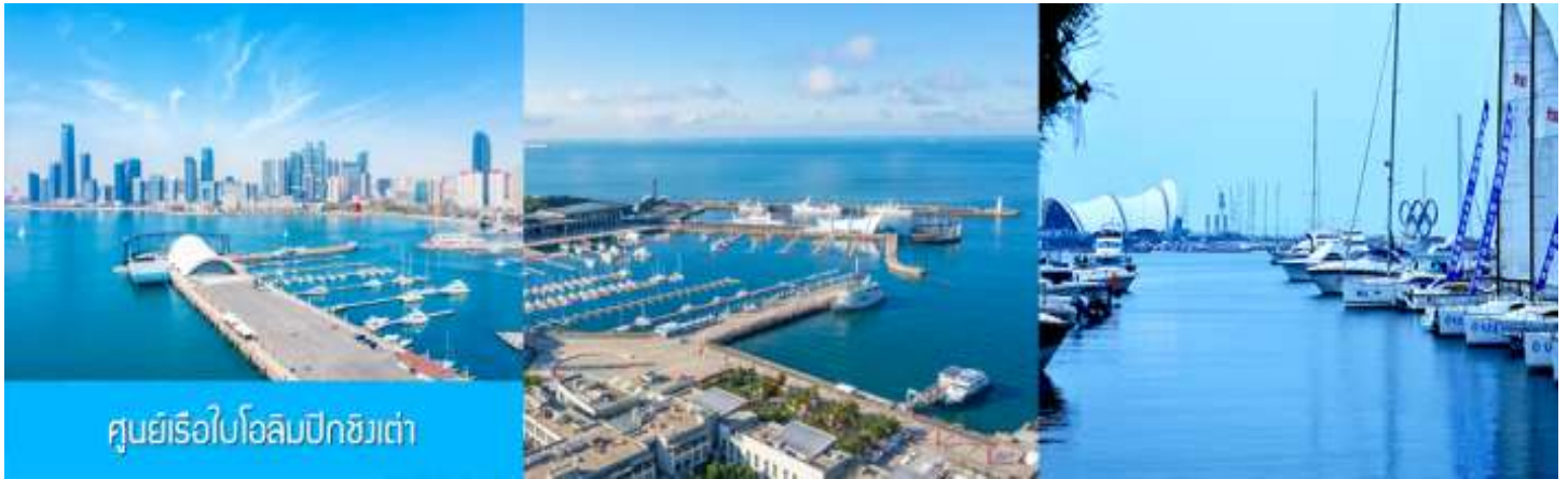
ศูนย์เรือใบโอลิมปิกชิงเต่า

จากนั้นนำท่านเที่ยวชม โรงเบียร์ชิงเต่า 青岛啤酒博物馆 พิพิธภัณฑ์เบียร์ที่ขึ้นชื่อของเมืองชิงเต่า ซึ่งเป็นเบียร์ยี่ห้อแรกที่ผลิตขึ้นในประเทศจีน ชมเบียร์ คอลเลกชันที่มียี่ห้อหลากหลายที่สุดของโลก และชมการจัดแสดงภาพและวิดีโอที่เกี่ยวกับวิวัฒนาการของเบียร์ ขั้นตอนการผลิตและอื่น ๆ ที่เกี่ยวข้อง พร้อมชิมเบียร์ชิงเต่า ซึ่งเป็นเบียร์ที่ขายดีที่สุดยี่ห้อหนึ่งของจีน.. (ชิมเบียร์ชิงเต่าท่านละ 1 แก้ว รับกลับอีก 1 ขวดเล็ก ตอนเดินออก)