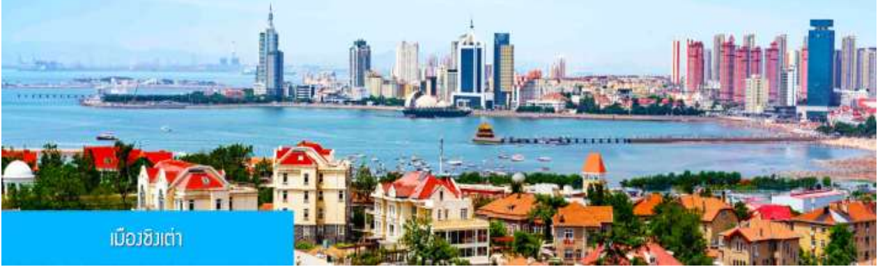
เมืองชิงเต่า