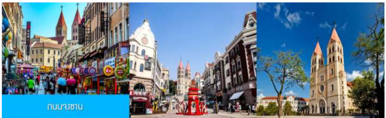
ถนนวาชาน

หลังอาหารนำท่านเดินทางชม สะพานจ้านเจียว 栈桥 เป็นแลนด์มาร์กแห่งประวัติศาสตร์คู่เมืองชิงเต่า สร้างเมื่อปี ค.ศ.1891 มีลักษณะเป็นสะพานหินทอดยาวกว่า 440 เมตรสู่ทะเล ปลายสะพานมีศาลา ทรงแปดเหลี่ยมสีแดงที่โดดเด่น ซึ่งเป็นสัญลักษณ์บนฉลากเบียร์ชิงเต่า ขึ้นชื่อเรื่องวิวสวย รับลมทะเล ให้ท่านเก็บภาพบรรยากาศ