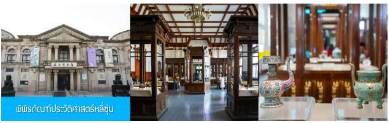
พิพิธภัณฑ์ประวัติศาสตร์หลี่ซุ่น

นำท่านเที่ยวชมและเก็บภาพ ณ สถานีรถไฟหลี่ซุ่น 旅顺火车站 เป็นสถานีปลายทางของเส้นทางรถไฟสาขา เส้นหยาง - ต้าเหลียน สร้างขึ้นในปีค.ศ. 1903 ออกแบบโดยสถาปนิกชาวรัสเซีย เป็นอาคารอิฐก่อปูนผสม โครงสร้างไม้ตามสถาปัตยกรรมรัสเซีย.