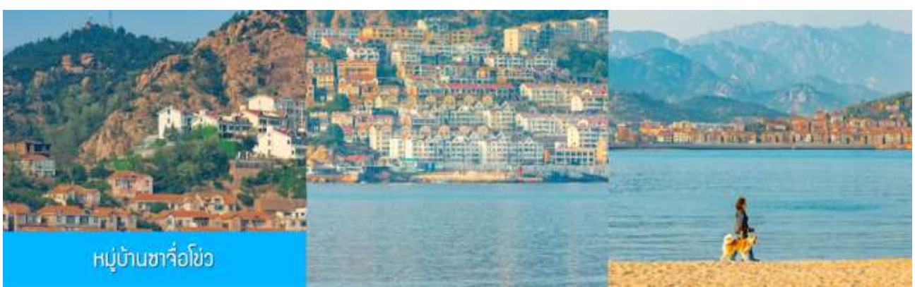
หมู่บ้านซาจื่อโจว

เช้า รับประทานอาหารเช้า ณ ห้องอาหารของโรงแรม (4)