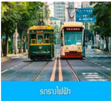
รถรางไฟฟ้า