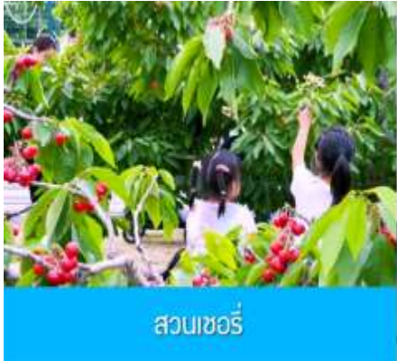
สวนเชอร์รี่