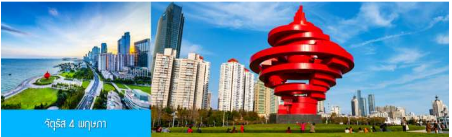
จัตุรัส 4 พฤษภาคม

จากนั้นนำท่านเที่ยวชม ศูนย์เรือใบโอลิมปิกชิงเต่า (Qingdao Olympic Sailing Center) ซึ่งเป็นสถานที่จัดการแข่งขันเรือใบในโอลิมปิกฤดูร้อน 2008 ปัจจุบันเป็นสถานที่ท่องเที่ยวชั้นนำริมทะเลที่สวยงาม มีท่าจอดเรือยอชต์, พื้นที่จัดกิจกรรม, และทิวทัศน์ที่สวยงาม ให้ท่านเก็บภาพบรรยากาศความสวยงามตามอัธยาศัย