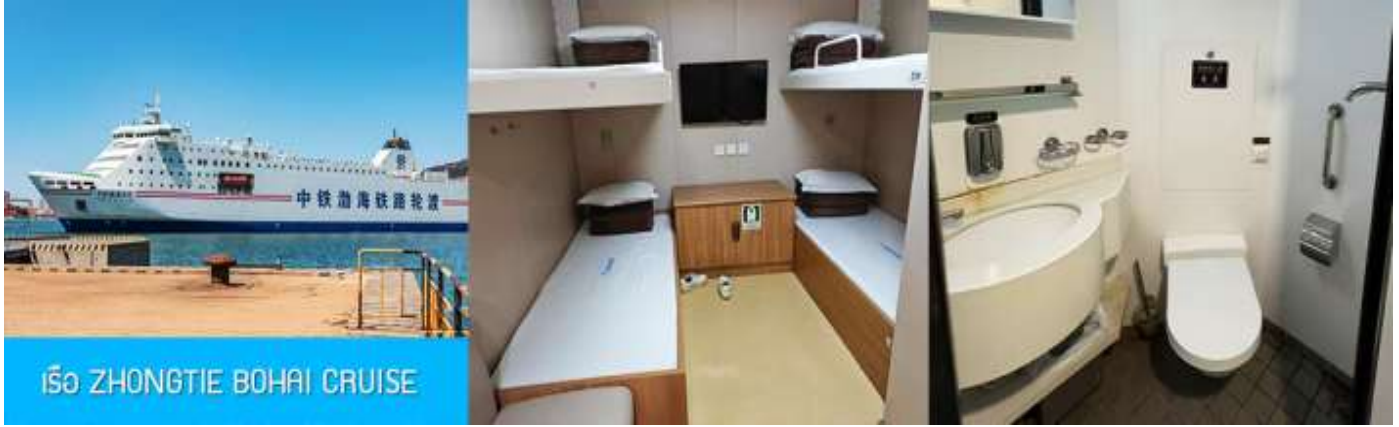
เรือ ZHONGTIE BOHAI CRUISE