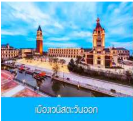
เมืองวีนิสตะวันออก

หลังอาหารนำท่านสู่ สวนเชอร์รี่ 樱桃园现摘樱桃 ให้ท่านสัมผัสประสบการณ์สุดชิล ด้วยการเด็ดเชอร์รี่สดจากต้นภายในสวนเชอร์รี่ (เชอร์รี่จะของเมืองนี้จะเริ่มสุกและเก็บได้ในช่วงปลายเดือนพฤษภาคม - มิถุนายนของทุกปี ในกรณีที่ผลเชอร์รี่น้อยหรือหมดเร็วกว่าปกติ ทางทัวร์ขอสงวนสิทธิ์ในการจัดโปรแกรมอื่นแทนการเด็ดเชอร์รี่) เที่ยง รับประทานอาหารกลางวัน ณ ภัตตาคาร (11)