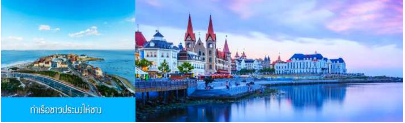
ท่าเรือชาวประมงไห่ซาง