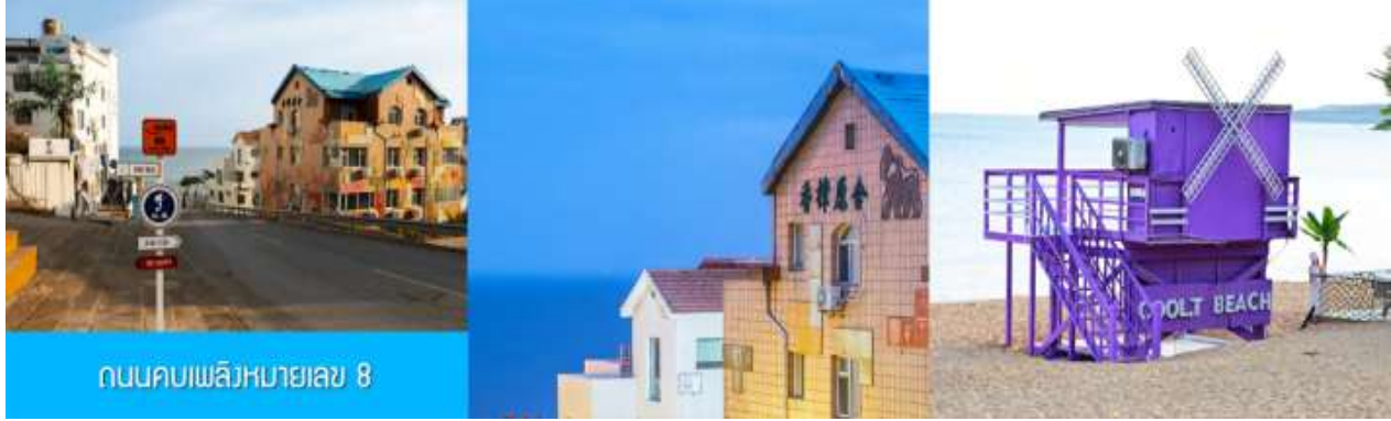
ถนนคอบเพลิงหมายเลข 8

นำท่านชมสวนสาธารณะเว่ยไห่ 威海公园 สวนสาธารณะริมทะเลที่ใหญ่ที่สุดของเมืองเว่ยไห่ ให้ท่านชมและถ่ายภาพคู่กับ กรอบรูปยักษ์วิวทะเล 威海公园大相框 แลนด์มาร์คที่เป็นอีกหนึ่งไฮไลท์ที่สุดฮิตของเว่ยไห่