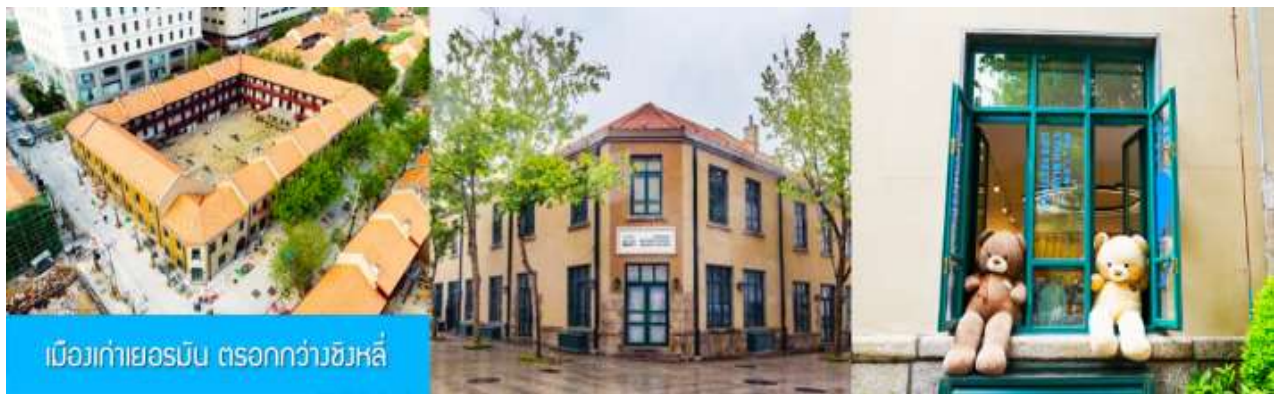
เมืองเก่าเยอรมัน ตรอกกว้างซิงหลี

จากนั้นนำท่านเดินเที่ยวชม ถนนจงซาน 中山路 ถนนที่เต็มไปด้วยกลิ่นอายยุโรป และถนนสายนี้มีบันทึกเรื่องราวมากกว่าศตวรรษของเมืองชิงเต่าไว้ ที่นี่เป็นศูนย์กลางการค้าแห่งแรกที่เต็มไปด้วยสถาปัตยกรรมสไตล์ยุโรปเก่าแก่ที่ได้รับอิทธิพลมาจากเยอรมัน ให้ท่านได้เดินเก็บบรรยากาศ และ เก็บภาพกับ โบสถ์เซนต์ไมเกล (ด้านนอก) โบสถ์แห่งนี้ที่คู่รักนิยมมาถ่ายภาพงานแต่งงานกันมากที่สุดในเมืองชิงเต่า ให้ท่านถ่ายรูปเก็บภาพ