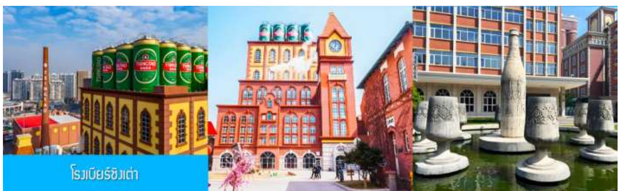
ไรเบียร์ชิงเต่า

เที่ยง รับประทานอาหารกลางวัน ณ ภัตตาคาร *เมนูซีฟู้ด (2)