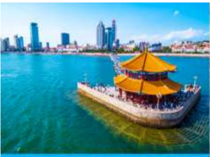
สะพานเจียงเฉียว

เช้า รับประทานอาหารเช้า ณ ห้องอาหารของโรงแรม (1)