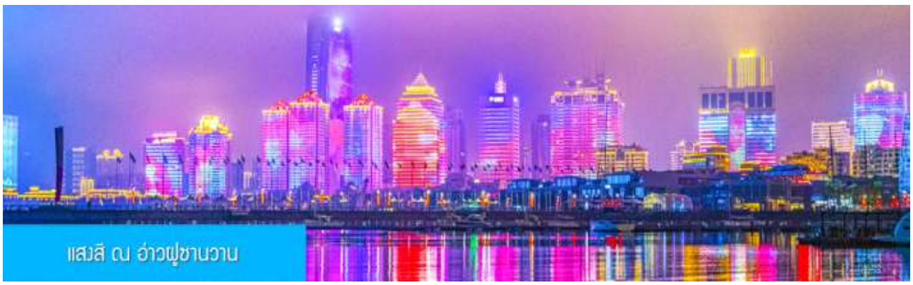
แสงสี ณ อ่าวฟู่ซานวาน

หลังอาหารนำท่านชมความอลังการของแสงสี ณ อ่าวฟู่ซานวาน 浮山湾灯光秀 ชมความอลังการของแสงสียามหัวค่ำ และไฟที่เต้นระบำได้บนตึกสูง และเป็นหนึ่งในไนท์วิวที่สวยงามที่สุดแห่งหนึ่งของจีน..... พักที่ JIFENG INTER HOTEL โรงแรมระดับ 4 ดาวท้องถิ่น ในเมืองเมืองชิงเต่า