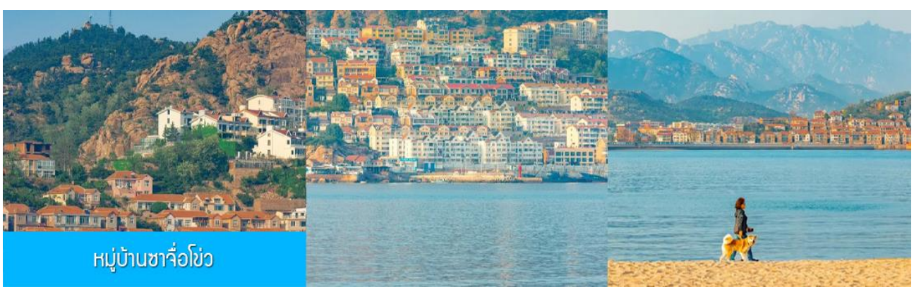
หมู่บ้านซาจื่อโจว

เช้า รับประทานอาหารเช้า ณ ห้องอาหารของโรงแรม (4)