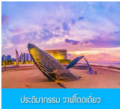
ประติมากรรม วาฬโดดเดี่ยว

จากนั้นนำท่านเดินทางสู่เมืองเยียนไถ 烟台 (ระยะทาง 72 กม. ใช้เวลาเดินทางราว 1 ชั่วโมง)