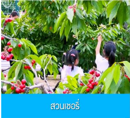
สวนเชอร์รี่