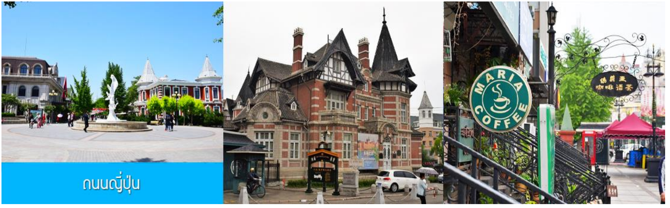
ถนนญี่ปุ่น