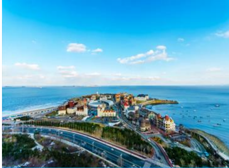
ท่าเรือชาวประมงไห่ซาง