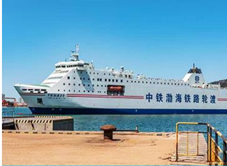
เรือ ZHONGTIE BOHAI CRUISE