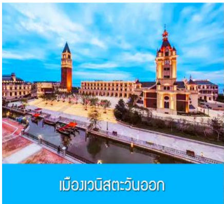
เมืองวีนิสตะวันออก