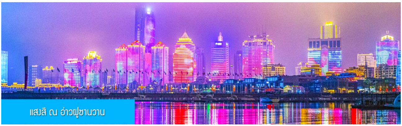
แสงสี ณ อ่าวฝูซานวาน

หลังอาหารนำท่านชมความอลังการของแสงสี ณ อ่าวฝูซานวาน 浮山湾灯光秀 ชมความอลังการของแสงสียามหัวค่ำ และไฟที่เต้นระบำได้บนตึกสูง และเป็นหนึ่งในไนท์วิวที่สวยงามที่สุดแห่งหนึ่งของจีน..... พักที่ JIFENG INTER HOTEL โรงแรมระดับ 4 ดาวท้องถิ่น ในเมืองเมืองชิงเต่า