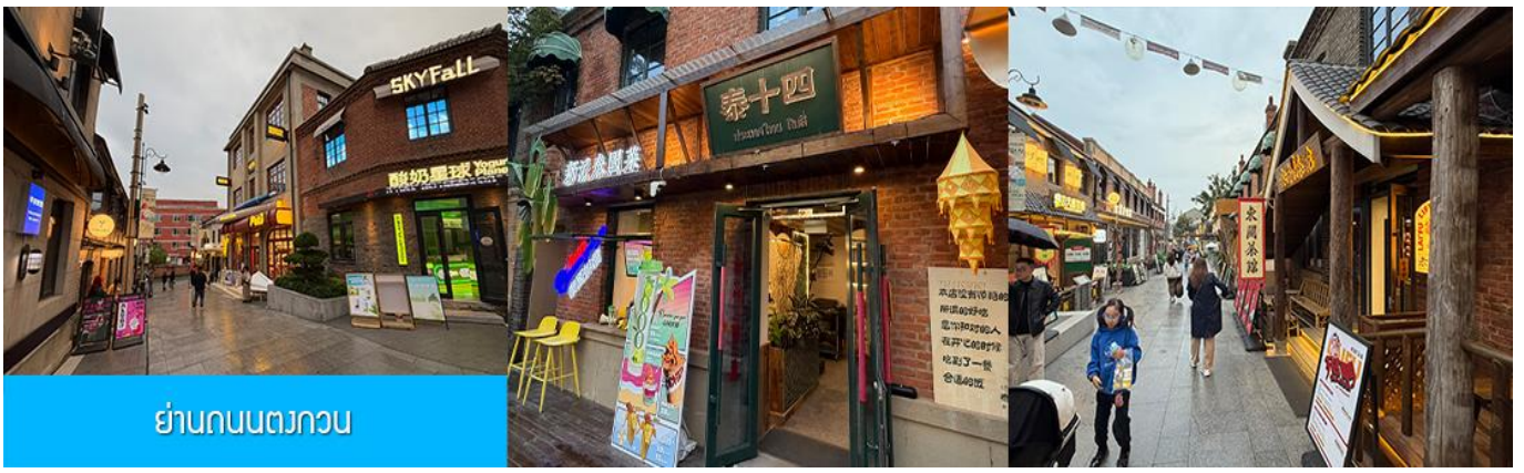
ย่านถนนตงกวน

นำท่านเที่ยวชม จัตุรัสชิงไห่ 星海广场 เป็นจัตุรัสขนาดใหญ่เป็นแลนด์มาร์คสำคัญของเมืองต้าเหลียน สร้างขึ้นเพื่อเฉลิมฉลองในโอกาสที่รัฐบาลอังกฤษคืนเกาะฮ่องกงในให้จีนในปี ค.ศ. 1997 ตั้งอยู่ชายฝั่งทะเลในเมืองต้าเหลียน เป็นจัตุรัสใจกลางเมืองที่ใหญ่ที่สุดในโลกและเป็นแลนด์มาร์คของเมืองต้าเหลียน รายล้อมด้วยตึกกระจกฟ้าที่ทันสมัย ภายในมีบ่อน้ำพุดนตรี ลานหญ้าขนาดใหญ่ และลานกว้างสำหรับจัดกิจกรรมกลางแจ้ง อาทิ เทศกาลเบียร์นานาชาติ การแข่งขันวิ่งมาราธอน งานแฟชั่นนานาชาติเมืองต้าเหลียน ฯลฯ