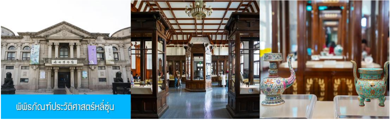
พิพิธภัณฑ์ประวัติศาสตร์หลี่ซุ่น

นำท่านเที่ยวชมและเก็บภาพ ณ สถานีรถไฟหลี่ซุ่น 旅顺火车站 เป็นสถานีปลายทางของเส้นทางรถไฟสาขา เส้นหยาง - ต้าเหลียน สร้างขึ้นในปีค.ศ. 1903 ออกแบบโดยสถาปนิกชาวรัสเซีย เป็นอาคารอิฐก่อปูนผสม โครงสร้างไม้ตามสถาปัตยกรรมรัสเซีย.