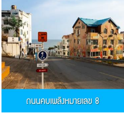
ถนนคบเพลิงหมายเลข 8

นำท่านชมสวนสาธารณะเว่ยไห่ 威海公园 สวนสาธารณะริมทะเลที่ใหญ่ที่สุดของเมืองเว่ยไห่ ให้ท่านชมและถ่ายภาพคู่กับ กรอบรูปยักษ์วิวทะเล 威海公园大相框 แลนด์มาร์คที่เป็นอีกหนึ่งไฮไลท์ที่สุดฮิตของเว่ยไห่