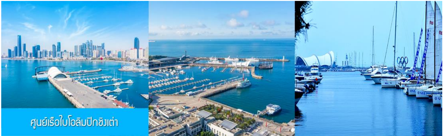
ศูนย์เรือใบโอลิมปิกชิงเต่า

จากนั้นนำท่านเที่ยวชม โรงเบียร์ชิงเต่า 青岛啤酒博物馆 พิพิธภัณฑ์เบียร์ที่ขึ้นชื่อของเมืองชิงเต่า ซึ่งเป็นเบียร์ยี่ห้อแรกที่ผลิตขึ้นในประเทศจีน ชมเบียร์ คอลเลกชันที่มียี่ห้อหลากหลายที่สุดของโลก และชมการจัดแสดงภาพและวิดีโอเกี่ยวกับวิวัฒนาการของเบียร์ ขั้นตอนการผลิตและอื่น ๆ ที่เกี่ยวข้อง พร้อมชิมเบียร์ชิงเต่า ซึ่งเป็นเบียร์ที่ขายดีที่สุดยี่ห้อหนึ่งของจีน.. (ชิมเบียร์ชิงเต่าท่านละ 1 แก้ว รับกลับอีก 1 ขวดเล็ก ตอนเดินออก)