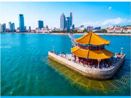
สะพานเทียนเฉียว

เช้า รับประทานอาหารเช้า ณ ห้องอาหารของโรงแรม (1)