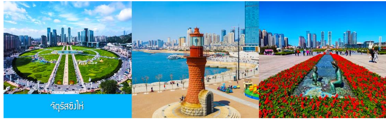
จัตุรัสชิงไห่

จากนั้นนำท่านเที่ยวชมและเก็บภาพ ณ พิพิธภัณฑ์ประวัติศาสตร์หลี่ซุ่น 旅顺博物馆 เป็นอาคารพิพิธภัณฑ์ เก่าแก่อายุกว่าร้อยปีแห่งแรกที่สร้างขึ้นทางภาคตะวันออกเฉียงเหนือของจีน อาคารพิพิธภัณฑ์มีความโดดเด่น ด้วยสถาปัตยกรรมแบบกรีก โรมันยุคเรเนซองส์ ผสมผสานสถาปัตยกรรมแบบตะวันตกออก ภายในมีการจัดแสดง โบราณวัตถุกว่า 60,000 ชิ้น ท่านสามารถเก็บภาพที่ระลึกด้านหน้าอาคารพิพิธภัณฑ์ และสามารถเข้าชม โบราณวัตถุภายในพิพิธภัณฑ์ได้ตามอรรถาธิบาย (พิพิธภัณฑ์ปิดทุกวันจันทร์)..