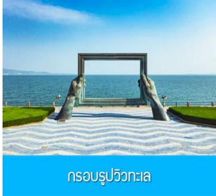
กรอบรูปวิวทะเล