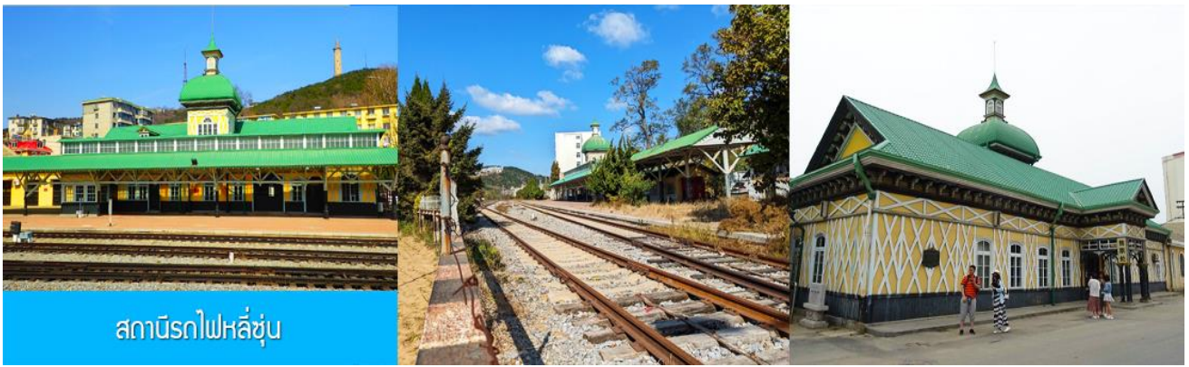
สถานีรถไฟหลี่ซุ่น

นำท่านเที่ยวชมและเก็บภาพ ณ สถานีรถไฟหลี่ซุ่น 旅顺火车站 เป็นสถานีปลายทางของเส้นทางรถไฟสาขา เส้นหยาง - ต้าเหลียน สร้างขึ้นในปีค.ศ. 1903 ออกแบบโดยสถาปนิกชาวรัสเซีย เป็นอาคารอิฐก่อปูนผสม โครงสร้างไม้ตามสถาปัตยกรรมรัสเซีย.