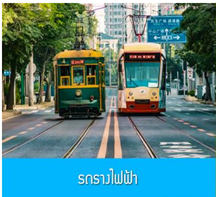
รถรางไฟฟ้า