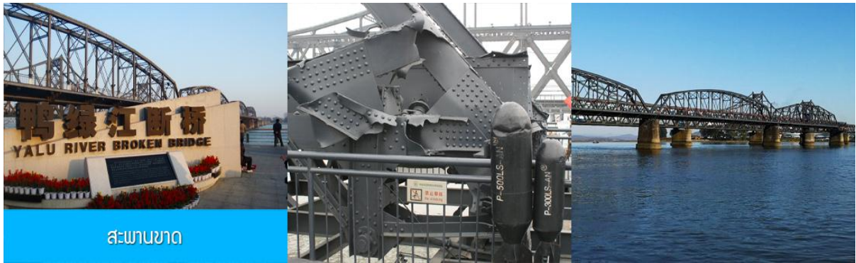
สะพานขาด