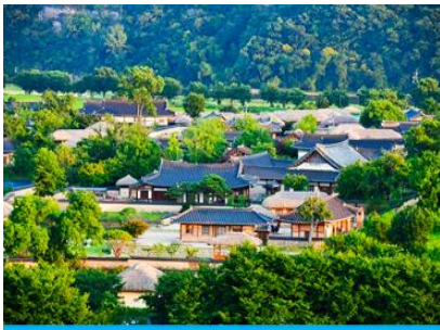
ศูนย์วัฒนธรรมเกาหลี

เช้า รับประทานอาหารเช้า ณ ห้องอาหารของโรงแรม (6)