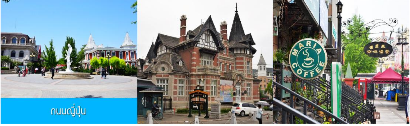
ถนนญี่ปุ่น