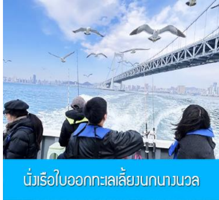
นั่งเรือใบออกทะเลลิ้นกนางนวล

ต่อด้วยนำท่านเที่ยวชมถนนรัสเซีย 俄罗斯风情街 ในอดีตที่นี่เป็นศูนย์ที่ตั้งของที่ทำการเมืองต้าเหลียน ภายหลังได้กลายเป็นชุมชนของพ่อค้าและวิศวกรทางรถไฟชาวรัสเซีย บริเวณนี้จึงเต็มไปด้วยอาคารบ้านเรือนแบบตะวันตก(รัสเซีย) มากมาย นอกจากนี้ได้เก็บภาพที่มีพื้นหลังเป็นอาคารสถาปัตยกรรมตะวันตก ที่นี้ยังมีร้านค้าที่จำหน่ายสินค้าและของที่ระลึกที่นำเข้ามาจากรัสเซีย อาทิ ช็อกโกแลต เหล้าวอดก้า ตุ๊กตารัสเซีย ฯลฯ