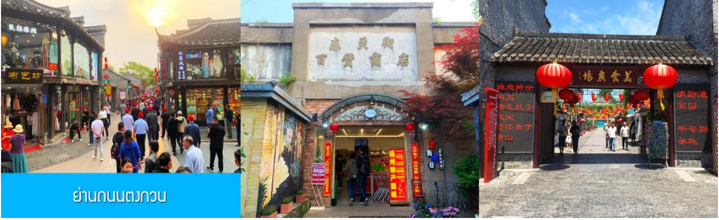
ย่านถนนตงกวน

ชม จัตุรัสชิงไห่ 星海广场 เป็นจัตุรัสขนาดใหญ่เป็นแลนด์มาร์คสำคัญของเมืองต้าเหลียน สร้างขึ้นเพื่อเฉลิมฉลองในโอกาสที่รัฐบาลอังกฤษคืนเกาะฮ่องกงโนให้จีนในปี ค.ศ. 1997 ตั้งอยู่ชายฝั่งทะเลในเมืองต้าเหลียน เป็นจัตุรัสใจกลางเมืองที่ใหญ่ที่สุดในโลกและ เป็นแลนด์มาร์คของเมืองต้าเหลียน รายล้อมด้วยตึกระฟ้าที่ทันสมัย ภายในมีบ่อน้ำพุดนตรี ลานหญ้าขนาดใหญ่ และลานกว้างสำหรับจัดกิจกรรมกลางแจ้ง อาทิ เทศกาลเปียร์นานาชาติ การแข่งขันวิ่งมาราธอน งานแฟชั่นนานาชาติเมืองต้าเหลียน ฯลฯ