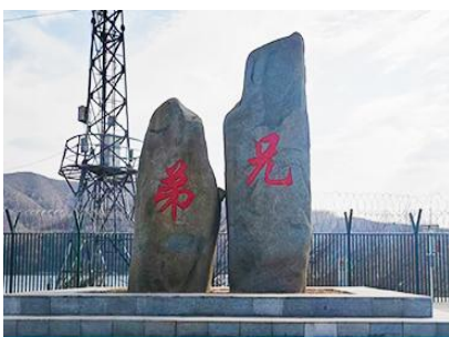
ป้ายพรมแดนจีนเกาหลีและแท่งศิลาสองพี่น้อง