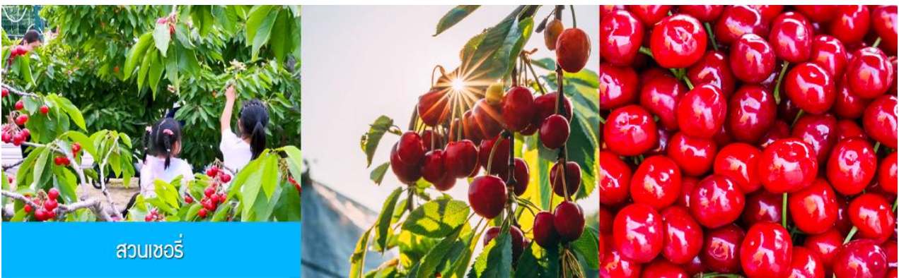
สวนเชอร์รี่

นำท่านสู่ สวนเชอร์รี่ 樱桃园现摘樱桃 ให้ท่านสัมผัสประสบการณ์สุดชิว ด้วยการเด็ดเชอร์รี่สดจากต้นภายในสวนเชอร์รี่ (เชอร์รี่ของเมืองนี้จะเริ่มสุกและเก็บได้ในช่วงปลายเดือนพฤษภาคม - มิถุนายนของทุกปี ในกรณีที่ผลเชอร์รี่น้อยหรือหมดเร็วกว่าปกติ ทางทัวร์ขอสงวนสิทธิ์ในการจัด โปรแกรมอื่นแทนการเด็ดเชอร์รี่)