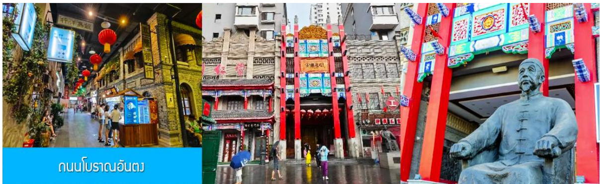
ถนนโบราณอันตง