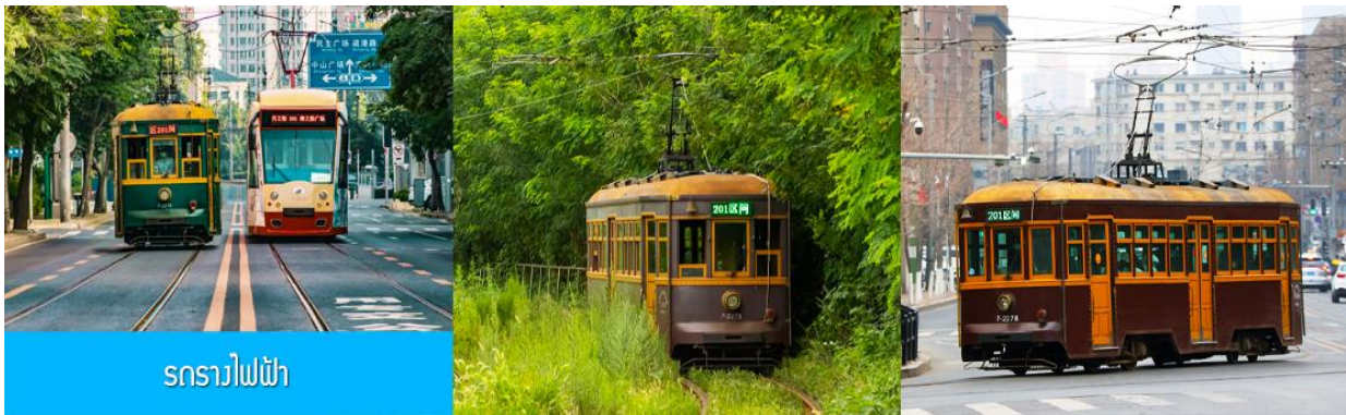
รถรางไฟฟ้า