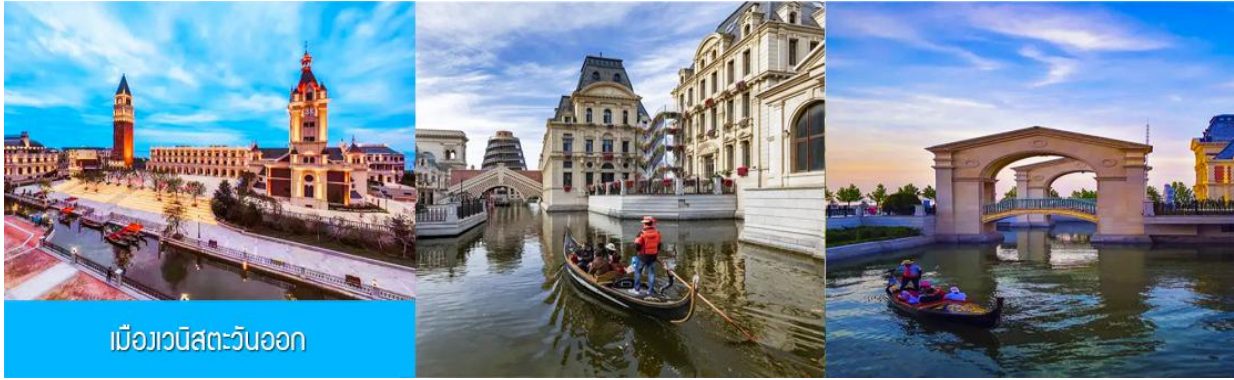
เมืองเวนิสตะวันออก