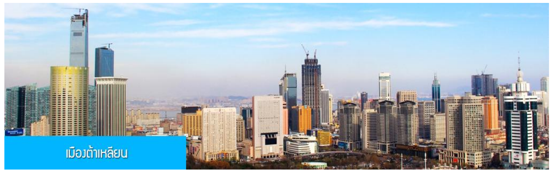
เมืองต้าเหลียน