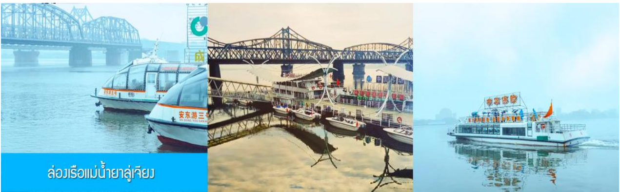
ล่องเรือแม่น้ำยาลู่เจียง

หลังอาหารให้ท่านพักผ่อนตามอัธยาศัยในโรงแรม