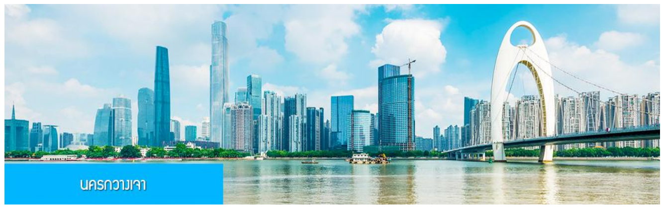
นครกวางเจา

21.00 น. คณะเดินทางพร้อมกันที่ ท่าอากาศยานสุวรรณภูมิ อาคารผู้โดยสารขาออกระหว่างประเทศ ชั้น 4 ประตู 10 เคา์นเตอร์เช็คอิน สายการบิน 9AIR (AQ) โดยมีเจ้าหน้าที่บริษัทฯ คอยให้การต้อนรับและอำนวยความสะดวกในการเช็คอิน