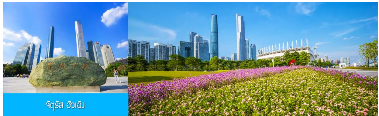
จัตุรัส ฮัวเจิง

เที่ยง รับประทานอาหารกลางวัน ณ ภัตตาคาร (มื้อที่ 11)