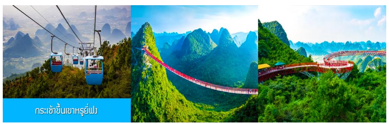
กระเช้าขึ้นเขาหญู่ยี่ฟง