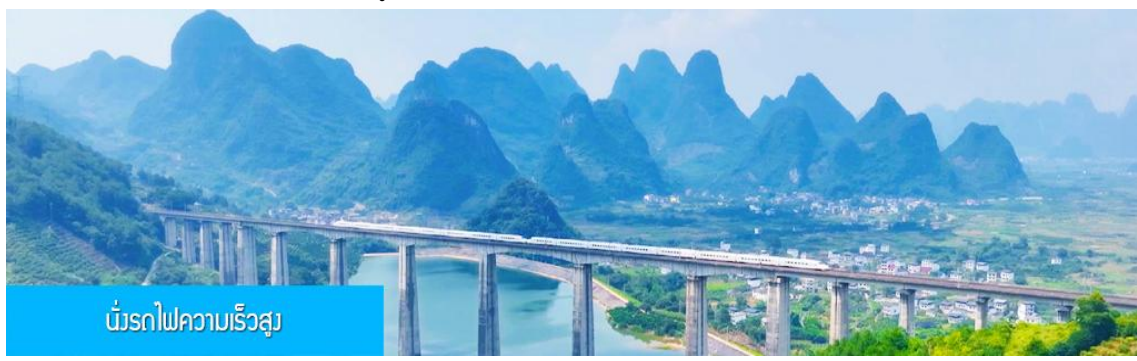
นักรรถไฟความเร็วสูง

เช้า รับประทานอาหารเช้า ณ ห้องอาหารของโรงแรม (มื้อที่ 10) หลังอาหารนำท่านเดินทางสู่สถานีรถไฟเมืองหยางชัว เตรียมตัวขึ้นรถไฟ