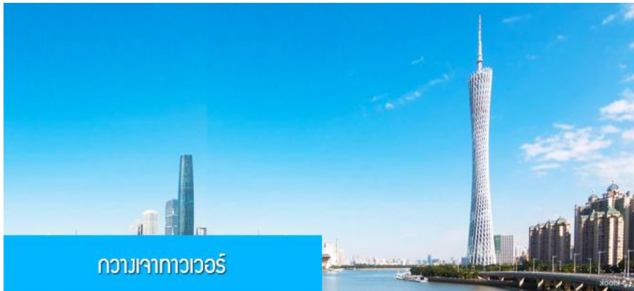
กวางเจาทาวเวอร์