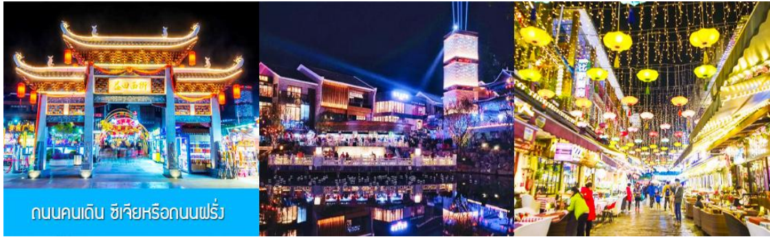
ถนนคนเดิน ซิเจียหรือถนนฝรั่ง