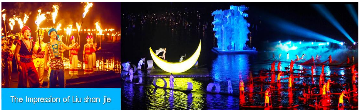
The Impression of Liu shan jie

อิสระอาหารค่ำเพื่อความสะดวกในการเดินเที่ยว และชมอาหารพื้นเมืองตามอัชฌาศัย