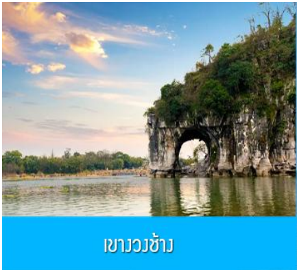
เขาวงจ้ำ