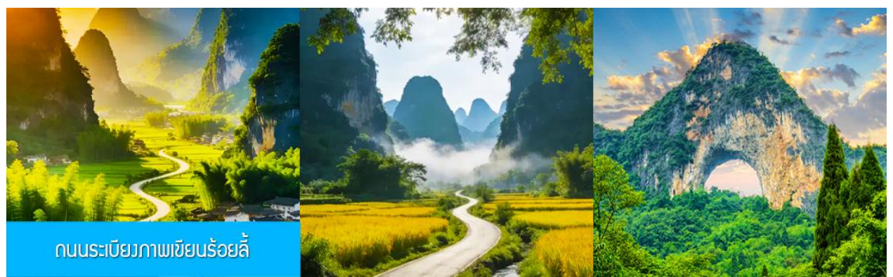
ถนนระเบียบภาพเขียนร้อยลี้

หลังอาหารนำท่านชม ศูนย์จำหน่ายผลิตภัณฑ์ผ้าไหมจีน ที่ได้ชื่อว่าเป็นสินค้าขึ้นชื่อของจีนที่มีมานาน ชม การสาธิตการผลิตผ้าไหม และการแนะนำผลิตภัณฑ์ที่ทำจากผ้าไหม..... จากนั้นนำท่านเดินทางสู่ เมืองหยางชว่ 阳朔 (ระยะทาง 80 กม. ใช้เวลาเดินทาง 1 ชั่วโมง)