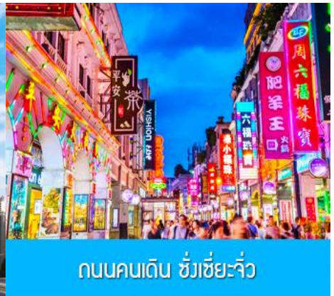
ถนนคนเดิน ชังเซี่ยจิว