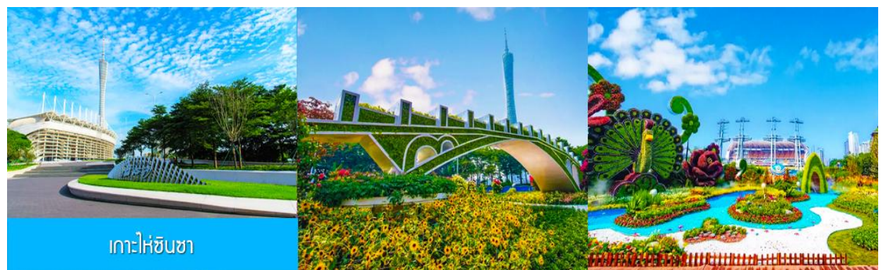
เกาะไห่จินซา