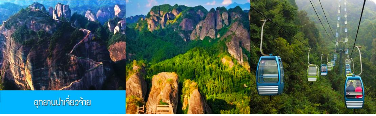
อุทยานปาเจียว้าย

หลังอาหารนำท่านเที่ยวชม อุทยานปาเจียว้าย 崑山八角寨 อุทยานท่องเที่ยวทางธรรมชาติแห่งนี้ ตั้งอยู่บริเวณรอยต่อระหว่างเขตเมืองกุ้ยหลินและมณฑลหูหนาน ประกอบด้วยยอดเขา(หินปูน)ใหญ่รวมแปดยอด มีหกยอดเขาอยู่ในเขตมณฑลหูหนาน ส่วนที่เหลืออีกสองยอดเขาอยู่ในเขตเมืองกุ้ยหลิน มียอดเขาลังซานเป็นยอดเขาหลักที่มีความสูง 818 เมตร มองแต่ไกลดูราวกับหัวมังกรที่เซ็ดหัวชี้ฟ้า อันเป็นที่มาของคำว่า ปาเจียว้าย (แปลว่า ขุนเขา เขาแปดแท่งหรือเขามังกรแปดหัว).....นำท่านนั่งกระเช้า (ค่าตั๋วรวมค่ากระเช้าขาขึ้นและขาลงแล้ว) ขึ้นสู่จุดชมวิวยบนยอดเขา จากนั้นนำท่านเดินไปตามระเบียงชมวิวเพื่อเที่ยวชมจุดชมวิวต่าง ๆ บนยอดเขา อาทิ จุดชมทะเลหมอก จุดชมปลาวาฬพลิกตัว กองทัพหอยค่านับฟ้า ฯลฯ และนำท่านสักการะสิ่งศักดิ์สิทธิ์ ณ วัดหยุนไถชื่อวัดเก่าแก่อายุหลายร้อยปีที่ตั้งโดดเด่นอยู่บนยอดเขา.....เมื่อควรแก่เวลา นำท่านนั่งกระเช้าลงจากยอดเขา