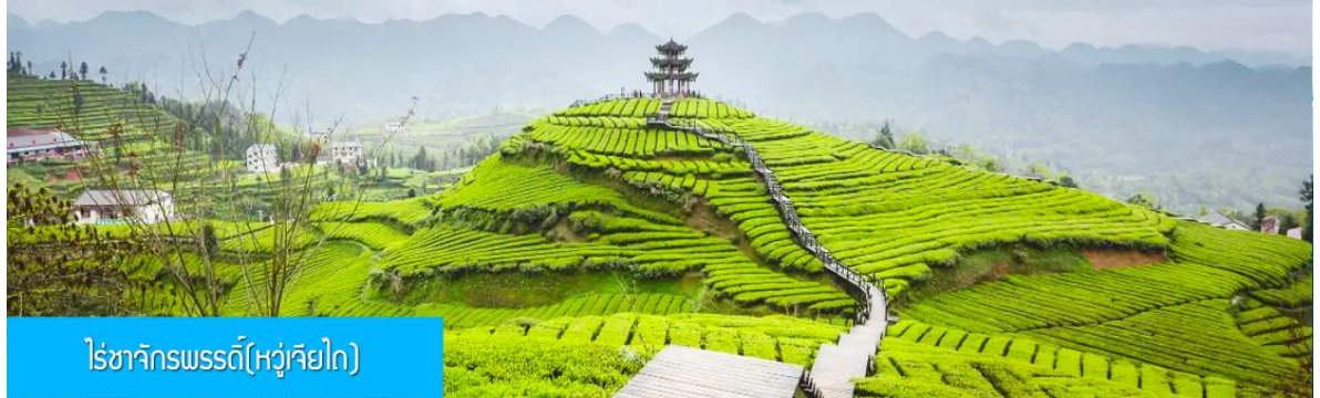
ไร่ชาจักรพรรดิ(หู่เจียไถ)

เช้า รับประทานอาหารเช้า ณ ห้องอาหารของโรงแรม (4)