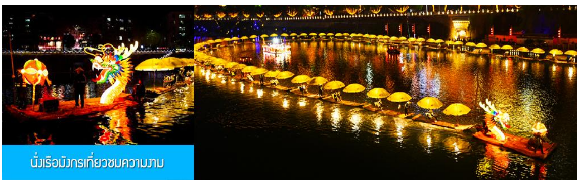
นั่งเรือมังกรเที่ยวชมความงาม

หลังอาหารเช้าท่านเดินทางเข้าที่พัก ไค้ท้อถึ้ง นำเสนอ ไฮโปรแกรมเสริม เป็น โปรแกรม นั่งเรือมังกร เที่ยวชมความงามของบ้านเรือนและสิ่งปลูกสร้างสองฝั่งแม่น้ำในช่วงที่สวยงามที่สุดของเมือง เซียนอิน ที่ประดับประดาด้วยแสงสี และได้ชื่อว่าเป็นวิวยามค่ำคืนที่สวยงามที่สุดในมณฑลหูเป่ย์ เช่นเดียวกับเมืองโบราณฟางหวง ในมณฑลหูหนาน..... อัตราค่าบริการสำหรับโปรแกรมเสริมนั่งเรือมังกรชมวิวยามค่ำคืน ท่านละ 190 หยวน หรือ 950 บาท ระยะเวลาที่ใช้ในการเรือมังกร ประมาณ 45 นาที ค่าบริการรวม ค่าบัตรเข้าชม ค่ารถรับ ส่ง และค่าน้ำดื่มของไค้ท้อถึ้ง