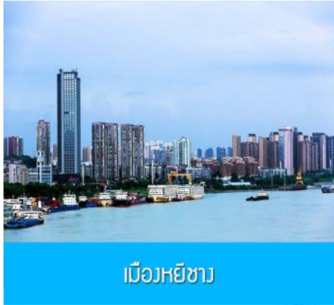
เมืองหยี่ชาง