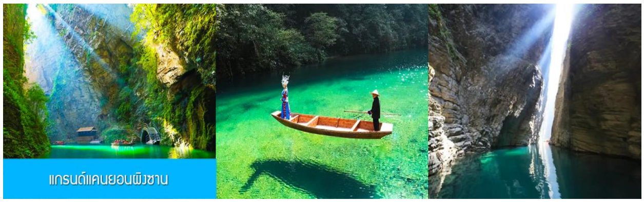
แกรนด์แคนยอนผิงซาน