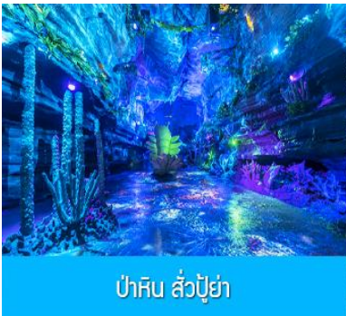
ป่าหิน ส่วปู้ย่า

รับประทานอาหารเช้า ณ ห้องอาหารของโรงแรม (10)