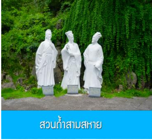
สวนกำสามสหาย