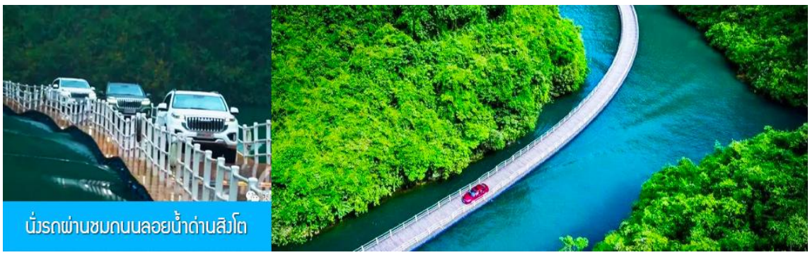
นั่งรถผ่านชมถนนลอยน้ำด่านสิงโต

หลังอาหารเช้าท่านเดินทางโดยรถบัสสู่เมือง เซียนอิน 宜恩市 (ระยะทาง 112 กม ใช้เวลาเดินทางราว 1 ชั่วโมงครึ่ง) ระหว่างทาง ไค้ท้อถึ้ง นำเสนอ ไฮโปรแกรมเสริม ชุดนั่งรถผ่านชมถนนลอยน้ำด่านสิงโต 獅子关 อุทยานท่องเที่ยวที่กลายเป็นจุดเช็คอินยอดนิยมของเมืองอินชือ เคยเป็นจุดตั้งด่านป้องกันการโจมตีของข้าศึก และเป็นด่านเก็บภาษีสินค้าในอดีต ด้วยลักษณะภูมิประเทศที่เป็นทางสัญจรในช่องแคบที่มีผาหินสูงชันมีรูปร่างคล้ายสิงโตเป็นปราการ เหมาะแก่การตั้งด่านสกัด จึงได้รับการขนานนามเป็นด่านสิงโตที่เป็นหนึ่งในสามด่านสำคัญของมณฑลหูเป่ย์ในอดีต.....ไฮไลท์ของการเที่ยวอุทยานคือการ นั่งรถผ่านสะพานลอยน้ำความยาว 9 กม. เป็นสะพานที่ใช้หุ่นลอยน้ำที่ร้อยเรียงเป็นแนวยาวเหนือน้ำ ได้สะพานไม่มีมือม้อค้ำยัน ระหว่างที่รถวิ่งผ่านสะพานท่านจะได้สัมผัสวิวทิวทัศน์ที่สวยงามสองฝั่งสะพานและน้ำสีเขียวมรกต..... อัตราค่าบริการสำหรับโปรแกรมท่องเที่ยวอุทยาน ด่านสิงโต ท่านละ 300 หยวนหรือ 1,500 บาท รวมค่าบริการเข้าอุทยาน ค่ารถอุทยานผ่านชมถนนลอยน้ำ ค่ารถรับ ส่ง ไปยังอุทยาน รวมเวลาท่องเที่ยวและเดินทางไป กลับ ราว 2 ชั่วโมงเศษ