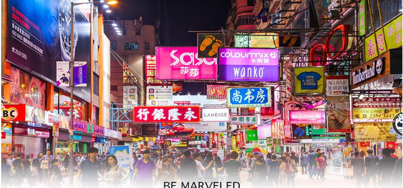
BE MARVELED TSM SHA TSUI

จากนั้นนำท่าน ช้อปปิ้ง ย่านจิมซาจุ่ย เป็นแหล่งช้อปปิ้งชื่อดัง มีร้านขายของทั้งเครื่องหนัง, เครื่องกีฬา, เครื่องใช้ไฟฟ้า, กล้องถ่ายรูป, อุปกรณ์อิเล็กทรอนิกส์และสินค้าแบบที่เป็นของพื้นเมืองฮ่องกงอยู่ด้วย อีกทั้งสินค้าแบรนด์เนม รวมถึงร้านอาหาร ตั้งอยู่บนถนนนาธาน ถนนทอดยาวตั้งแต่จิมซาจุ่ย จนถึงย่านปรีนซ์เอ็ดเวิร์ด เต็มไปด้วยร้านค้าต่าง ๆ มากมาย ทั้งเสื้อผ้าแบรนด์เนมระดับ HI-END ชื่อดังทั่วโลก ห้างสรรพสินค้าที่ทันสมัย จากถนน นาธานไปที่ถนนแคนตัน ท่านจะตื่นตาตื่นใจไปกับอาคารที่เรียงติดกันเป็นแถบ นอกจากนี้ยังมี HARBOUR CITY ศูนย์การค้ายักษ์ใหญ่ของฮ่องกง ซึ่งมีร้านค้ากว่า 450 ร้านรวมอยู่ที่นี้ และมี SHOPPING COMPLEX ขนาดใหญ่ชื่อ OCEAN TERMINAL ซึ่งประกอบไปด้วยห้างสรรพสินค้า