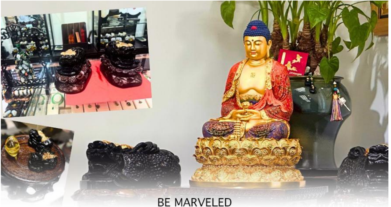
BE MARVELED ศูนยี่ปี่เซี่ยะ

และนำท่านชม ศูนยี่ปี่เซี่ยะ ซึ่งคนจีนนั้น ถือว่าหยกเป็นหิน ที่เป็นตัวแทนของความสวยงามและความบริสุทธิ์ที่มีความเชื่อว่าหยก มงคล ถ้าพกติดตัวไว้จะอายุยืนและสุขภาพดีมีสินค้ามากมายเกี่ยวกับหยก อาทิ กำไลหยก หรือสัตว์นำโชคอย่างปี่เซี่ยะ ให้ท่านได้เลือกซื้อเป็นของฝาก, ของที่ระลึก หรือของนำโชคแต่ตัวท่านเอง