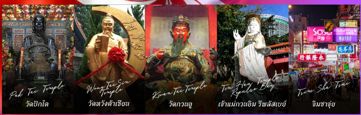
Pak Tai Temple วัดปึกโต

รายการทัวร์ข้างต้นอาจมีการปรับเปลี่ยนเพื่อความเหมาะสม