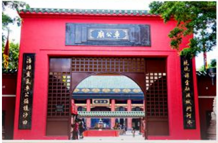
BE MARVELED วัดเซกง

จากนั้นนำท่าน ช้อปปิ้ง ย่านจิมซาจุ่ย เป็นแหล่งช้อปปิ้งชื่อดัง มีร้านขายของทั้งเครื่องหนัง, เครื่องกีฬา, เครื่องใช้ไฟฟ้า, กล้องถ่ายรูป, อุปกรณ์อิเล็กทรอนิกส์และสินค้าแบบที่เป็นของพื้นเมืองฮ่องกงอยู่ด้วย อีกทั้งสินค้าแบรนด์เนม รวมถึงร้านอาหาร ตั้งอยู่บนถนนนาธาน ถนนทอดยาวตั้งแต่จิมซาจุ่ย จนถึงย่านปรีนซ์เอ็ดเวิร์ด เต็มไปด้วยร้านค้าต่าง ๆ มากมาย ทั้งเสื้อผ้าแบรนด์เนมระดับ HI-END ชื่อดังทั่วโลก ห้างสรรพสินค้าที่ทันสมัย จากถนน นาธานไปที่ถนนแคนตัน ท่านจะตื่นตาตื่นใจไปกับอาคารที่เรียงติดกันเป็นแถบ นอกจากนี้ยังมี HARBOUR CITY ศูนย์การค้ายักษ์ใหญ่ของฮ่องกง ซึ่งมีร้านค้ากว่า 450 ร้านรวมอยู่ที่นี้ และมี SHOPPING COMPLEX ขนาดใหญ่ชื่อ OCEAN TERMINAL ซึ่งประกอบไปด้วยห้างสรรพสินค้า