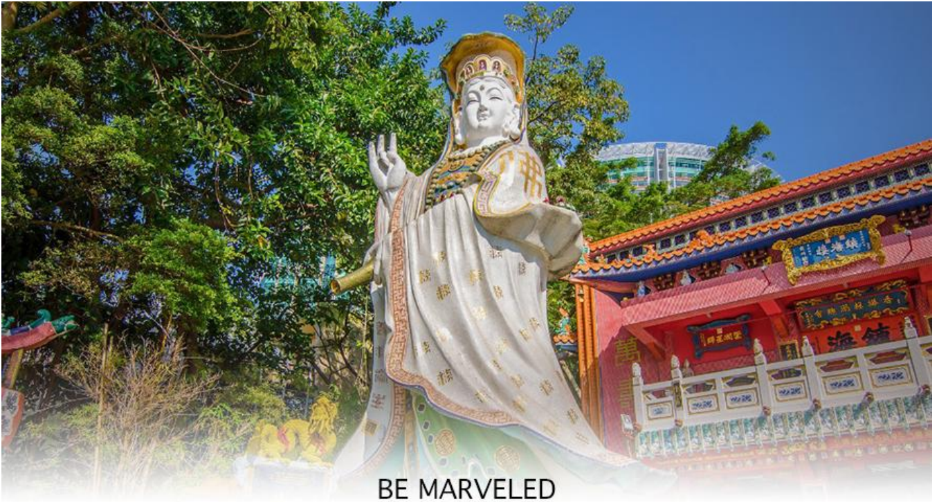
BE MARVELED วัดเจ้าแม่กวนอิมรัพลีเบย์