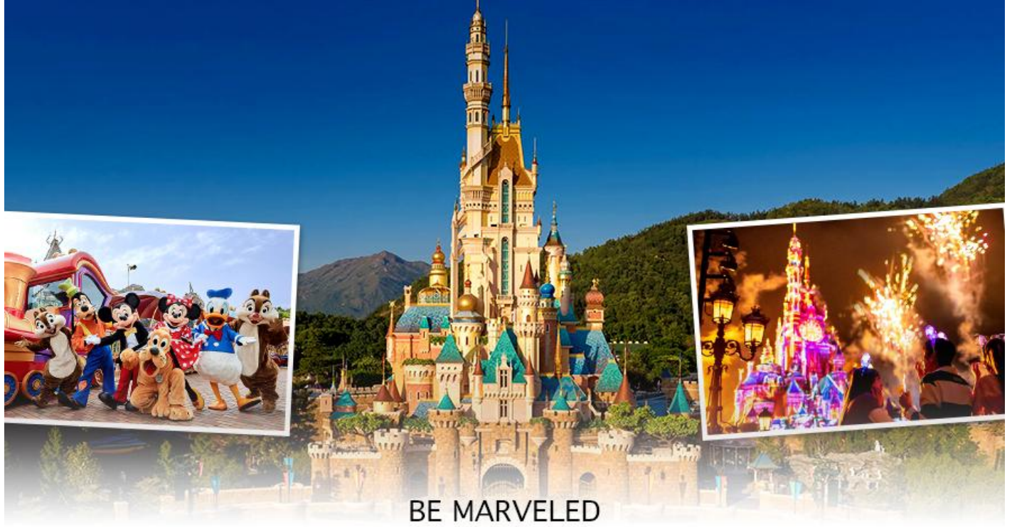
BE MARVELED HONG KONG DISNEYLAND

☉ อีสาระอาหารเที่ยงและอาหารเย็น เพื่อความสะดวกในการขอปิ้ง