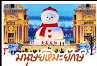
มนุษย์หิมะยักษ์