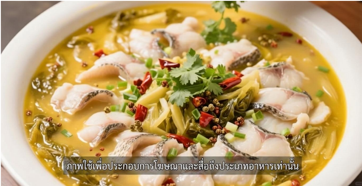
ภาพใช้เพื่อประกอบการโฆษณาและสื่อถึงประเภทอาหารเท่านั้น

คำ รับประทานอาหารค่ำ ณ ภัตตาคาร (มื้อที่ 2) เมนูซูปลากัดทอง เมนูเด็ดที่กำลังเป็นกระแสไวรัลและถูกเหล่านักชิมตลอดจนบล็อกเกอร์สายกิน รีวิวตามรอยกันอย่างล้น หลาม งานศิลปะแห่งรสชาติที่ผสมผสานความจัดจ้านได้อย่างลงตัว น้ำซุปลีทองสุดเข้มข้น หัวใจหลักของ คือรส "เปรี้ยว" นำที่ได้จากผักกาดดอง ซึ่งผ่านการหมักบ่มตามธรรมชาติจนเกิดกรดแลคติกที่ให้อรรถรสเปรี้ยว กลมกล่อม ช่วยเปิดต่อมรับรสและเรียกน้ำย่อยได้ดีเยี่ยม ผสานเข้ากับความ "เผ็ดชา" จากพริกแห้งและ พริกไทยเสฉวน ชดแล้วตาสว่าง สดชื่น โฉมคอบ