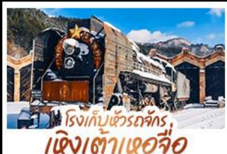
โรงเก็บเขื่อนจักร เจิ่งเต้าเฮอจื่อ