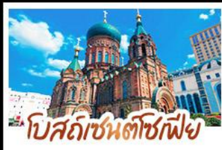
โบสถ์เซ็นต์โซเฟีย