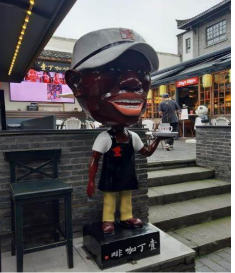
เที่ยง รับประทานอาหารกลางวัน ณ ภัตตาคาร เมนูพิเศษ สุกี้หม่าล่าไม่อัน ต้นตำรับ