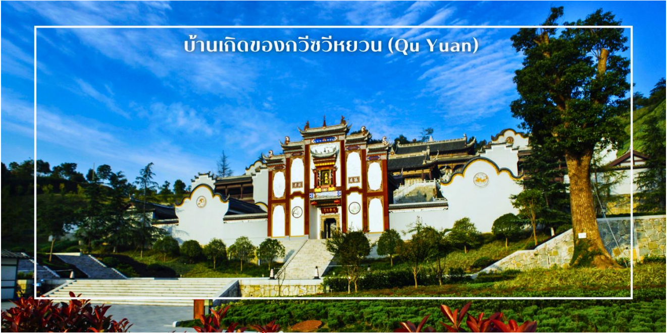
บ้านเกิดของกวีซีเหียน (Qu Yuan)

นำท่านเดินทางสู่ บ้านเกิดของกวีซีเหียน (Qu Yuan) สถานที่เกิดของบุคคลสำคัญทางประวัติศาสตร์และวรรณกรรมของประเทศจีน ผู้ได้รับการยกย่องว่าเป็นกวีผู้ยิ่งใหญ่แห่งยุครัฐจั้นกั๋ว และเป็นสัญลักษณ์แห่งความซื่อสัตย์และความจงรักภักดี บ้านเกิดของซีเหียนตั้งอยู่ริมแม่น้ำแยงซีเกียง เป็นสถานที่ที่สะท้อนเรื่องราวชีวิต แนวคิด และผลงานทางวรรณกรรมอันทรงคุณค่า ซึ่งมีอิทธิพลต่อวัฒนธรรมจีนสืบต่อมาจนถึงปัจจุบัน (รวมรถแบริดเตอร์)