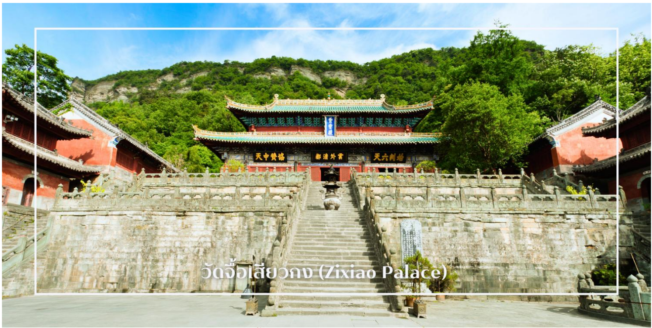
วัดจื่อเสี่ยวกง (Zixiao Palace)