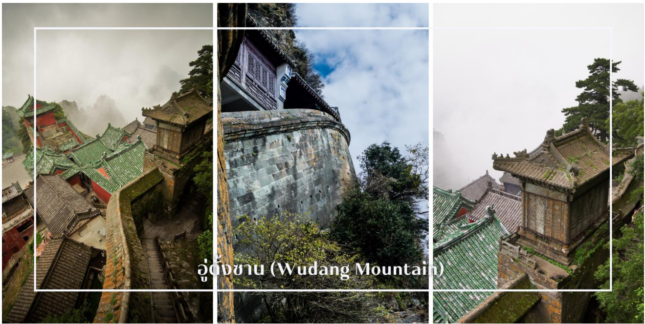
อู่ต้งซาน (Wudang Mountain)

ยอดเขาทองคำ หรือ จินตัง (Jinding) เป็นจุดสูงสุดและศูนย์กลางอันศักดิ์สิทธิ์ของภูเขาอู่ต้งซาน แหล่งรวมศรัทธาแห่งลัทธิเต๋าที่มีความสำคัญสูงสุดแห่งหนึ่งของประเทศจีน บนยอดเขาประดิษฐานวิหารทองคำ ซึ่งสร้างขึ้นในสมัยราชวงศ์หมิง มีความงดงามและโดดเด่นด้วยสถาปัตยกรรมอันประณีต สะท้อนความรุ่งเรืองทางศิลปะและความเชื่อในอดีต ท่านสามารถชื่นชมทัศนียภาพของเทือกเขาอู่ต้งซานที่ทอดยาวสลับซับซ้อน ท่ามกลางทะเลหมอกอันงดงาม ที่นี่เป็นจุดหมายสำคัญที่ผสมผสานความศักดิ์สิทธิ์ ความงามของธรรมชาติ และคุณค่าทางประวัติศาสตร์ไว้อย่างลงตัว