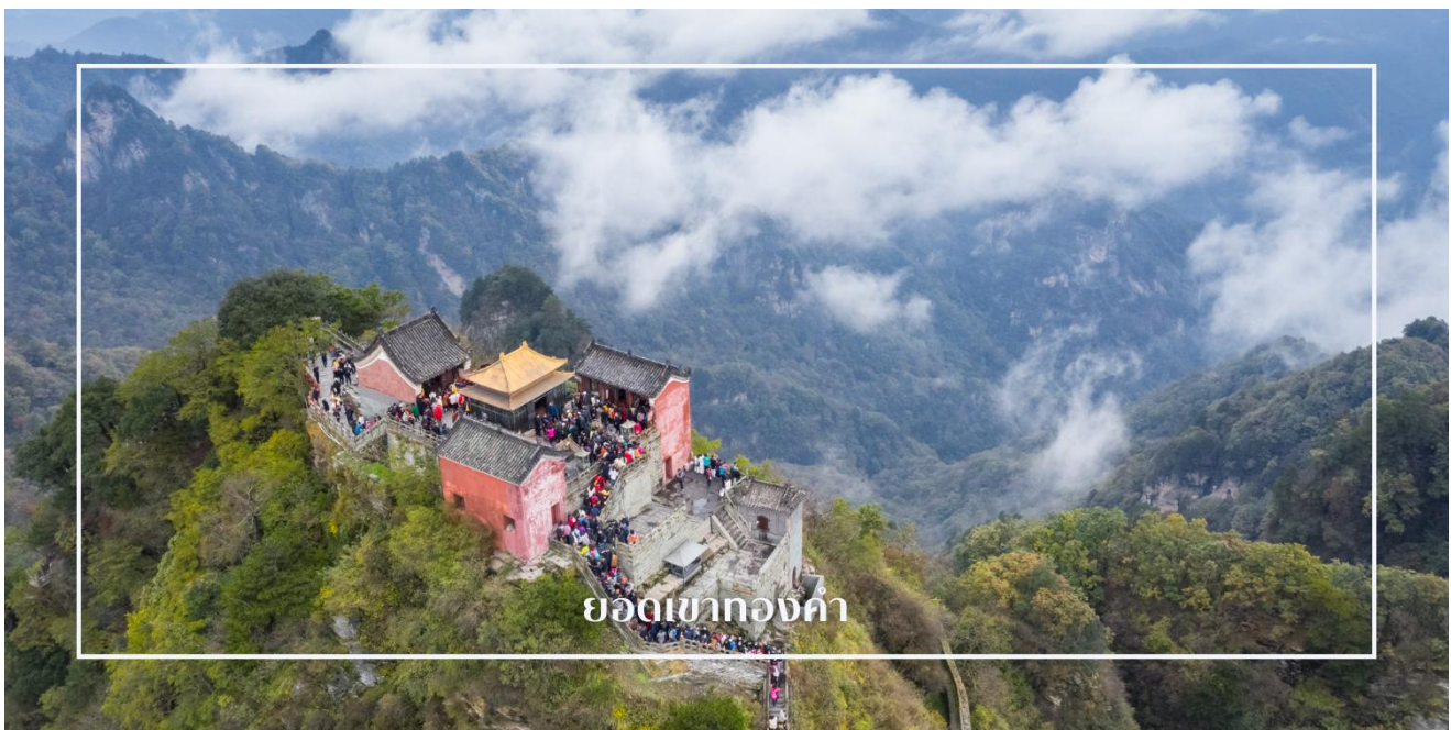
ยอดเขาทองคำ

ยอดเขาทองคำ หรือ จินตัง (Jinding) เป็นจุดสูงสุดและศูนย์กลางอันศักดิ์สิทธิ์ของภูเขาอู่ต้งซาน แหล่งรวมศรัทธาแห่งลัทธิเต๋าที่มีความสำคัญสูงสุดแห่งหนึ่งของประเทศจีน บนยอดเขาประดิษฐานวิหารทองคำ ซึ่งสร้างขึ้นในสมัยราชวงศ์หมิง มีความงดงามและโดดเด่นด้วยสถาปัตยกรรมอันประณีต สะท้อนความรุ่งเรืองทางศิลปะและความเชื่อในอดีต ท่านสามารถชื่นชมทัศนียภาพของเทือกเขาอู่ต้งซานที่ทอดยาวสลับซับซ้อน ท่ามกลางทะเลหมอกอันงดงาม ที่นี่เป็นจุดหมายสำคัญที่ผสมผสานความศักดิ์สิทธิ์ ความงามของธรรมชาติ และคุณค่าทางประวัติศาสตร์ไว้อย่างลงตัว