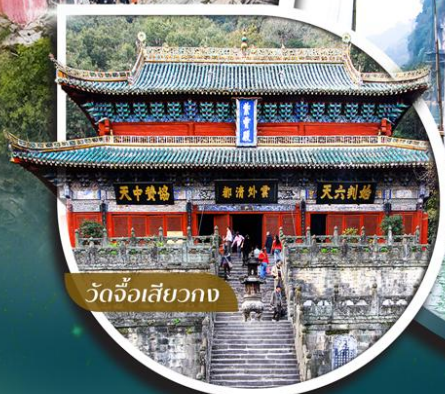
วัดจ้อเสียวกวง

คอนเสิร์ตออกเดินทาง ตั้งแต่ 10 ท่าขึ้นไป