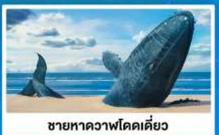
ชายหาดวาฬโดคเตี๋ย