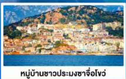
หมู่บ้านชาวประมงซาจื่อโจว