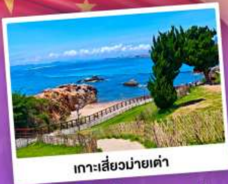
เกาะเสี่ยวมายเต่า

เที่ยวชิงเต่า เมืองทะเลสุดชิล ครบทั้งกิน เที่ยว ถ่ายรูป