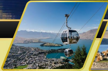
นั่งกระเช้ากอนโดล่า