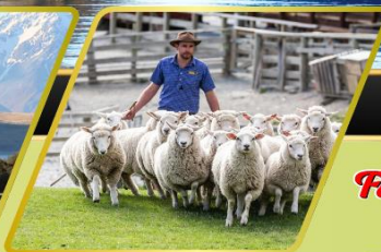
วอลเตอร์ฟิคฟาร์ม