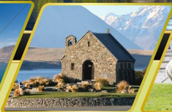
ทะเลสาบเทคาโป