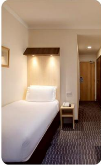
ห้องพัก สำหรับ 1 ท่าน SINGLE ROOM (SGL)