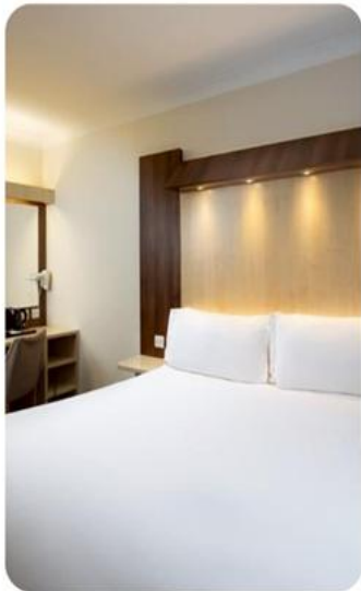
ห้องพัก สำหรับ 2 ท่าน DOUBLE ROOM (DBL)