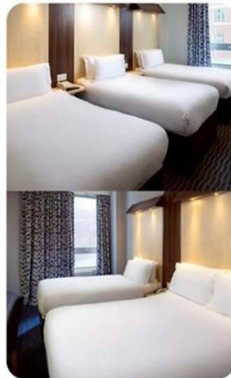
ห้องพัก สำหรับ 3 ท่าน TRIPLE ROOM (TRP)

กรณีห้อง Twin Bed ของทางโรงแรมไม่มีหรือเต็ม ทางบริษัทขอปรับเป็นห้อง Double Bed แทน หรือ หากต้องการห้องพักแบบ Double Bed ของทางโรงแรมไม่มีหรือเต็ม ทางบริษัทขอปรับเป็นห้อง Twin Bed แทน และหากต้องการพักแบบ Triple Room ของทางเราไม่มีหรือเต็ม ทางบริษัทขอปรับเป็นห้อง 1 เตียงใหญ่ (Queen Size) + 1 เตียงเล็กแทน โดยมีต้องแจ้งให้ทราบล่วงหน้า กรณีที่ท่านมาเป็นครอบครัวใหญ่และมีการริเสขอห้องพักคนละประเภท หรือ ประเภทเดียวกัน ห้องพักวันที่เข้าพักอาจจะไม่ได้อยู่ใกล้กัน หรือ อาจจะไม่ได้อยู่ในชั้นเดียวกัน เนื่องจากในแต่ละโรงแรมมีการจัดห้องพักที่แตกต่างกันไป