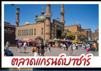
ตลาดแกรนด์บาชาร์