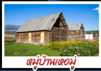
หมู่บ้านเหม่อู่