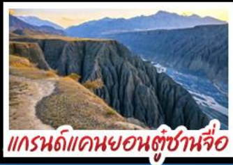
แกรนด์แคนยอนตู้ซานจื่อ

ทะเลสาบไซหลู่มี - คานาสือ แกรนด์แคนยอนตู้ซานจื่อ ตลาดแกรนด์บาชาร์ - หมู่บ้านเหม่อู่