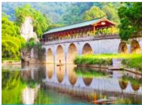
สวนเจ็ดดาว

หลังอาหารนำท่านเดินทางสู่ เมืองกุ้ยหลิน 桂林 เมืองท่องเที่ยวชื่อดังในมณฑลกวางสี