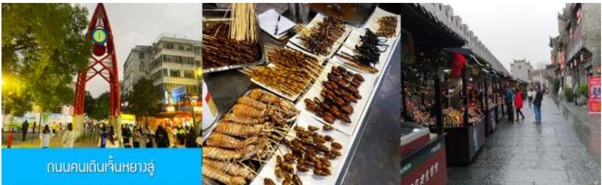
ถนนคนเดินจิ้นหยางลู่