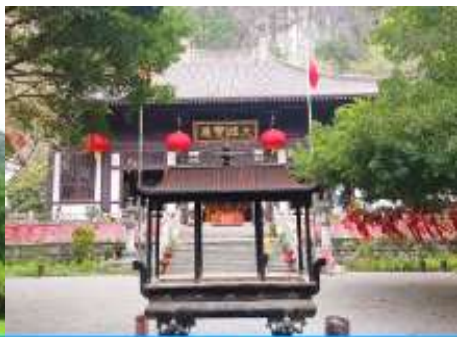
วัดชีเสี่ย