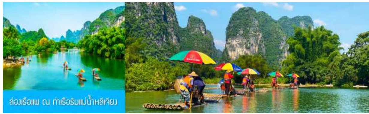
ล่องเรือแพ ณ กำเรือริมแม่น้ำหลีเจียง