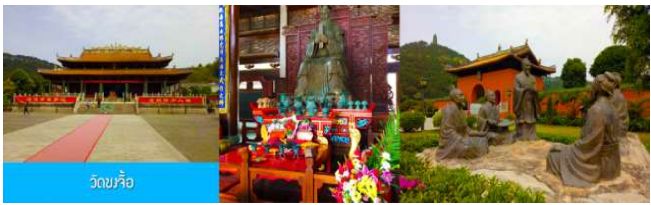
วัดขงจื้อ