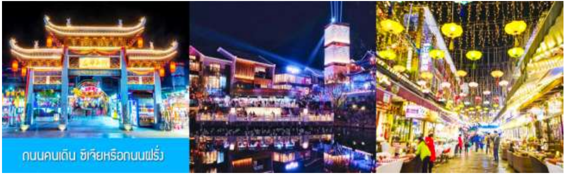
ถนนคนเดิน ซิเจียหรือถนนฝรั่ง