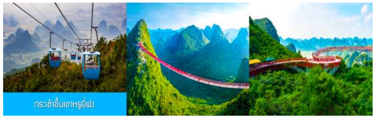
กระเช้าขึ้นเขาหุ้ยเฟิง