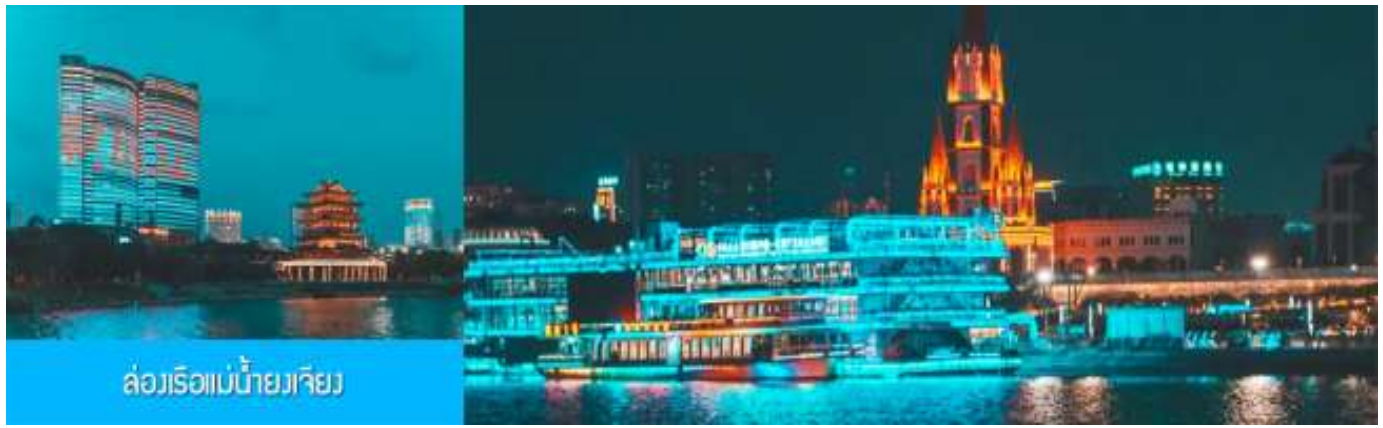
ล่องเรือแม่น้ำยงเจียง

ไกด์ท้องถิ่นนำเสนอ โปรแกรมทัวร์เสริม OPTIONAL TOUR ล่องเรือแม่น้ำยงเจียงชมแสงสียามค่ำของเมืองหนานหนิง..... อัตราค่าบริการสำหรับโปรแกรมเสริมเมืองลับแล ท่านละ 250 หยวน ใช้เวลาประมาณ 1 ชั่วโมงครึ่ง ค่าบริการรวม ค่าบัตรเข้าชม ค่ารถรับ ส่ง และค่าน้ำทิพย์ของไกด์ท้องถิ่น