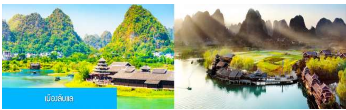
เมืองลิบแล

อิสระอาหารค่ำเพื่อความสะดวกในการเดินเที่ยว และชมอาหารพื้นเมืองตามอัธยาศัย พักที่ YANGSHUO ELITE GARDEN HOTEL ระดับ 4 ดาวห้องถื่นหรือเทียบเท่าใน เมืองหยางซั่ว