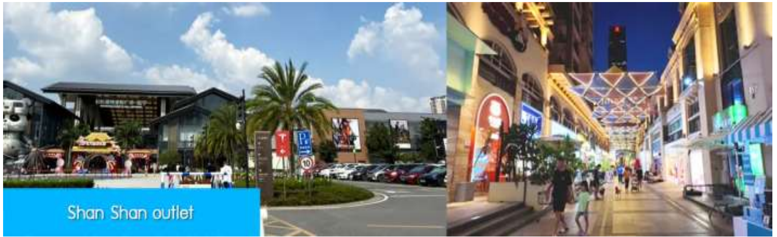
Shan Shan outlet

เช้า บริการอาหารเช้า ณ ร้านอาหารในโรงแรม (8)