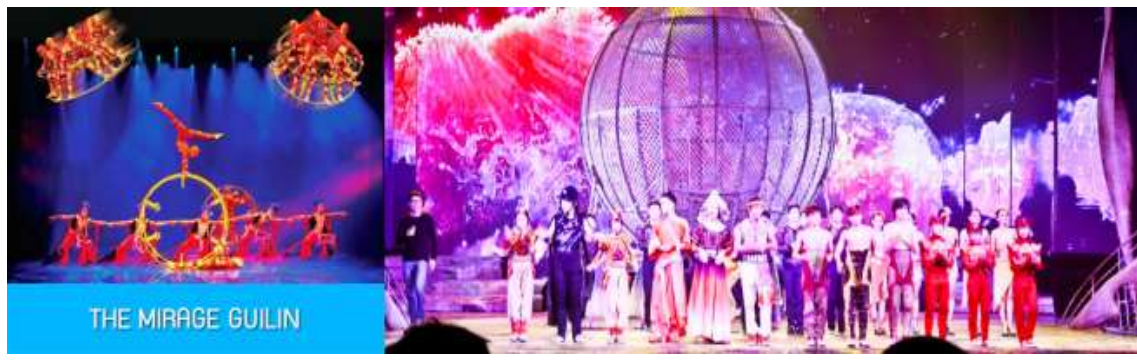
THE MIRAGE GUILIN