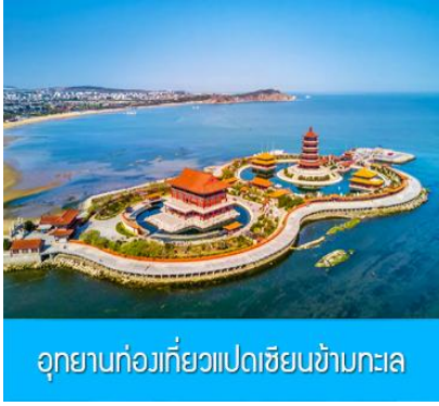
อุทยานท่องเที่ยวแปดเซียนข้ามทะเล