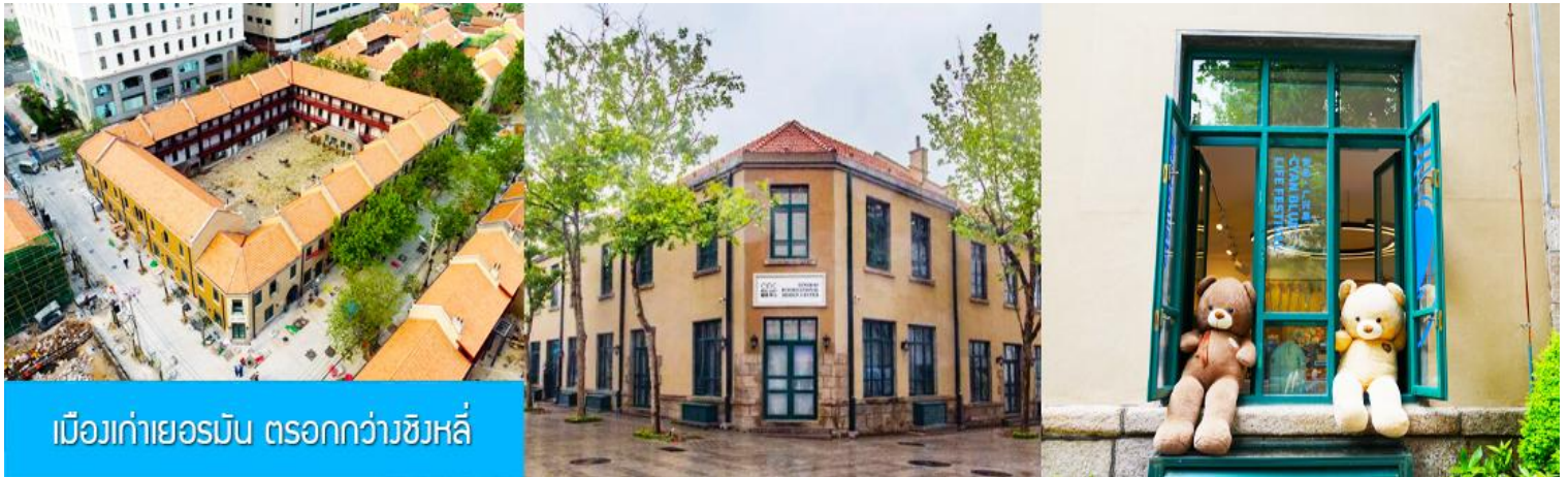
เมืองเก่าเยอรมัน ตรอกกว้างชิงหลี่