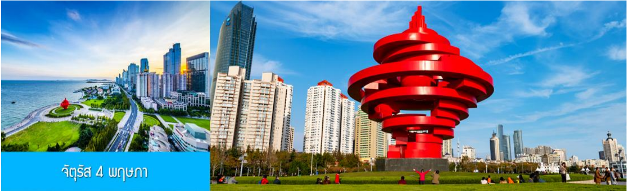
จัตุรัส 4 พฤษภาคม

จากนั้นนำท่านเที่ยวชม โรงเบียร์ชิงเต่า 青岛啤酒博物馆 พิพิธภัณฑ์เบียร์ที่ขึ้นชื่อของเมืองชิงเต่า ซึ่งเป็นเบียร์ยี่ห้อแรกที่ผลิตขึ้นในประเทศจีน ชมเบียร์ คอลเลกชั่นที่มียี่ห้อหลากหลายที่สุดของโลก และชมการจัดแสดงภาพและวิดิทัศน์เกี่ยวกับวิวัฒนาการของเบียร์ ขั้นตอนการผลิตและอื่น ๆ ที่เกี่ยวข้อง พร้อมชมเบียร์ชิงเต่า ซึ่งเป็นเบียร์ที่ขายดีที่สุดในยี่ห้อหนึ่งของจีน.. (ชมเบียร์ชิงเต่าท่านละ 1 แก้ว รับกลับอีก 1 ขวดเล็ก ตอนเดินออก)