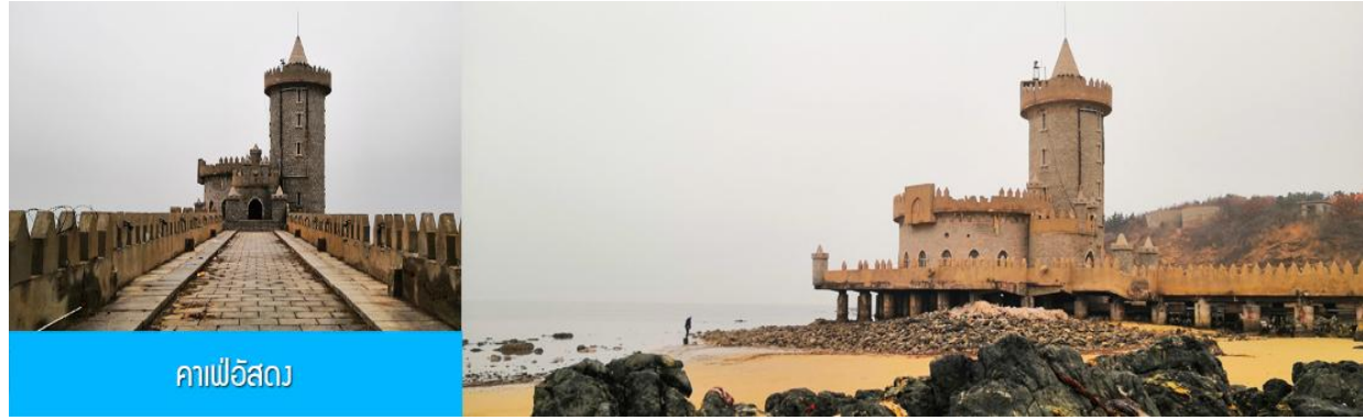
คาเฟ่อีสต