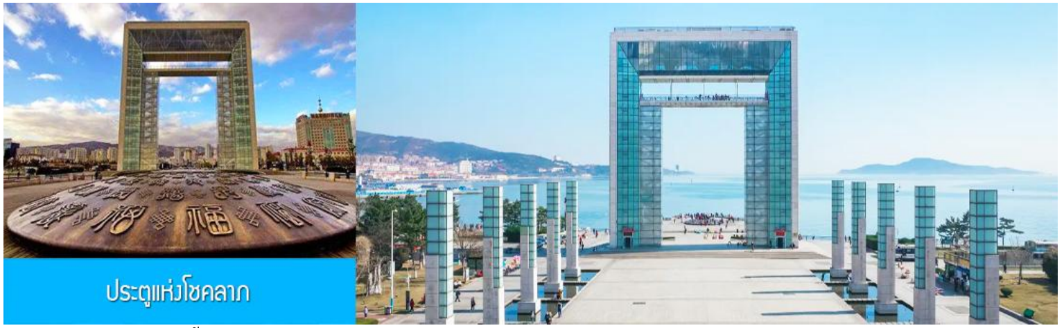
ประตูแห่งโชคกลาง