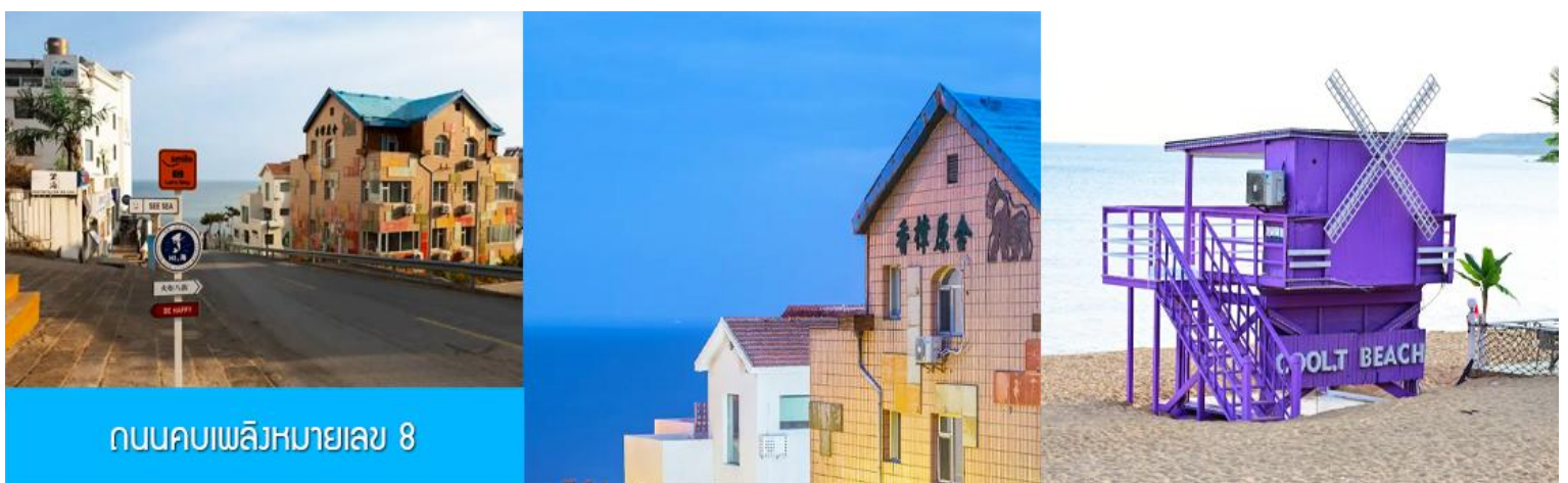
ถนนคบเพลิงหมายเลข 8

นำท่านชมสวนสาธารณะเวย์ไห่ 威海公园 สวนสาธารณะริมทะเลที่ใหญ่ที่สุดของเมืองเวย์ไห่ ให้ท่านชมและถ่ายภาพคู่กับ กรอบรูปยักษ์วิวทะเล 威海公园大相框 แลนด์มาร์คที่เป็นอีกหนึ่งไฮไลท์ที่ฮิตของเมืองเวย์ไห่