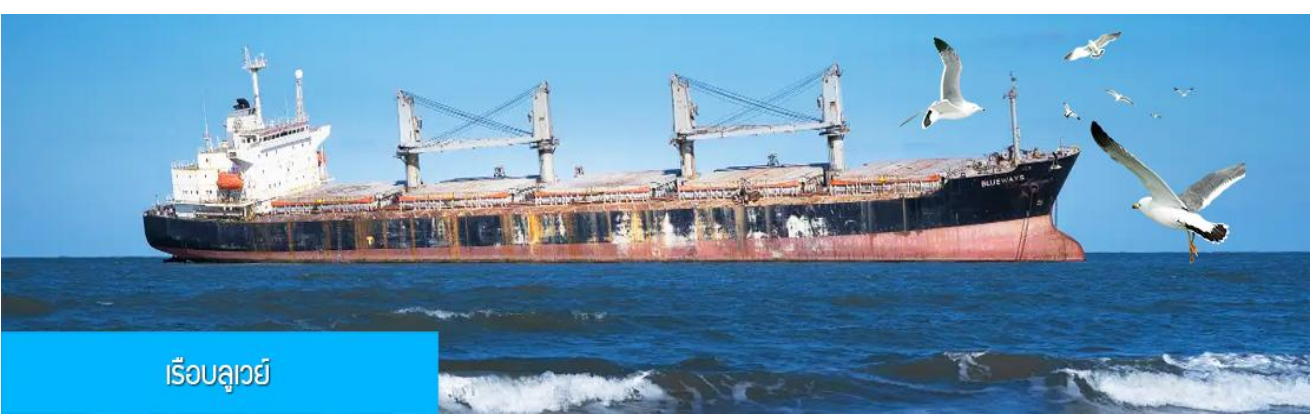
เรือบลูเวย์

เที่ยง รับประทานอาหารกลางวัน ณ ภัตตาคาร (5)