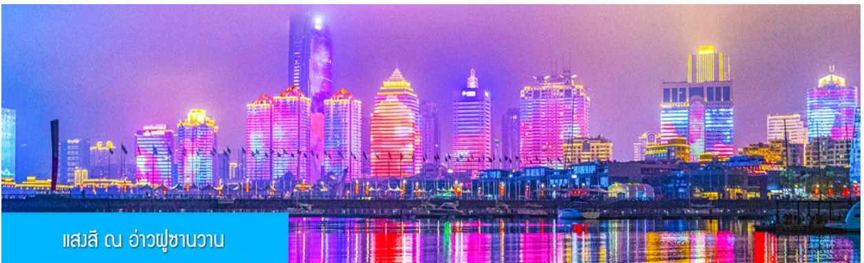
แอสสิ ณ อ่าวปูซานวาน

ค่า รับประทานอาหารค่ำ ณ ภัตตาคาร *เมนูซีฟู้ด (3)