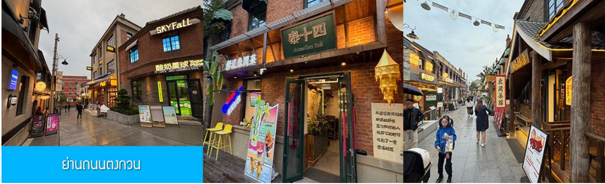
ย่านถนนตวงกวน