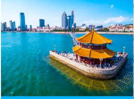
สะพานเจี้ยนเฉียว

เช้า รับประทานอาหารเช้า ณ ห้องอาหารของโรงแรม (1)