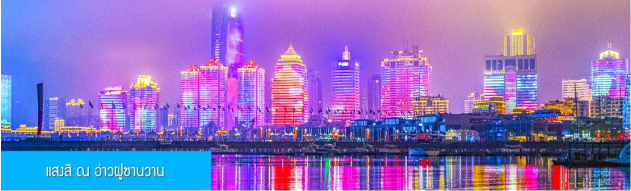
แสงสี ณ อ่าวฟูซานวาน