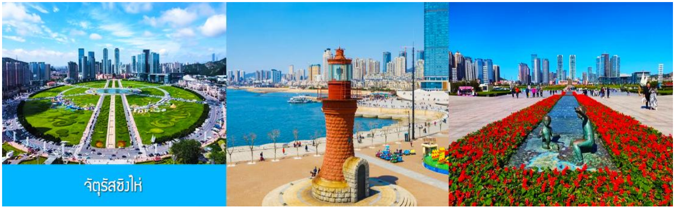
จัตุรัสชิงไห่

จากนั้นนำท่านเที่ยวชมและเก็บภาพ ณ พิพิธภัณฑ์ประวัติศาสตร์หลี่ชุ่น 旅顺博物馆 เป็นอาคารพิพิธภัณฑ์ เก่าแก่อายุกว่าร้อยปีแห่งแรกที่สร้างขึ้นทางภาคตะวันออกเฉียงเหนือของจีน อาคารพิพิธภัณฑ์มีความโดดเด่น ด้วยสถาปัตยกรรมแบบกรีก โรมันยุคเรเนซองส์ ผสมผสานสถาปัตยกรรมแบบตะวันตกออก ภายนอกมีการจัดแสดง โบราณวัตถุกว่า 60,000 ชิ้น ท่านสามารถเก็บภาพที่ระลึกด้านหน้าอาคารพิพิธภัณฑ์ และสามารถเข้าชม โบราณวัตถุภายในพิพิธภัณฑ์ได้ตามอรรถาธิบาย (พิพิธภัณฑ์ปิดทุกวันจันทร์)..