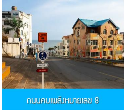
ถนนคอบเพลิงหมายเลข 8

นำท่านชมสวนสาธารณะเวย์ไห่ 威海公园 สวนสาธารณะริมทะเลที่ใหญ่ที่สุดของเมืองเวย์ไห่ ให้ท่านชมและถ่ายภาพคู่กับ กรอบรูปยักษ์วิวทะเล 威海公园大相框 แลนด์มาร์คที่เป็นอีกหนึ่งไฮไลท์ที่สุดฮิตของเวย์ไห่