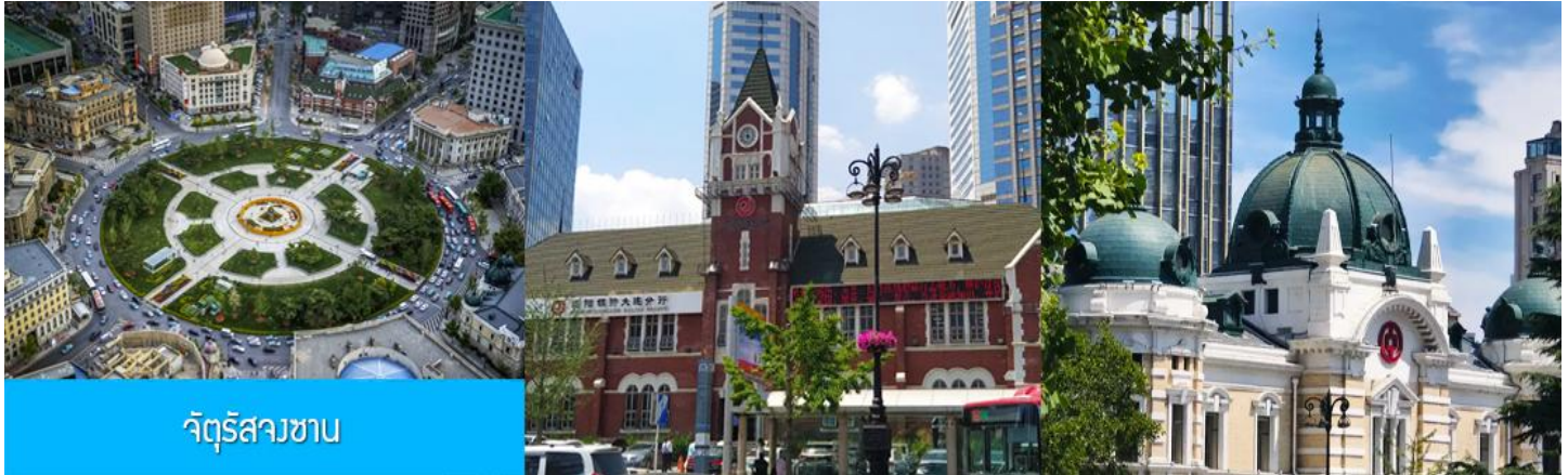
จัตุรัสสวน