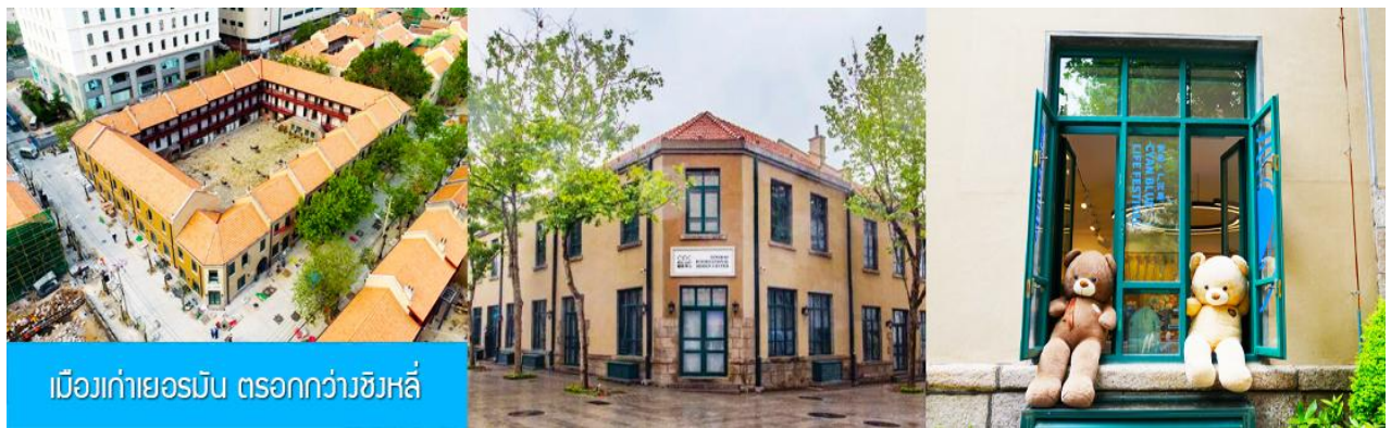
เมืองเก่าเยอรมัน ตรอกกว้างซิงหลี่

จากนั้นนำท่านเดินเที่ยวชม ถนนจงซาน 中山路 ถนนที่เต็มไปด้วยกลิ่นอายยุโรป และถนนสายนี้มีบันทึกเรื่องราวมากกว่าศตวรรษของเมืองชิงเต่าไว้ ที่นี่เป็นศูนย์กลางการค้าแห่งแรกที่เต็มไปด้วยสถาปัตยกรรมสไตล์ยุโรปเก่าแก่ที่ได้รับอิทธิพลมาจากเยอรมัน ให้ท่านได้เดินเก็บบรรยากาศ และ เก็บภาพกับ โบสถ์เซนต์ไมเคิล (ด้านนอก) โบสถ์แห่งนี้ที่คู่รักนิยมมาถ่ายภาพงานแต่งงานมากที่สุดในเมืองชิงเต่า ให้ท่านถ่ายรูปเก็บภาพ