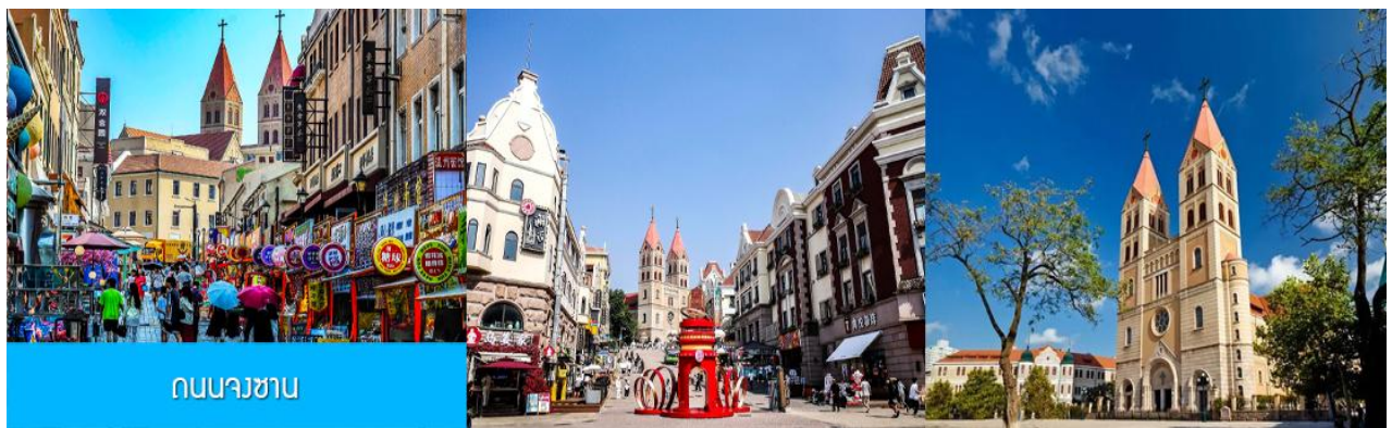
ถนนนางซาน

หลังอาหารนำท่านเดินทางชม สะพานจ้านเจียว 栈桥 เป็นแลนด์มาร์กแห่งประวัติศาสตร์คู่เมืองชิงเต่า สร้างเมื่อปี ค.ศ.1891 มีลักษณะเป็นสะพานหินทอดยาวกว่า 440 เมตรสู่ทะเล ปลายสะพานมีศาลา ทรงแปดเหลี่ยมสีแดงที่โดดเด่น ซึ่งเป็นสัญลักษณ์บนฉลากเบียร์ชิงเต่า ขึ้นชื่อเรื่องวิวสวย รับลมทะเล ให้ท่านเก็บภาพบรรยากาศ