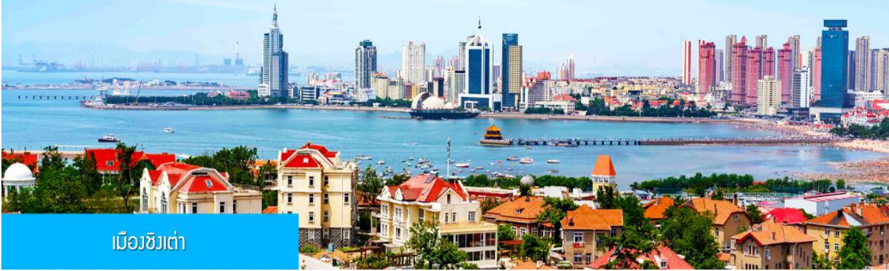
เมืองชิงเต่า