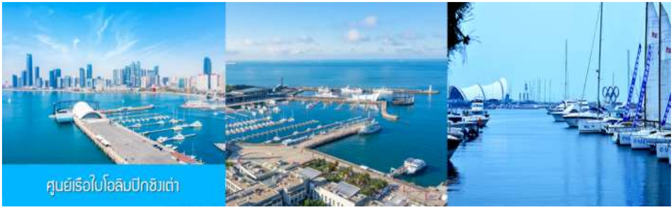
ศูนย์เรือใบโอลิมปิกชิงเต่า

จากนั้นนำท่านเที่ยวชม โรงเบียร์ชิงเต่า 青岛啤酒博物馆 พิพิธภัณฑ์เบียร์ที่ขึ้นชื่อของเมืองชิงเต่า ซึ่งเป็นเบียร์ยี่ห้อแรกที่ผลิตขึ้นในประเทศจีน ชมเบียร์ คอลเลกชันที่มียี่ห้อหลากหลายที่สุดของโลก และชมการจัดแสดงภาพและวิดีโอเกี่ยวกับวิวัฒนาการของเบียร์ ขั้นตอนการผลิตและอื่น ๆ ที่เกี่ยวข้อง พร้อมชิมเบียร์ชิงเต่า ซึ่งเป็นเบียร์ที่ขายดีที่สุดยี่ห้อหนึ่งของจีน.. (ชิมเบียร์ชิงเต่าท่านละ 1 แก้ว รับกลับอีก 1 ขวดเล็ก ตอนเดินออก)