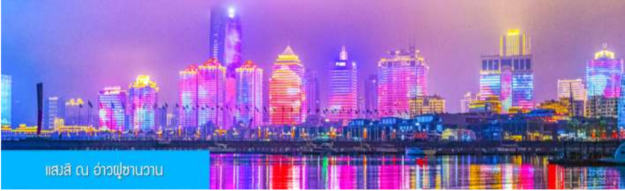
แอสสิ ณ อ่าวฟูซานวาน