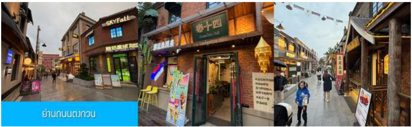
ย่านถนนตงกวน

นำท่านเที่ยวชม จัตุรัส星海 星海广场 เป็นจัตุรัสขนาดใหญ่เป็นแลนด์มาร์คสำคัญของเมืองต้าเหลียน สร้างขึ้นเพื่อเฉลิมฉลองในโอกาสที่รัฐบาลอังกฤษคืนเกาะฮ่องกงในให้จีนในปี ค.ศ. 1997 ตั้งอยู่ชายฝั่งทะเลในเมืองต้าเหลียน เป็นจัตุรัสใจกลางเมืองที่ใหญ่ที่สุดในโลกและเป็นแลนด์มาร์คของเมืองต้าเหลียน รายล้อมด้วยตึกระฟ้าที่ทันสมัย ภายในมีบ่อน้ำพุดนตรี ลานหญ้าขนาดใหญ่ และลานกว้างสำหรับจัดกิจกรรมกลางแจ้ง อาทิ เทศกาลเบียร์นานาชาติ การแข่งขันวิ่งมาราธอน งานแฟชั่นนานาชาติเมืองต้าเหลียน ฯลฯ