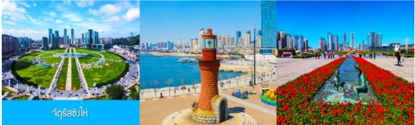
จัตุรัส星海

นำท่านเที่ยวชม จัตุรัส星海 星海广场 เป็นจัตุรัสขนาดใหญ่เป็นแลนด์มาร์คสำคัญของเมืองต้าเหลียน สร้างขึ้นเพื่อเฉลิมฉลองในโอกาสที่รัฐบาลอังกฤษคืนเกาะฮ่องกงในให้จีนในปี ค.ศ. 1997 ตั้งอยู่ชายฝั่งทะเลในเมืองต้าเหลียน เป็นจัตุรัสใจกลางเมืองที่ใหญ่ที่สุดในโลกและเป็นแลนด์มาร์คของเมืองต้าเหลียน รายล้อมด้วยตึกระฟ้าที่ทันสมัย ภายในมีบ่อน้ำพุดนตรี ลานหญ้าขนาดใหญ่ และลานกว้างสำหรับจัดกิจกรรมกลางแจ้ง อาทิ เทศกาลเบียร์นานาชาติ การแข่งขันวิ่งมาราธอน งานแฟชั่นนานาชาติเมืองต้าเหลียน ฯลฯ