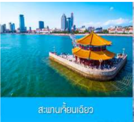
สะพานเจียงเจียว