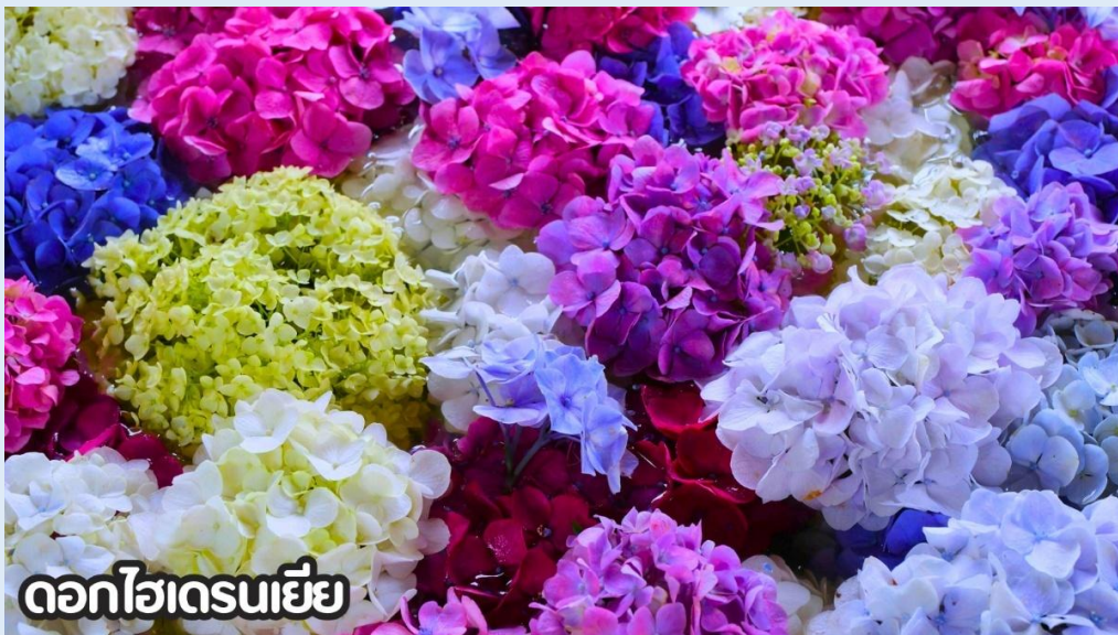
ดอกไฮเดรนเยีย

(ปลายเดือนพฤษภาคม-มิถุนายน): ชมดอกไม้ไฮเดรนเยีย ดอกไฮเดรนเยียที่คุนหมิง ประเทศจีน บานสะพรั่งสวยงามที่สุดในช่วงเดือนมิถุนายน โดยเฉพาะบริเวณทุ่งไฮเดรนเยีย (The Middle Sea Hydrangea Kunming) ซึ่งมีหลากสีทั้งฟ้า ชมพู และม่วง เป็นจุดถ่ายรูปยอดนิยมที่ห้ามพลาด เนื่องจากอากาศที่เย็นสบายและทิวทัศน์ที่งดงาม