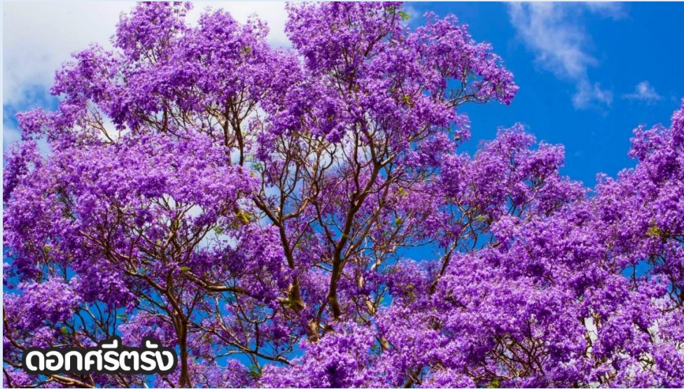
ดอกครีตรั่ง

(ปลายเดือนพฤษภาคม-มิถุนายน): ชมดอกไม้ไฮเดรนเยีย ดอกไฮเดรนเยียที่คุนหมิง ประเทศจีน บานสะพรั่งสวยงามที่สุดในช่วงเดือนมิถุนายน โดยเฉพาะบริเวณทุ่งไฮเดรนเยีย (The Middle Sea Hydrangea Kunming) ซึ่งมีหลากสีทั้งฟ้า ชมพู และม่วง เป็นจุดถ่ายรูปยอดนิยมที่ห้ามพลาด เนื่องจากอากาศที่เย็นสบายและทิวทัศน์ที่งดงาม