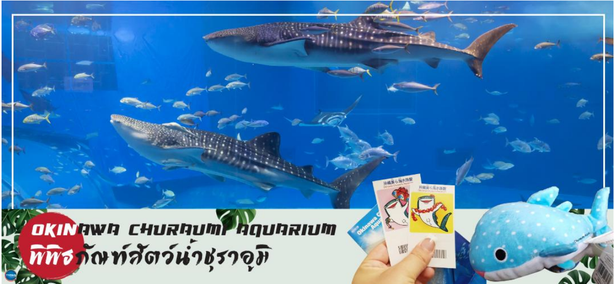
OKINAWA CHURAUMI AQUARIUM พิพิธภัณฑสัตว์น้ำชुरาอุมิ

เช้า รับประทานอาหารเช้า ณ ห้องอาหารของโรงแรม (1) นำท่านชม พิพิธภัณฑสัตว์น้ำชुरาอุมิ (OKINAWA CHURAUMI AQUARIUM) (ใช้เวลาเดินทางประมาณ 1.40 ชั่วโมง) เป็นพิพิธภัณฑสัตว์น้ำที่ดีที่สุดในประเทศญี่ปุ่น ไฮไลท!!! ของการเยี่ยมชมพิพิธภัณฑสัตว์น้ำแห่งนี้คือแหังก้นาคูโรชิโอะ ซึ่งเป็นหนึ่งใน แหังก้นาคูโรชิโอะที่ใหญ่ที่สุดในโลก ซึ่งภายในนั้นเต็มไปด้วยสิ่งมีชีวิตในทะเลแถบโอกินาวาที่หลากหลาย สัตว์น้ำที่โดดเด่นที่สุดคือฉลามวาฬยักษ์ และกระเบนราหู อีสระให้ท่านได้เพลิดเพลินกับสัตว์น้ำหลากหลายชนิด ทั้ง ปลาฉลาม ฉลามเสือ และฉลามวัว ปลาเรืองแสง ตลอดจนหอยต่างๆ นอกจากนี้ยังมีสระน้ำกลางแจ้งที่ตั้งอยู่ใกล้ริมน้ำซึ่งเป็นที่จัดการแสดงของโลมาแสนรู้ เต่าทะเล และพะยูน ที่จัดขึ้นเพียงไม่กี่ครั้งต่อวัน (ไม่มีค่าใช้จ่ายเพิ่มเติม แต่ต้องตรวจสอบเวลาการแสดงก่อนชมนะคะ)