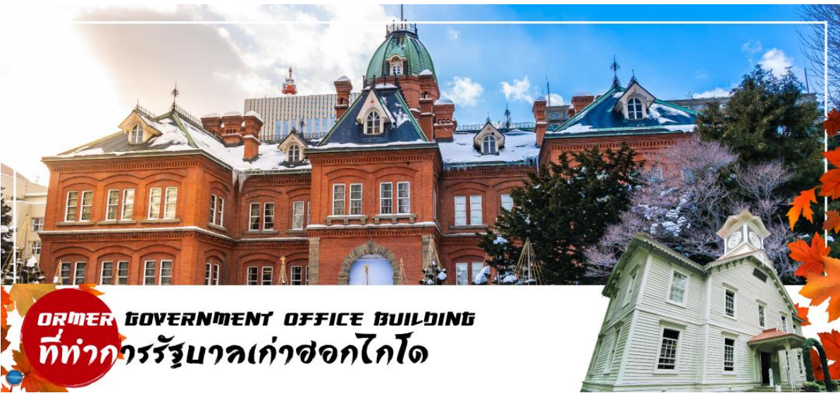
FORMER GOVERNMENT OFFICE BUILDING ที่ทำการรัฐบาลเก่าซอกไกโด

นำท่านเดินทางสู่ ย่านซุซุกิโนะ(Susukino) นับเป็นย่านที่เต็มไปด้วยแหล่งบันเทิงที่โด่งดังมากที่สุดของเมืองซัปโปโร(Sapporo) อีกทั้งยังเรียกได้ว่าเป็นย่านบันเทิงที่ใหญ่ที่สุดในทางตอนเหนือของญี่ปุ่นที่เดียวละคะ บอกเลยว่าอยากมาบันเทิงเริงใจยามค่ำคืนสัมผัสไลฟ์สไตล์แบบคนญี่ปุ่นแท้ๆ ต้องมาที่นี่ให้ได้เลยละคะ เพราะเต็มไปด้วยร้านค้า บาร์ ร้านอาหาร ร้านคาราโอเกะ และตู้ปลาจึงโกะรวมกว่า 4,000 ร้าน บางร้านนี้เปิดจนถึงเที่ยงเที่ยงคืน