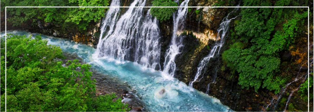
SHIRAHIGE WATERFALL น้ำตกชิราฮิเกะ

วันที่สอง ทำอากาศยานนิวยอร์กโตเสะ สอกโกโต – เมืองบิเอะ – น้ำตกชิราฮิเกะ – สระอะโออิเคะ หรือ บ่อน้ำสีฟ้า – เมืองอาซาฮิคาว่า – อีออน อาซาฮิคาว่า