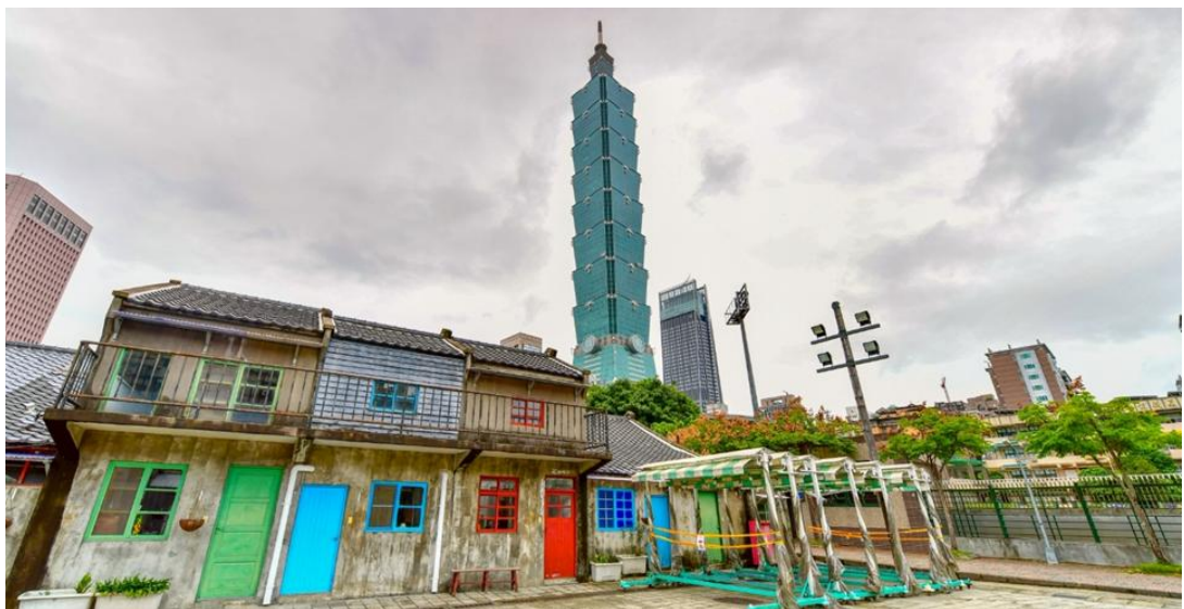
~ 4 ~

05.05 น. นำท่านออกเดินทางสู่สนามบินฮวาเหลียน โดยสายการบินไลออน แอร์ เที่ยวบินที่ SL7334 10.00 น. ถึงท่าอากาศยานฮวาเหลียน หลังจากผ่านพิธีการตรวจคนเข้าเมืองและศุลกากรเรียบร้อยแล้ว เที่ยง บริการอาหารกลางวัน (แซนวิช และ ชานม) จากนั้นนำท่านเดินทางไปยัง เมืองไทเป ชม หมู่บ้านทหารเก่าชื่อชื่อนานชุน ซึ่งถือว่าเป็นหมู่บ้านโบราณที่ตั้งอยู่ในเมือง ไทเปใกล้กับตึก Taipei 101 จากการอพยพมาตั้งถิ่นฐานของทหารก็กมินตั้ง