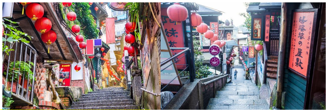
*เสาร์-อาทิตย์ต้องเปลี่ยนเป็นรถสาธารณะ

นำท่านเดินทางไปสัมผัสบรรยากาศ ถนนเก๋าว์เฟิน ที่ตั้งอยู่บริเวณไหล่เขาในเมืองจีหลง หมู่บ้านจิวเฟิน เคยเป็นแหล่งเหมืองทองที่มีชื่อเสียงตั้งแต่สมัยโบราณ ปัจจุบันเป็นสถานที่ท่องเที่ยวที่สำคัญแห่งหนึ่ง เพราะเป็นถนนคนเดินเก๋ากึ่งที่มีชื่อเสียงที่สุดในไต้หวันให้ท่านได้เพลิดเพลินบรรยากาศแบบดั้งเดิมของร้านค้าร้านอาหารของชาวไต้หวันในอดีตและสามารถชื่นชมวิทิวทัศน์ได้