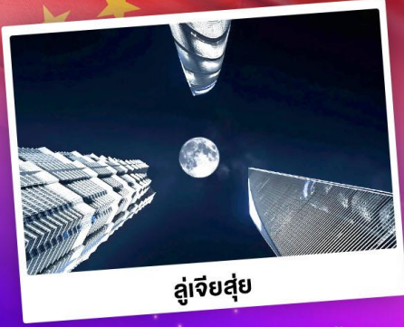
ดูเจียส่วย