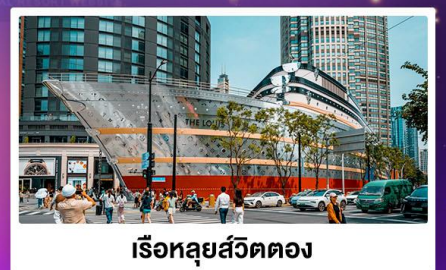
เรือหลุยส์วิตตอง