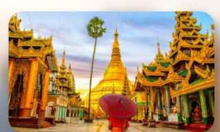
วัดจิ่งอัน