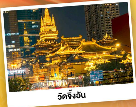
วัดจิ่งอัน

เที่ยว 2 เมือง หางโจว-มณฑลเซี่ยงไฮ้ ตะลุยเมืองซูโกเปีย ชมพลุดิสนีย์แลนด์สุดอลังการ