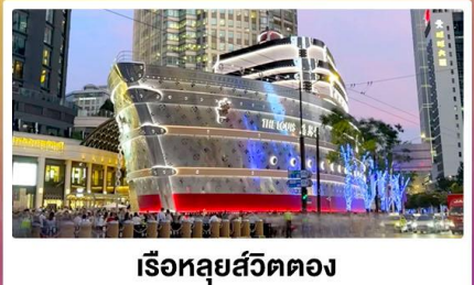
เรือหลุยส์วิตตอง