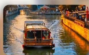
ล่องเรือ Grand Canal