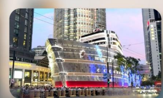
เรือทลุยส์วิตตอง