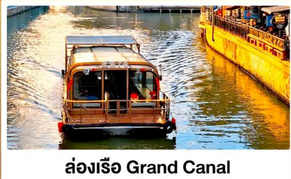
ล่องเรือ Grand Canal