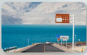
ทะเลสาบไป่ซาหู