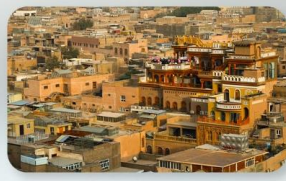
เมืองเก่าคีซการ์