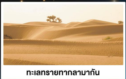
ทะเลทรายทากลามากัน