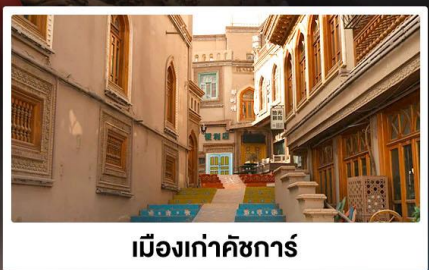
เมืองเก่าคัชการ