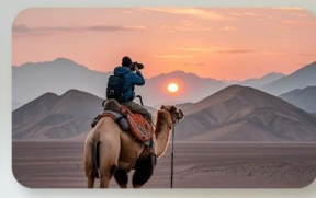
ทะเลทรายทากลามากัน