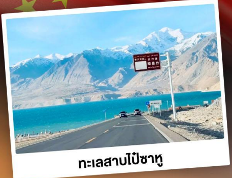
ทะเลสาบไ畢沙湖