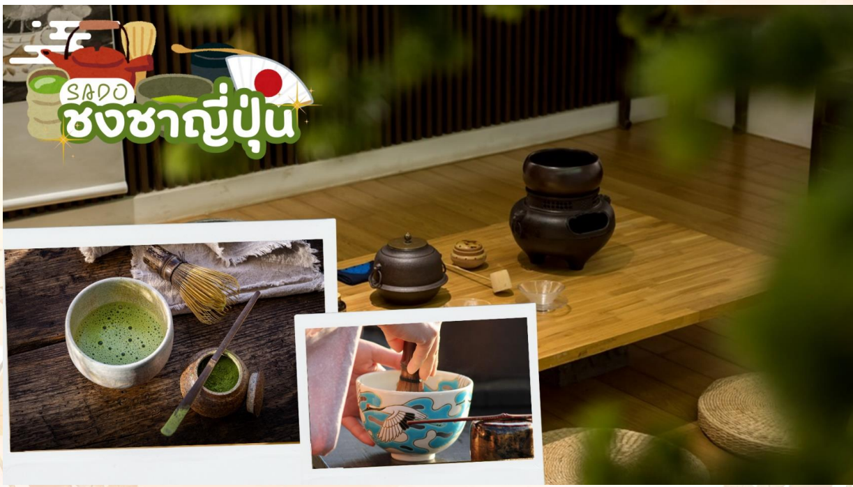
GO2HND-TG056 – TOKYO OSAKA OBARA KORANKEI AUTUMN 6D 4N BY [TG]

สัมผัสวัฒนธรรมดั้งเดิมของชาวญี่ปุ่น นั่นก็คือ กิจกรรมการชงชาญี่ปุ่น (Sado) โดยการชงชาตามแบบญี่ปุ่นนั้น มีขั้นตอนมากมาย เริ่มตั้งแต่การชงชา การจับถ้วยชา และการดื่มชา ทุกขั้นตอนนั้นล้วนมีขั้นตอนที่มีรายละเอียดที่ประณีตและสวยงามเป็นอย่างมาก และท่านยังมีโอกาสได้ลองชงชาด้วยตัวท่านเองอีกด้วย ซึ่งก่อนกลับให้ท่านอิสระเลือกซื้อของที่ฝากของที่ระลึกตามอัธยาศัย