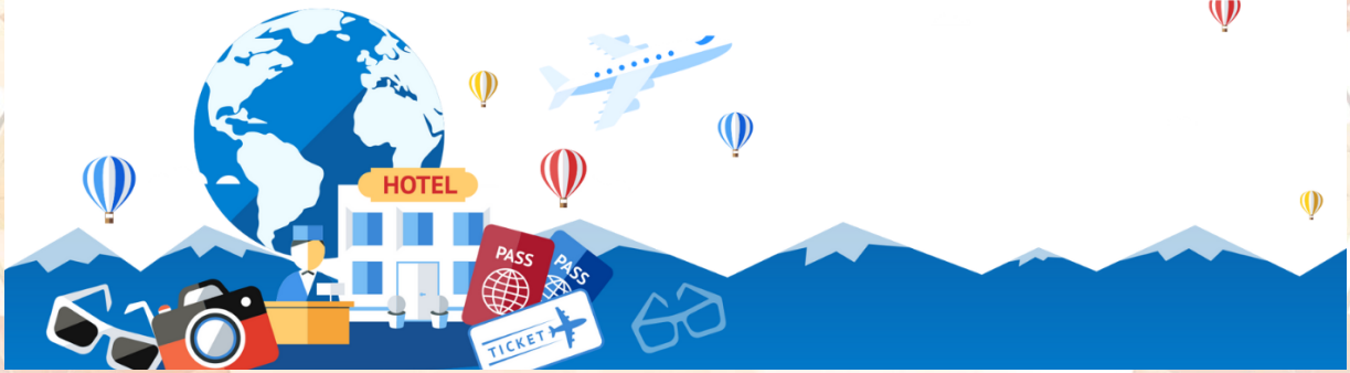
GO2HND-TG056 – TOKYO OSAKA OBARA KORANKEI AUTUMN 6D 4N BY [TG]