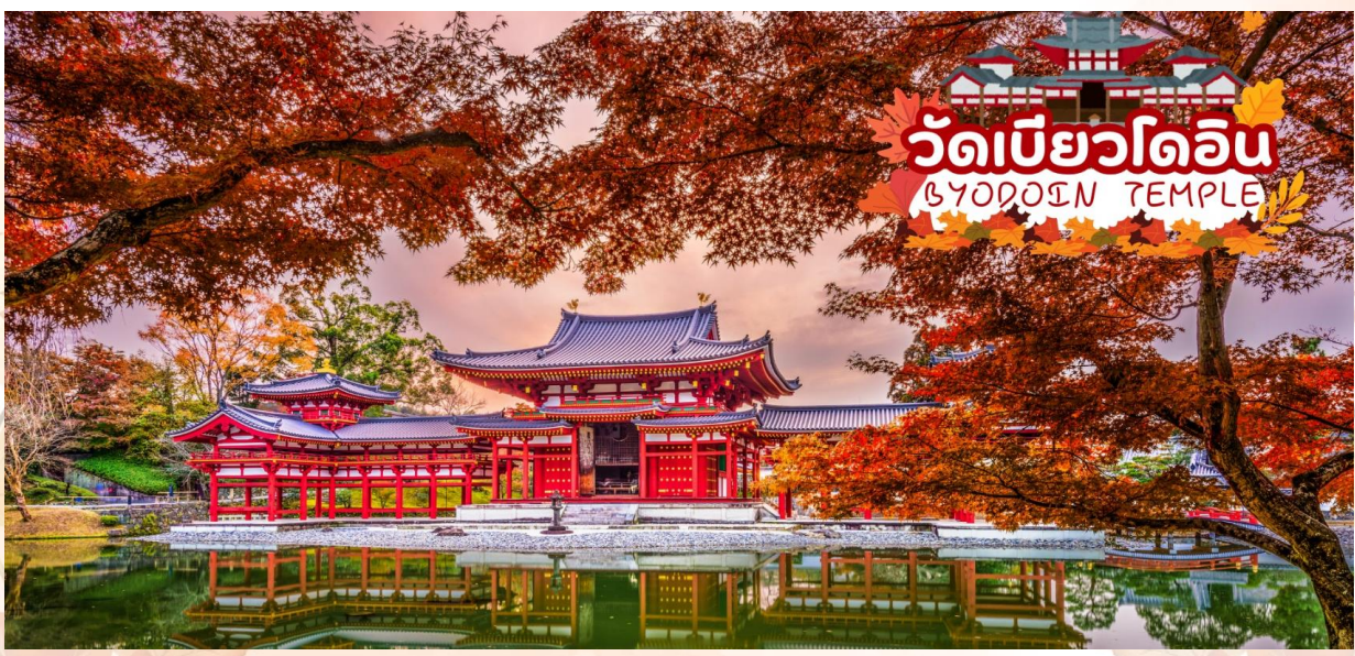
GO2HND-TG056 – TOKYO OSAKA OBARA KORANKEI AUTUMN 6D 4N BY [TG]

กลางวัน รับประทานอาหารกลางวัน ณ ร้านอาหาร (มื้อที่ 6)