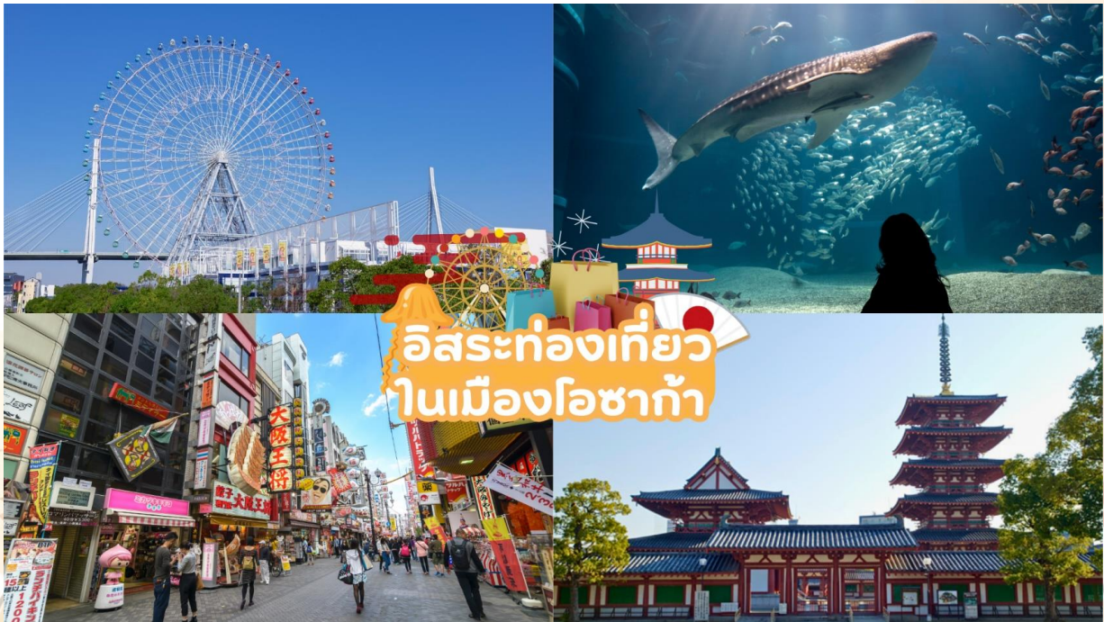
GO2HND-TG056 – TOKYO OSAKA OBARA KORANKEI AUTUMN 6D 4N BY [TG]

ให้ท่านได้เลือก อิสระท่องเที่ยวตามสถานที่ต่าง ๆ ใน เมืองโอซาก้า โดยมีไกด์คอยให้คำแนะนำท่านในการเดินทาง ย่านชินไซบาชิ เต็มไปด้วยความหลากหลายของร้านค้าและแบรนด์ดังมากมายตั้งอยู่ปะปนไปกับร้านค้าแบบดั้งเดิมของญี่ปุ่น ได้แก่ Apple Store, Dior, Chanel, Gucci, H&M, Hermès, Louis Vuitton และอื่น ๆ เรียกได้ว่าเป็นศูนย์รวมแทบจะทุกยี่ห้อดังทั่วโลกเลยก็ว่าได้ นอกจากนี้แล้วยังมีสินค้าจำพวกอาหารและเครื่องดื่มหรือตุ๊กตาน่ารัก ๆ ก็มีให้เลือกซื้อเช่นกัน และนอกเหนือไปจากร้านค้าทันสมัยจากแบรนด์ต่าง ๆ แล้วที่ชินไซบาชิยังมี Shopping Arcade ที่เอาร้านค้าเล็ก ๆ มารวมไว้ภายใต้หลังคาเดียวกันมีเส้นทางยาวประมาณ 600 เมตร มีสินค้าให้เลือกสรรมากมาย อาทิ ชุดกิโมโนแบบดั้งเดิม, วิทยุ, เครื่องประดับและร้านหนังสือ เป็นแหล่งที่ตั้งของห้างสรรพสินค้าชื่อดังและร้านค้ามากมายให้ท่านได้ช้อปปิ้งได้จุใจ และยังมีสถานที่ท่องเที่ยวที่สำคัญ ๆ ต่าง ๆ มากมาย เช่น วัดชิเทนโนจิ พิพิธภัณ์สัตว์น้ำไคยูกัง, ศาลเจ้าเฮอัน, ชิงช้าสวรรค์เท็มโปซาน, อะเมะริคามูระ, เลโกแลนด์, หุ่นยนต์เหล็กเท็ตสึจิน, พิพิธภัณ์วิทยาศาสตร์โอซาก้า