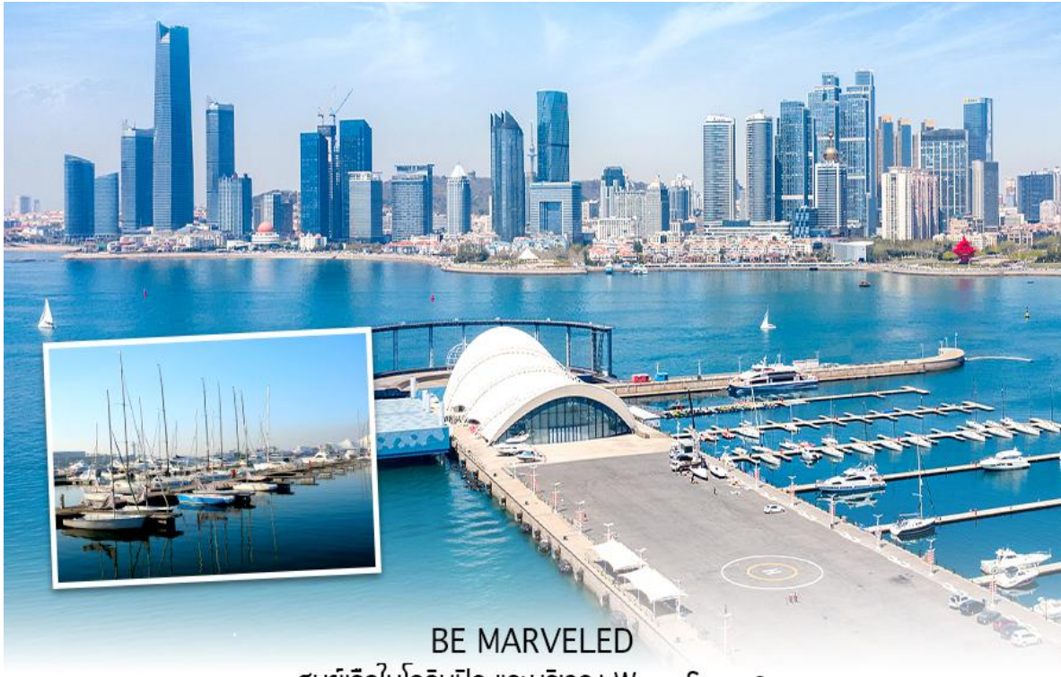
BE MARVELED ศูนย์เรือใบโอลิมปิก และบริเวณ Wasu Square

จากนั้นนำท่านไป ถนนคนเดินสไตล์เยอรมัน การผสมผสานของวัฒนธรรมจีนและเยอรมันเหมือน เดินเล่นอยู่ในยุโรป บรรยากาศดี คึกคัก โดยเฉพาะช่วงเวลากลางคืน สามารถช้อปปิ้ง ถ่ายรูปเล่นได้