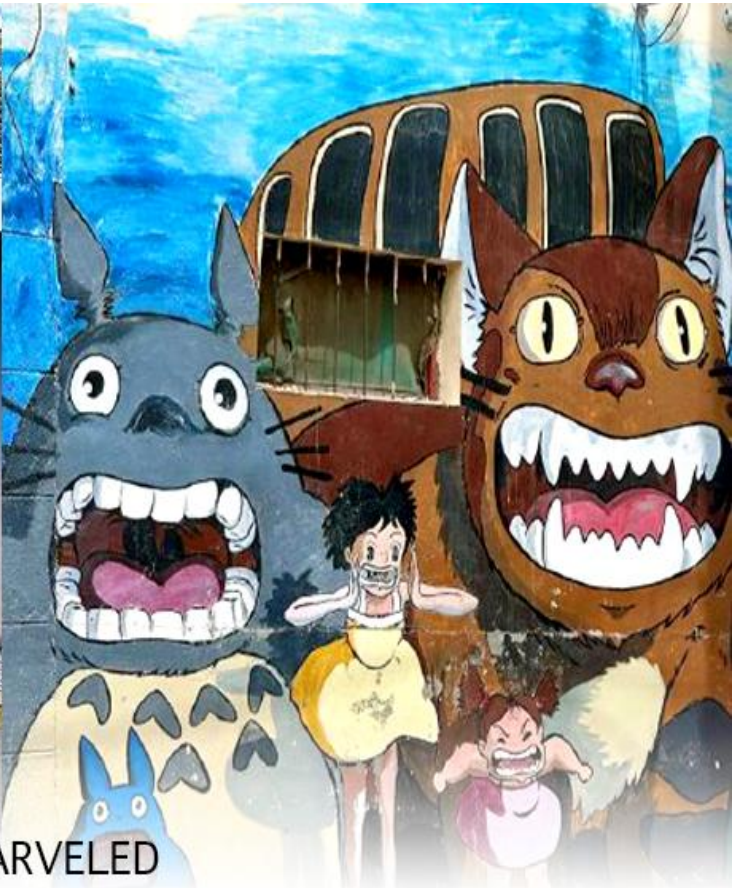
BE MARVELED ถนนสตรีอาร์ทหลงเจียง

จากนั้นนำท่านไปชม ทุ่งดอกฟิงค์มอส เป็นสวนดอกไม้ขนาดใหญ่ ในช่วงฤดูใบไม้ผลิทุ่งหญ้าจะปกคลุมไปด้วยดอกฟิงค์มอส ลักษณะของดอกฟิงค์มอสคล้ายดอกซากุระแต่บานบนพื้นดิน ออกดอกหนาแน่นสีชมพู ขาว และม่วง เป็นดอกไม้พุ่มเตี้ย ดอกขนาดเล็ก จะบานสะพรั่งเป็นพรมดอกไม้ เหมาะสำหรับการเดินเล่น ชมดอกไม้ ถ่ายรูป