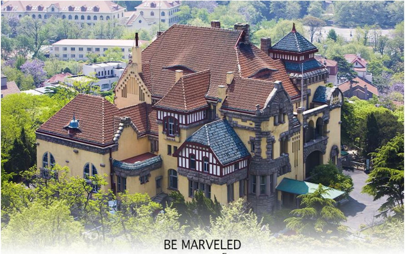
BE MARVELED พระตำหนักกรงจุฬาลงกรณ์