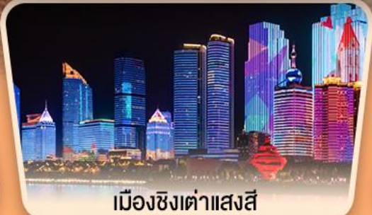
เมืองชิงเต่าแสงสี