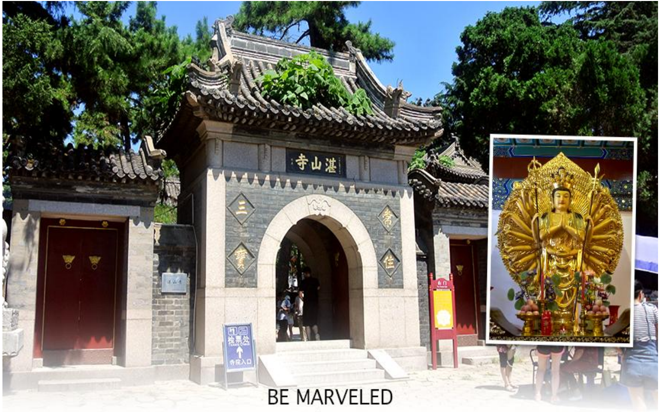
BE MARVELED วัดจ้านซาน

เมืองชิงเต่า สถานที่ที่สงบ และบรรยากาศภายในวัดที่ร่มรื่น ตั้งอยู่เหนือเนินเขาจากสวนสาธารณะ จงซาน ก่อตั้งในปี พ.ศ. 2477 เป็นวัดอายุน้อยที่สุดในนิกายเทียนโถงของพุทธศาสนาจีน แต่โดดเด่น ด้วยสถาปัตยกรรมและคุณค่าทางวัฒนธรรม