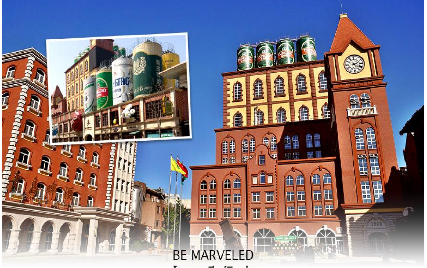
BE MARVELED โรงงานเบียร์ซิงเต่า