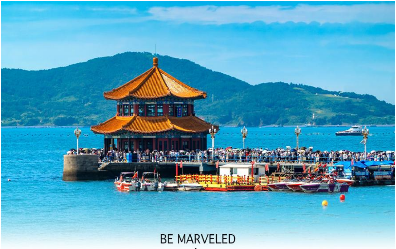
BE MARVELED สะพานจ้านเจียว

จากนั้นนำท่านเดินทางไป สะพานจ้านเจียว (Zhanqiao Pier) สะพานนี้สร้างขึ้นในสมัยราชวงศ์ชิง เมื่อปี ค.ศ. 1892 เพื่อใช้ขนส่งทางทหาร แต่ปัจจุบันกลายเป็นจุดชมวิว และมีการปรับปรุงขยาย สะพานเพิ่มจาก 200 เมตร เป็น 440 เมตร โดยปลายทางของสะพานเป็น ศาลาหุยหลาน (Hui Lan Ge) ทรงแปดเหลี่ยม 2 ชั้น คลุมด้วยกระเบื้องเคลือบสีน้ำตาล ภายในมีบันไดวน 34 ขั้น เมื่อขึ้นไปยังจุดชมวิวที่มองเห็นทะเลทอดยาวสุดสายตา ยังเป็นจุดที่นักท่องเที่ยวนิยมมาชมพระอาทิตย์ขึ้น และพระอาทิตย์ตก