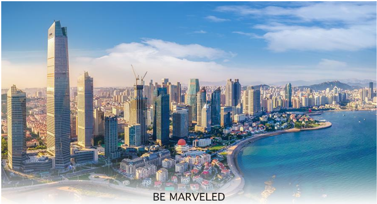
BE MARVELED เมืองชิงเต่า

02.25 น. ออกเดินทางสู่ สนามบินชิงเต่า โดยสายการบิน Shandong Airlines (SC) เที่ยวบินที่ SC4080 บริการ SNACK บนเครื่อง 07.58 น. เดินทางถึง สนามบินชิงเต่า เมืองชิงเต่าเป็นเมืองชายทะเลที่ตั้งอยู่ทางตอนใต้ของมณฑลซานตง ประเทศจีน มีชื่อเสียงจากบรรยากาศที่ผสมผสานระหว่างสถาปัตยกรรมสไตล์ยุโรปสมัยอาณานิคมกับความทันสมัยของจีนอย่างลงตัว เมืองนี้เป็นเมืองที่รู้จักในฐานะบ้านเกิดของเบียร์ชิงเต่า (Tsingtao Beer) ที่มีชื่อเสียงระดับโลก