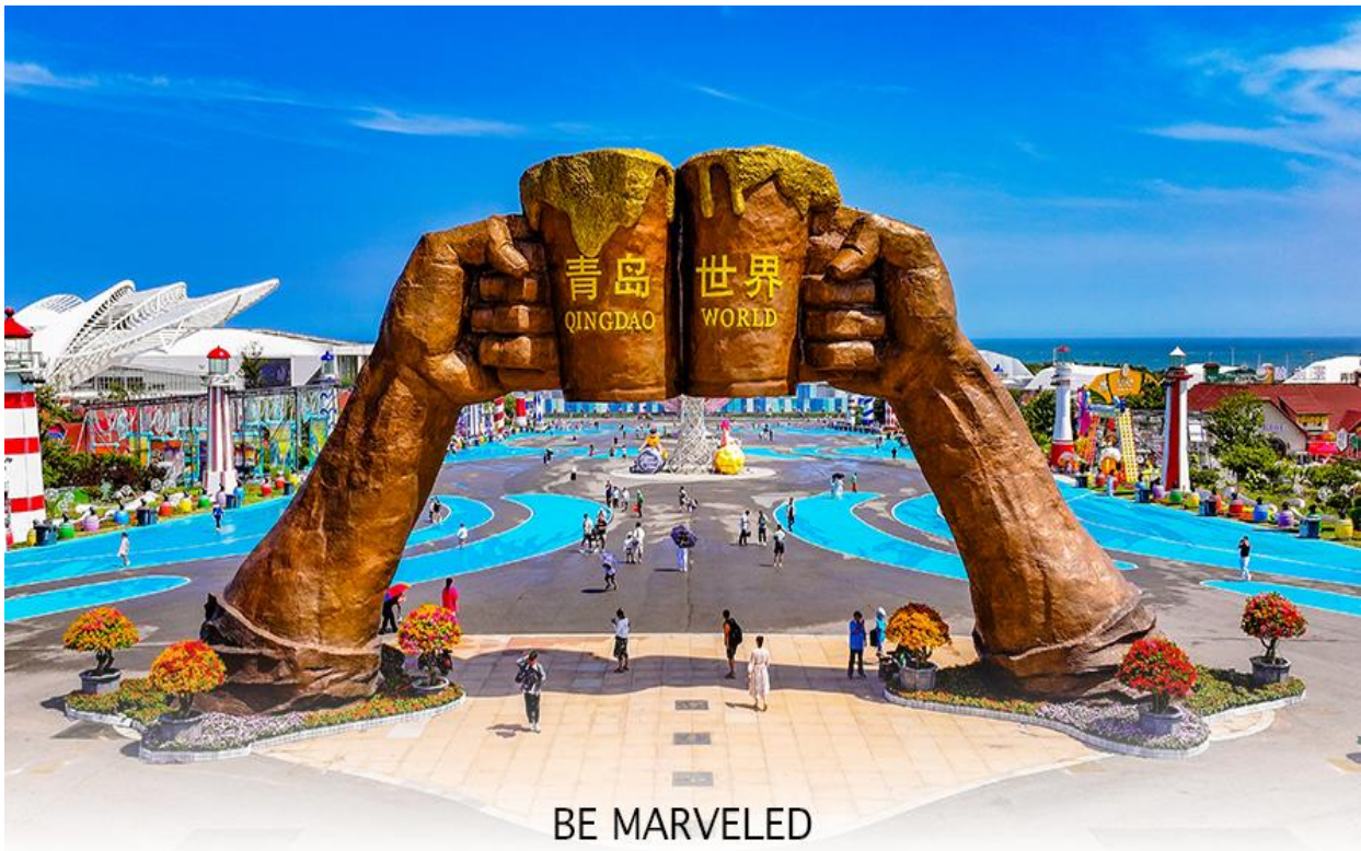
BE MARVELED QINGDAO INTERNATIONAL BEER FESTIVAL

หลังรับประทานอาหารเช้า นำท่านนั่งรถผ่าน อุโมงค์ใต้ทะเลไปเขตชิงเต่าซีอันเหวียน จากนั้นนำท่านเดินทางไป QINGDAO INTERNATIONAL BEER FESTIVAL เทศกาลเบียร์นานาชาติชิงเต่าหรือเทศกาลเบียร์ขนาดใหญ่และมีชื่อเสียงที่สุดงานหนึ่งในเอเชีย จัดขึ้นเป็นประจำทุกปีที่เมืองชิงเต่า มณฑลซานตง ประเทศจีน โดยมีกิจกรรมที่หลากหลาย เช่น การดื่มเบียร์จากหลายประเทศ การแสดง แสง สี เสียง คอนเสิร์ต สวนสนุก และการแข่งขันต่างๆ เทศกาลนี้ได้รับความนิยมจากทั้งนักท่องเที่ยวชาวจีนและชาวต่างชาติ และมีเบียร์จากกว่า 40 ประเทศทั่วโลกเข้าร่วม