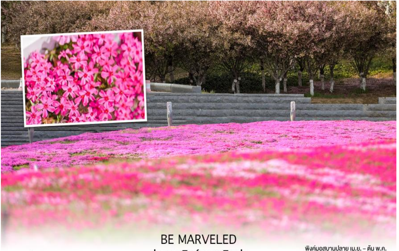
*ภาพเพื่อการโฆษณา