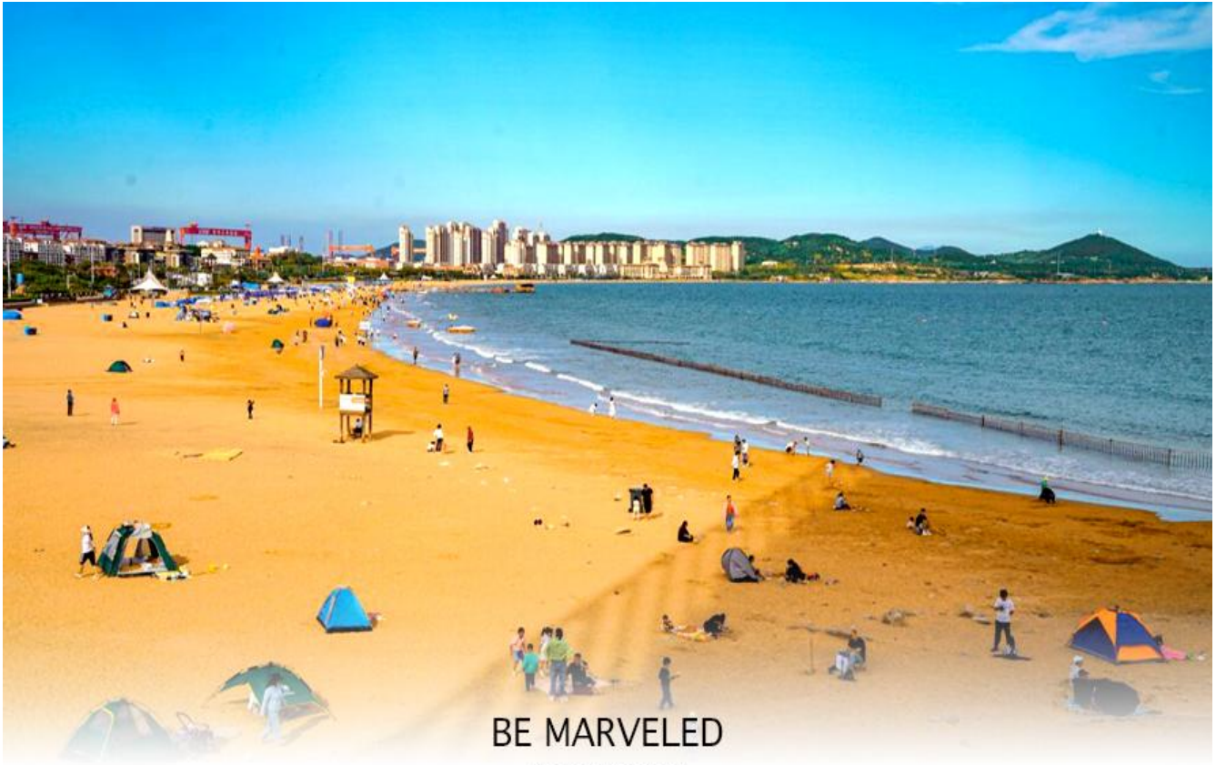
BE MARVELED หาดจินซาตาน

และชม หาดจินซาตาน ตั้งอยู่ในเขตหวงเต่า ของเมืองชิงเต่า มณฑลซานตง เป็นชายหาดที่ใหญ่ที่สุดและสวยที่สุดแห่งหนึ่งในเมืองชิงเต่า มีชื่อเสียงจากเม็ดทรายที่ละเอียดและมีสีเหลืองทองระยิบระยับ น้ำทะเลใสสะอาดและมีกิจกรรมหลากหลาย เช่น ว่ายน้ำ วอลเลย์บอลชายหาด และเครื่องเล่นทางน้ำ มีการจัดเทศกาลวัฒนธรรมและการท่องเที่ยวหาดทรายทองเป็นประจำทุกปีในช่วงฤดูร้อน