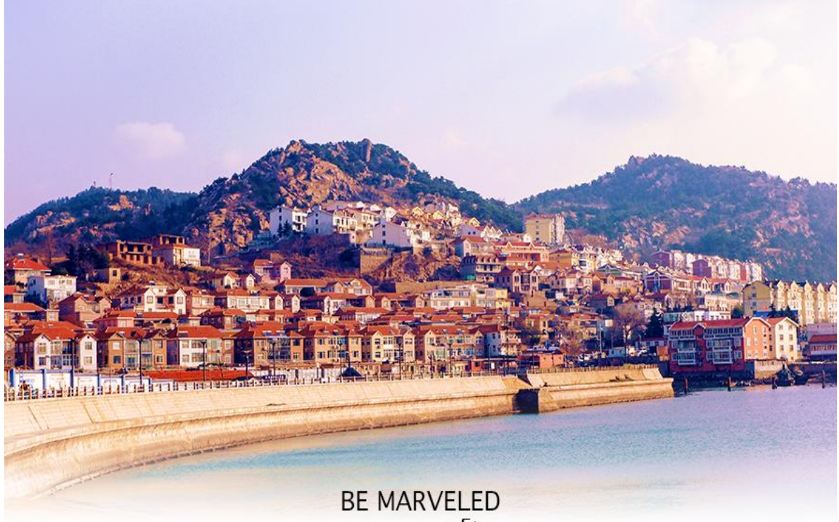
BE MARVELED ชายหาดซาจือโข่ว

จากนั้นนำท่านเดินไปสู่ ชายหาดซาจือโข่ว หมู่บ้านชาวประมง เก้าแก่ ของเมืองชิงเต่า เป็นจุด เช็คอินที่มีทัศนียภาพที่สวยงามคล้ายชายฝั่ง Cinque Terre ของอิตาลี ที่มีลักษณะบ้านเรือนที่มีสีสัน สดใสดั่งอยู่บนเนินเขาตัดกับท้องทะเลสีฟ้า สถานที่ยอดฮิตในการมาพักผ่อนหย่อนใจที่เมืองชิงเต่า มีทั้งสวนสาธารณะ และกิจกรรมมากมายให้ทำ