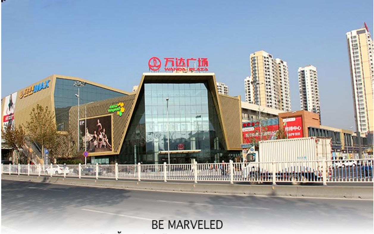
BE MARVELED ช้อปปังศูนย์การค้า (Qingdao Wanda Plaza)

ที่พัก HOLIDAY INN EXPRESS QINDAO หรือเทียบเท่าระดับ 4 ดาว