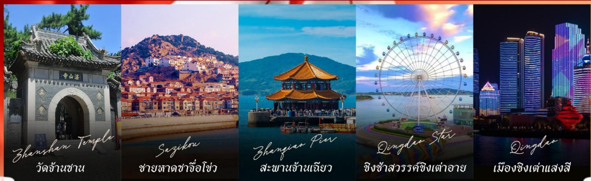
Zhanzhan Temple วัดจันซาน

รายการทัวร์ข้างต้นอาจมีการปรับเปลี่ยนเพื่อความเหมาะสม