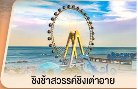
ชิงช้าสวรรค์ชิงเต่าอาย