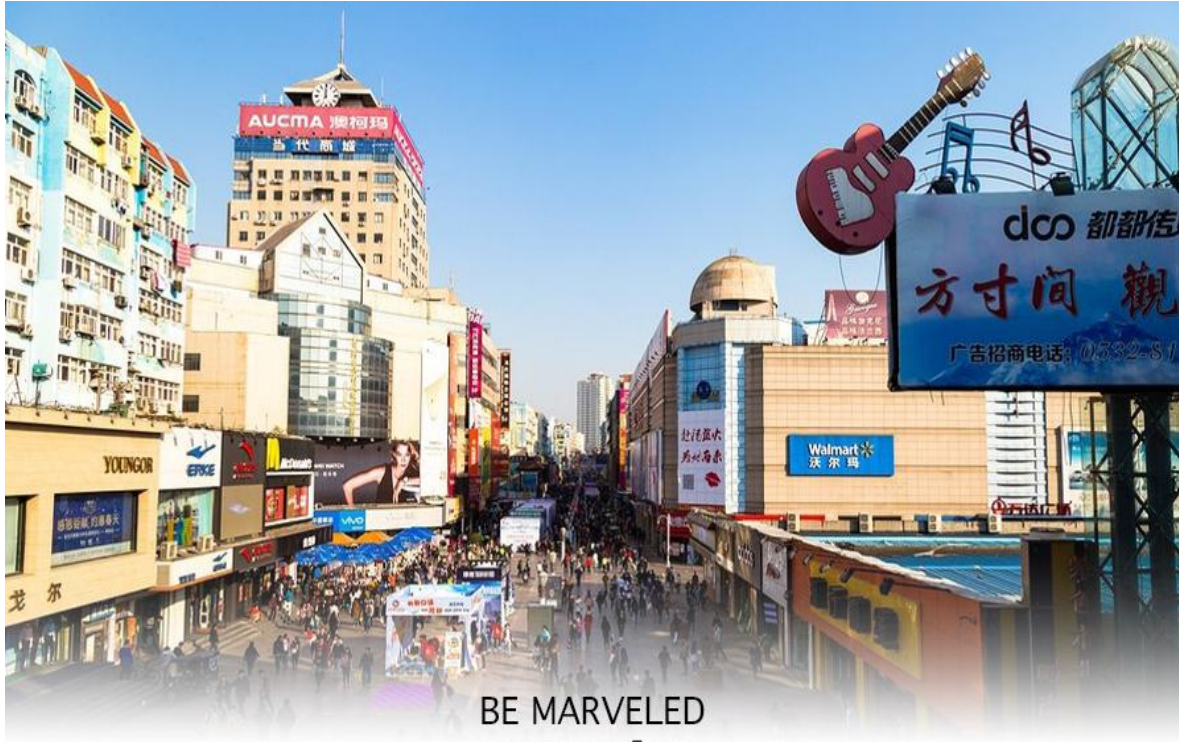
BE MARVELED ถนนคนเดินโกตง

ที่พัก HOLIDAY INN EXPRESS QINDAO หรือเทียบเท่าระดับ 4 ดาว