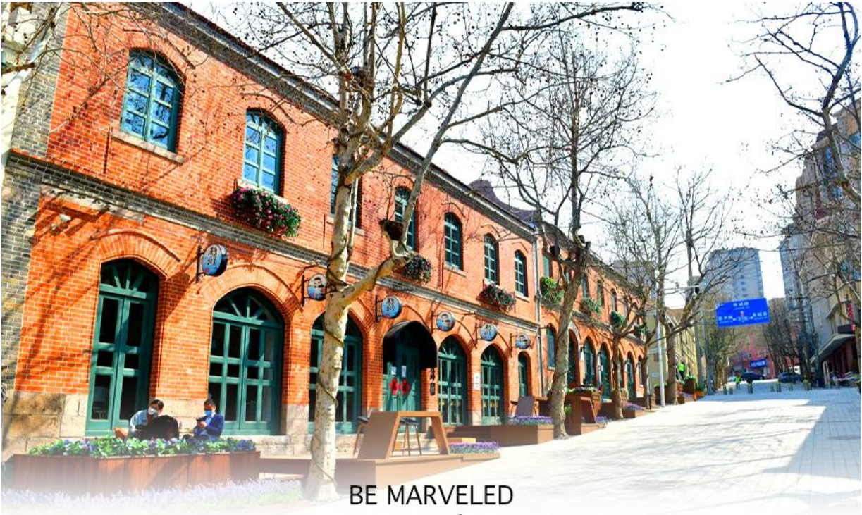
BE MARVELED ย่านวัฒนธรรมต้าป่าวเต่า

จากนั้นนำท่านเดินทางไป ถนนคนเดินจงซานหลู่ เป็นถนนการค้าเก่าแก่ที่มีชื่อเสียง เป็นศูนย์กลางแฟชั่นและย่านช้อปปิ้งสำคัญของเมือง นอกจากนี้ ยังมี "สวนจงซาน" (Zhongshan Park) ซึ่งเป็นสวนสาธารณะขนาดใหญ่ใจกลางเมือง