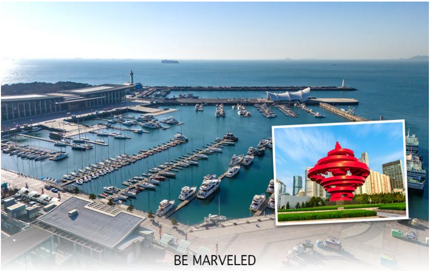
BE MARVELED ศูนย์การแข่งขันทอพอฟฟานด์ชิงเต่า หรือเรียกว่า Olympic Sailing Center

จากนั้นนำท่านไปสู่ จัตุรัสอู่ชี (May Fourth Square / Wusi Guangchang) จัตุรัสกลางเมืองที่สร้างขึ้นเพื่อรำลึกถึง ขบวนการ 4 พฤษภาคม ซึ่งมีเหตุการณ์สำคัญทางประวัติศาสตร์จีนในปี ค.ศ. 1919 เพื่อระลึกถึงการต่อสู้ของนักศึกษาที่เรียกร้องให้ญี่ปุ่นคืนชิงเต่าให้กับจีน จุดเด่นที่สุดของจัตุรัสนี้คือ ประติมากรรมสีแดงขนาดใหญ่ชื่อว่า ลมแห่งเดือนพฤษภาคม (May Wind) ที่มีรูปทรงเกลียวหมุนคล้ายเปลวไฟ สื่อถึงพลังแห่งเยาวชนและความหวังของประเทศ จนกลายเป็นสัญลักษณ์ของเมืองชิงเต่าที่โดดเด่นทั้งกลางวันและกลางคืน