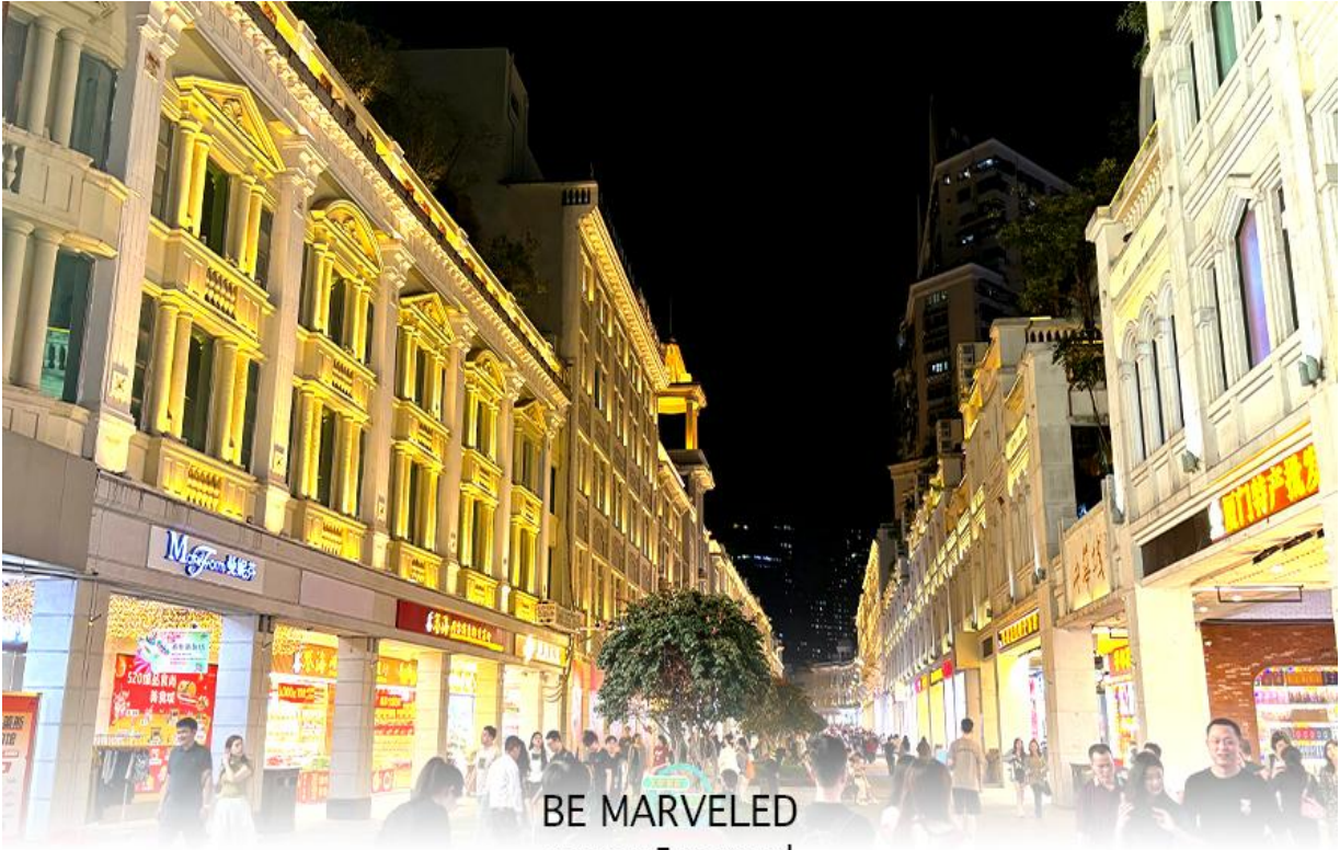
BE MARVELED ถนนคนเดินจงซานหลู่

จากนั้นนำท่านเดินทางไป ถนนคนเดินจงซานหลู่ เป็นถนนการค้าเก่าแก่ที่มีชื่อเสียง เป็นศูนย์กลางแฟชั่นและย่านช้อปปิ้งสำคัญของเมือง นอกจากนี้ ยังมี "สวนจงซาน" (Zhongshan Park) ซึ่งเป็นสวนสาธารณะขนาดใหญ่ใจกลางเมือง